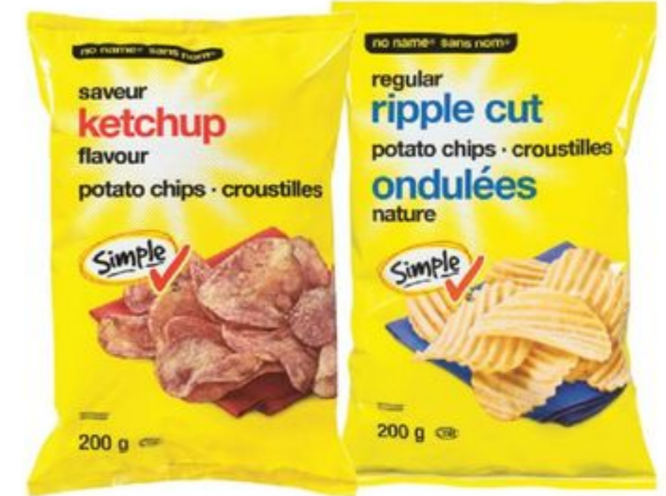
croustilles sans nom® certaines variétés 200 g no name® potato chips selected varieties 21302821_EA/21302932_EA