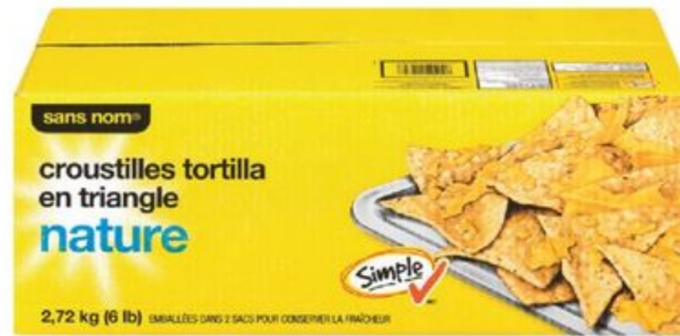
croustilles de tortilla sans nom® 2 x 1,36 kg no name® tortilla chips 21124423_EA