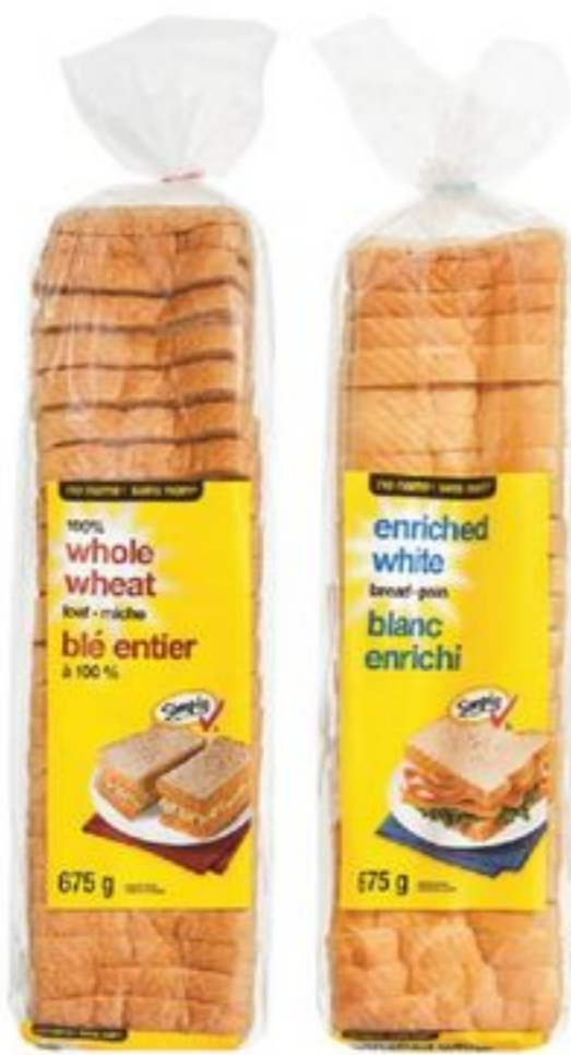
pain sans nom® blanc ou blé entier 675 g no name® bread white or whole wheat 20169852_EA/20309640_EA