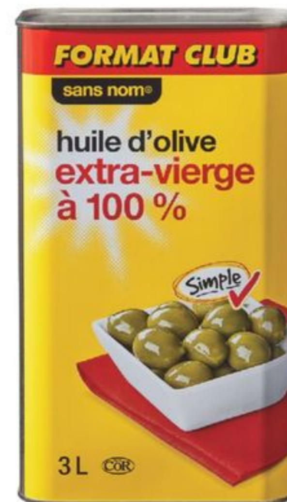
huile d'olive sans nom® format club, 3 L no name® olive oil club size 20141395_EA