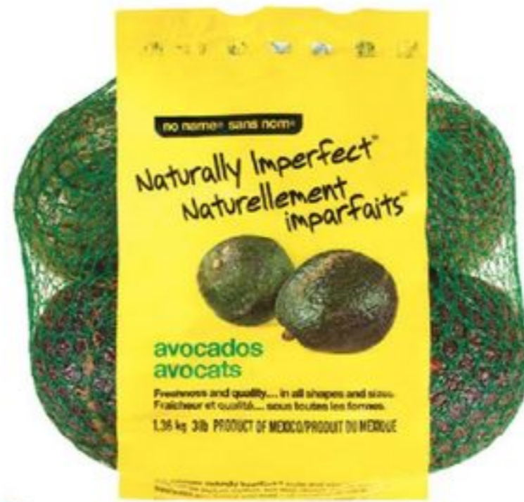
avocats Naturellement imparfaits MC sans nom® produit du Mexique, 3 lb no name® Naturally Imperfect™ avocados product of Mexico 21086003001_EA