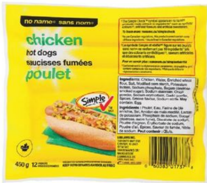
saucisses fumées de poulet sans nom® 450 g no name® chicken wieners 20058192_EA