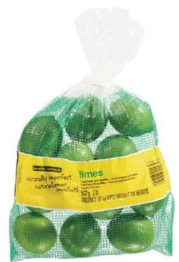
limes Naturellement imparfaits MC sans nom® produit du Mexique, 907 g no name® Naturally Imperfect™ limes product of Mexico 21124368001_EA