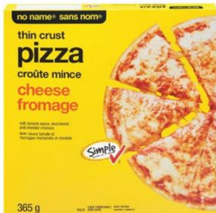
pizza sans nom® certaines variétés, surgelée, 350/369 g no name® pizza selected varieties, frozen 21541429_EA/21541441_EA