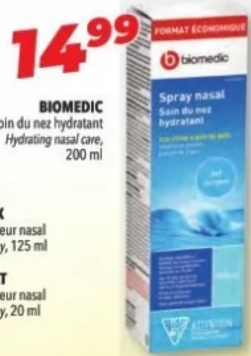
BIOMEDIC Soin du nez hydratant Hydrating nasal care, 200 ml