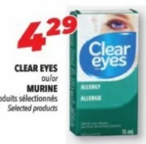
CLEAR EYES ou/ou MURINE Produits sélectionnés Selected products