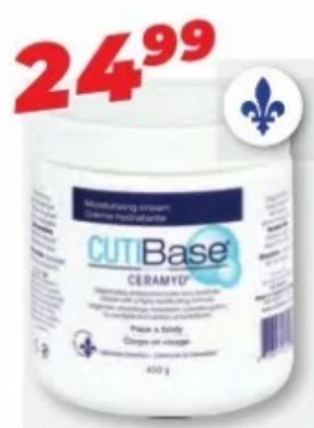
CUTIBASE Ceramyd, Crème hydratante Moisturizing cream, 400 g ou/ou 450 g