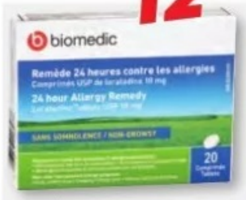
BIOMEDIC Loratadine, Allergies/Allergy, 10 mg, 20 comprimés/tablets