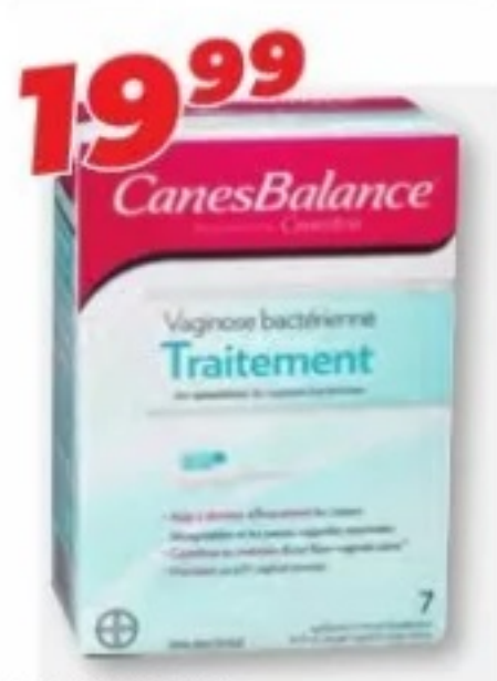
CANESBALANCE Gel vaginal/Vaginal gel, 7 applicateurs internes/Internal applicators