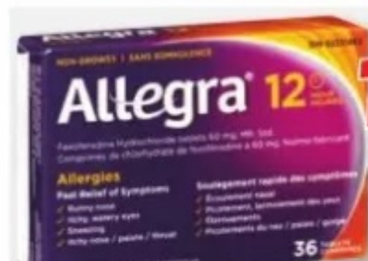
ALLEGRA Allergies/Allergy, 60 mg, 36 comprimés/tablets