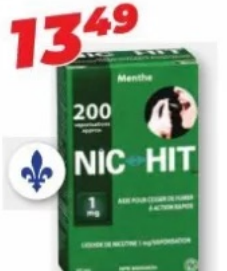
NIC-HIT Liquide de nicotine/Nicotine liquid, vaporisation/spray, 1 mg, 30 ml