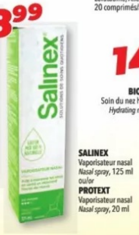
SALINEX Vaporisateur nasal Nasal spray, 125 ml ou/ou PROTEXT Vaporisateur nasal Nasal spray, 20 ml