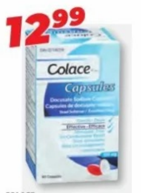
COLACE Émoullient fécal/Stool softener, 100 mg, 60 capsules