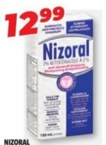
NIZORAL Shampooing antipelliculaire Anti-dandruff shampoo, 120 ml ou/ou Revitalisant/Conditioner, 278 ml