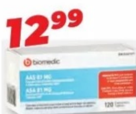
BIOMEDIC AAS 81 mg enrobé à faible dose quotidienne ASA coated daily low dose, 120 comprimés/tablets