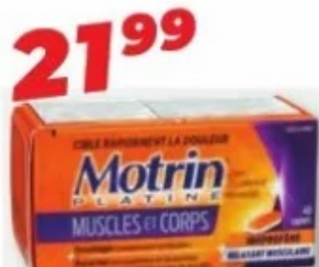
MOTRIN ou/ou TYLENOL Produits sélectionnés Selected products