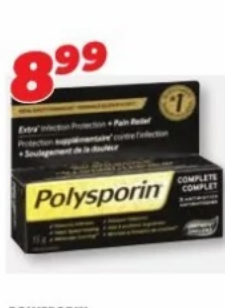
POLYSPORIN Produits sélectionnés Selected products