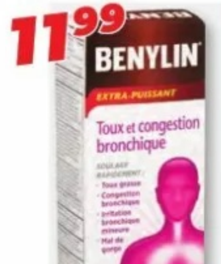
BENLYN Strops sélectionnés Selected syrups, 250 ml