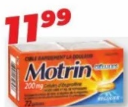
MOTRIN Ibuprofène/Ibuprofen, 200 mg, 72 gélules/capsules ou/ou 90 comprimés/tablets ou/ou Platine Ibuprofène + Relaxant musculaire Ibuprofen + Muscle relaxant, 18 caplets