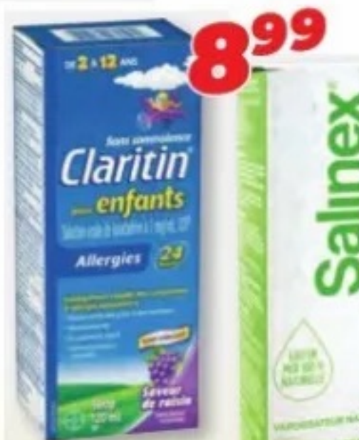
CLARITIN ou/ou AERIUS Enfants/Kids, Allergies/Allergy, 100 ml ou/ou 120 ml