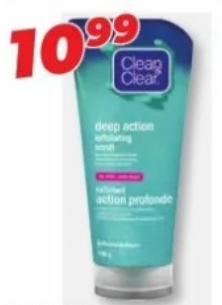
CLEAN & CLEAR Acné et soins de la peau/Acne and skin care, produits sélectionnés/selected products