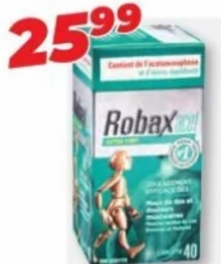
ROBAXACET ou/ou ROBAXISAL Extra fort, Maux de dos et douleurs musculaires/Extra strength, back and muscle pain, 40 caplets