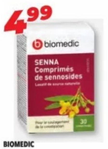
BIOMEDIC Senna, Pour le soulagement de la constipation For relief of constipation, 30 comprimés/tablets