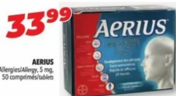
AERIUS Allergies/Allergy, 5 mg, 50 comprimés/tablets

Cette publicité est payée en collaboration avec Haleon. / This advertisement has been paid in collaboration with Haleon. M. de c. détenues ou utilisées sous licence par Haleon. ©2023 Haleon ou son concédant de licence. / Trademarks owned or licensed by Haleon. ©2023 Haleon or licensor.