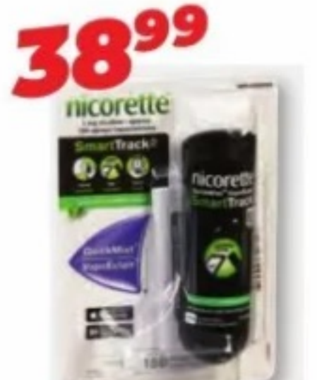
NICORETTE SmartTrack, VapoÉclair/Quick Mist, 1 mg, 150 vaporisations/sprays