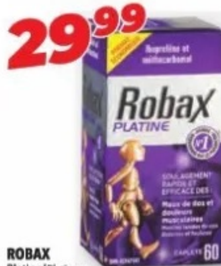
ROBAX Platine/Platinum, ROBAXACET ou/ou ROBAXIN Maux de dos et douleurs musculaires Back and muscle pain, produits sélectionnés/selected products