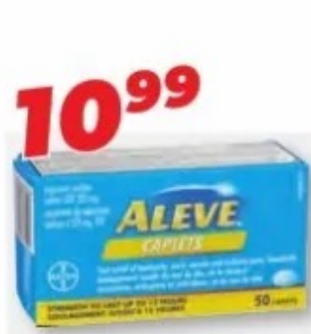
ALEVE Naproxène/Naproxen, 220 mg, 50 capsules ou/ou Nuit/Nighttime, 20 caplets