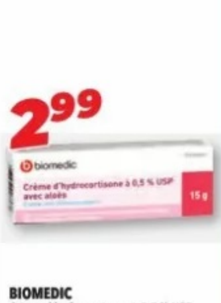
BIOMEDIC Crème d'hydrocortisone à 0,5 % USP avec aloès/Hydrocortisone cream 0.5 % USP with aloe, 15 g