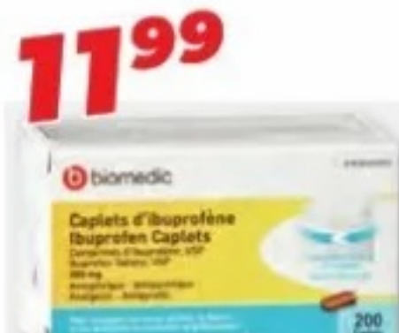
BIOMEDIC Ibuprofène/Ibuprofen, 200 mg, 200 caplets