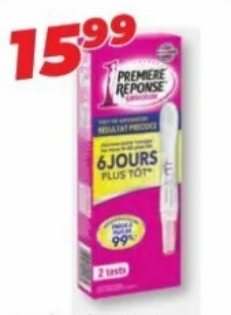
PREMIÈRE RÉPONSE/FIRST RESPONSE Tests de grossesse sélectionnés Selected pregnancy tests