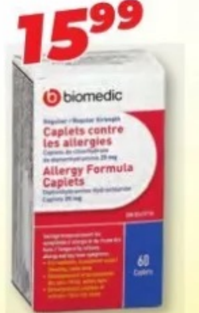
BIOMEDIC Allergies/Allergy, 25 mg, 60 caplets