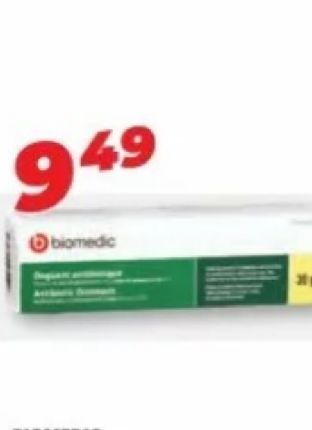
BIOMEDIC Onguent antibiotique Antibiotic ointment, 30 g