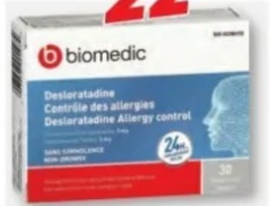
BIOMEDIC Desloratadine, Contrôle des allergies Allergy control, 5 mg, 30 comprimés/tablets