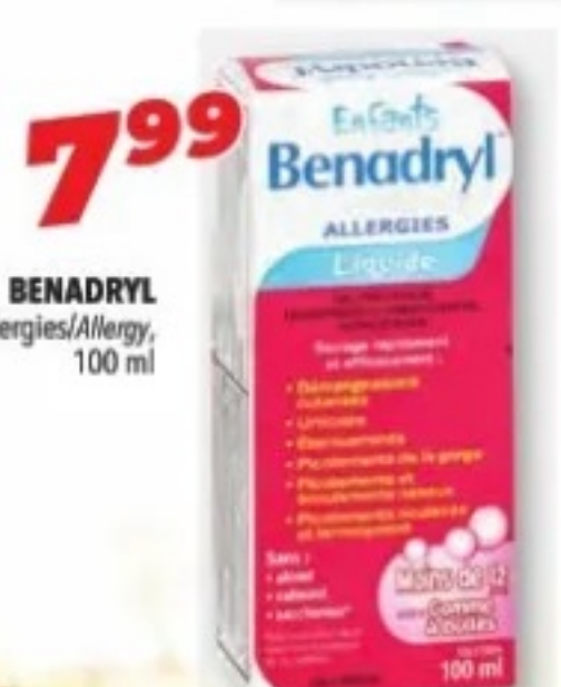
BENADRYL Allergies/Allergy, 100 ml