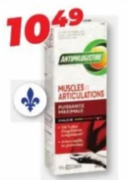
ANTIPHLOGISTINE Produits sélectionnés Selected products