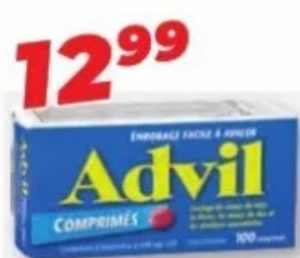
ADVIL Ibuprofène/Ibuprofen, 200 mg, 100 comprimés/tablets ou/ou 100 caplets