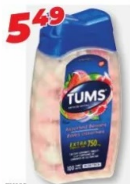
TUMS Antiacides sélectionnés Selected antacids