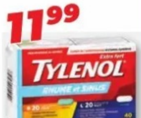
TYLENOL Rhume, Sinus ou Rhume et Sinus Cold, Sinus or Cold and Sinus, produits sélectionnés/selected products, 40 unités/units