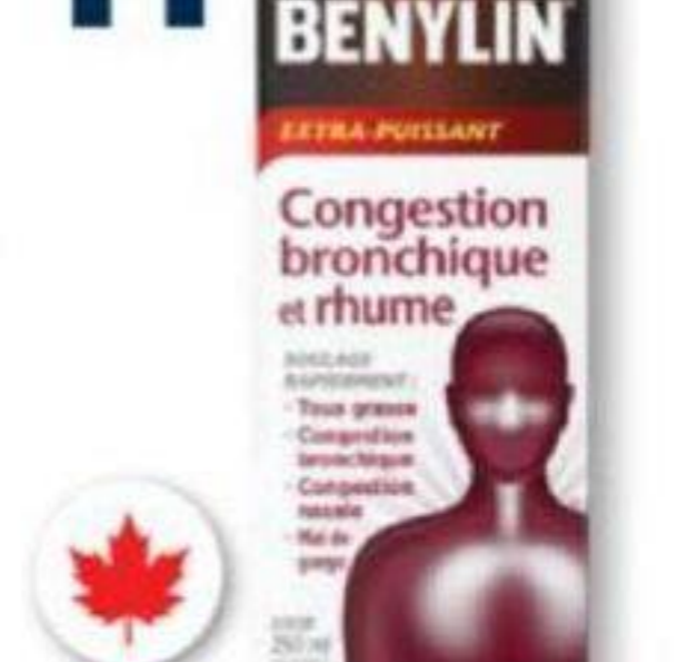
BENYLIN Sirops sélectionnés Selected syrups, 250 ml