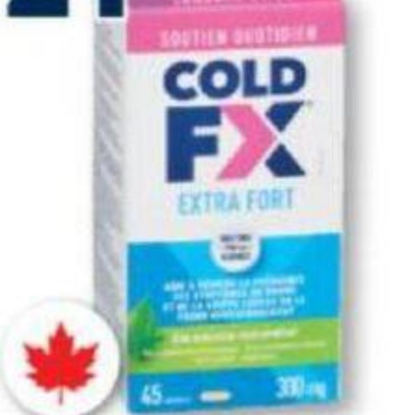
COLD-FX Produits sélectionnés Selected products