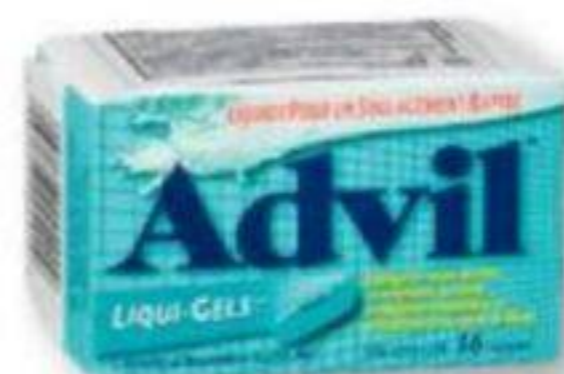
ADVIL Ibuprofène/Ibuprofen, 200 mg, 16 capsules