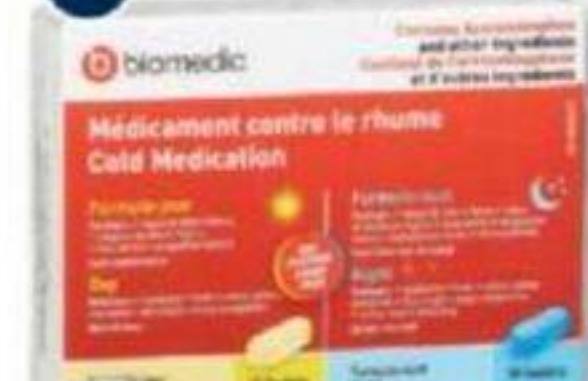
BIOMEDIC Rhume, Grippe, Sinus ou Rhume et sinus Cold, Flu, Sinus or Cold and sinus, 20 unités/units