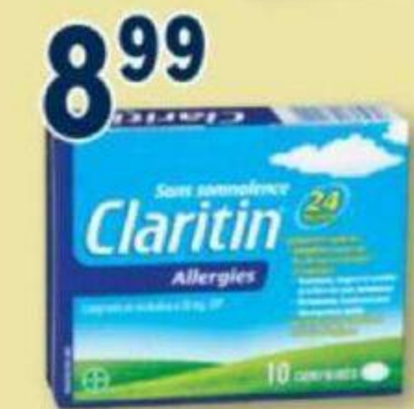
CLARITIN Allergies/Allergy, 10 comprimés/tablets