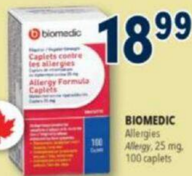
BIOMEDIC Allergies Allergy, 25 mg, 100 caplets