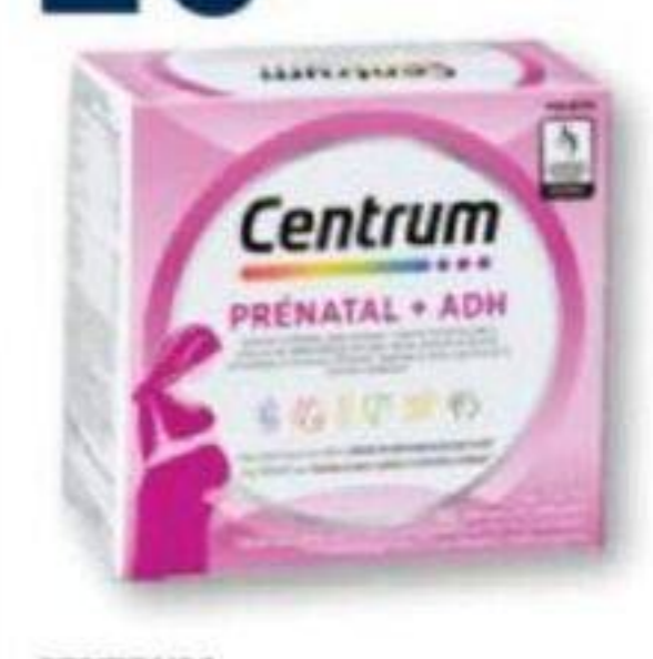
CENTRUM Prenatal + ADH/Prenatal + DHA, Emballage dual/Combo pack, 2 x 60 capsules