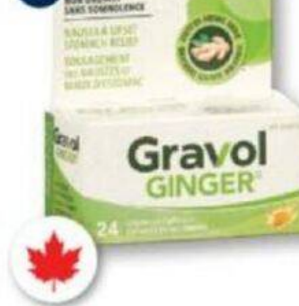
GRAVOL Produits sélectionnés Selected products