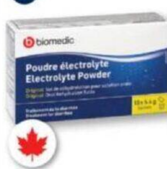
BIOMEDIC Poudre électrolyte/Electrolyte powder, 10 sachets x 5,4 g ou/ou 5,5 g