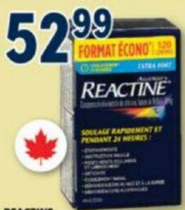
REACTINE Allergies/Allergy, 10 mg, 120 comprimés/tablets