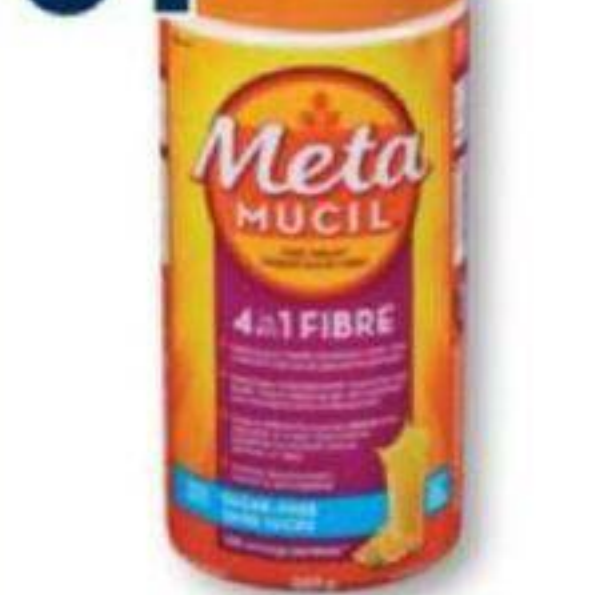
METAMUCIL Thérapie par les fibres/Fiber therapy, produits sélectionnés/selected products