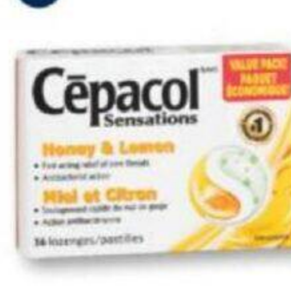
CÉPACOL ou/ou STREPSILS Pastilles/Lozenges, 24 ou/ou 36 unités/units