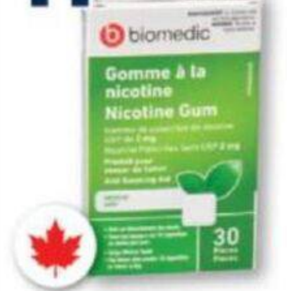
BIOMEDIC Gomme à la nicotine/Nicotine gum, 2 mg ou/ou 4 mg, 30 pièces/pièces