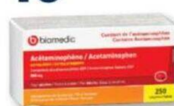
BIOMEDIC Acétaminophène/Acetaminophen, 500 mg, 250 comprimés ou caplets/tablets or caplets ou/ou 120 gélucaps