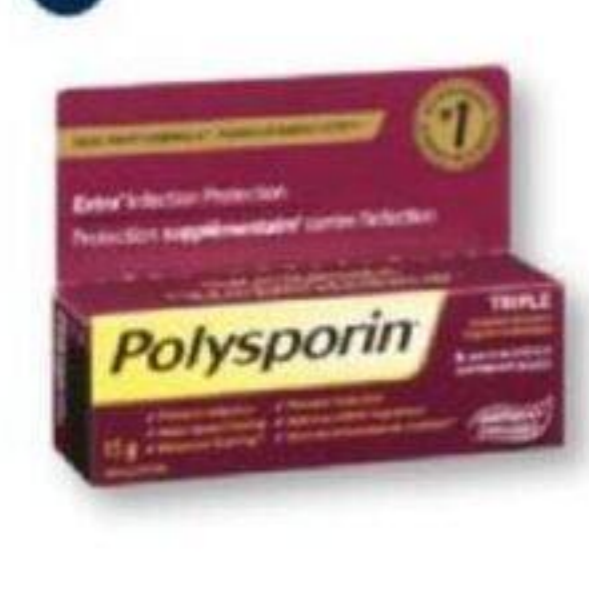
POLYSPORIN Produits sélectionnés Selected products