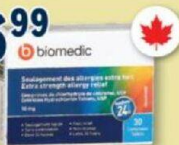
BIOMEDIC Soulagement des allergies extra fort Extra strength allergy relief, 10 mg, 30 comprimés/tablets