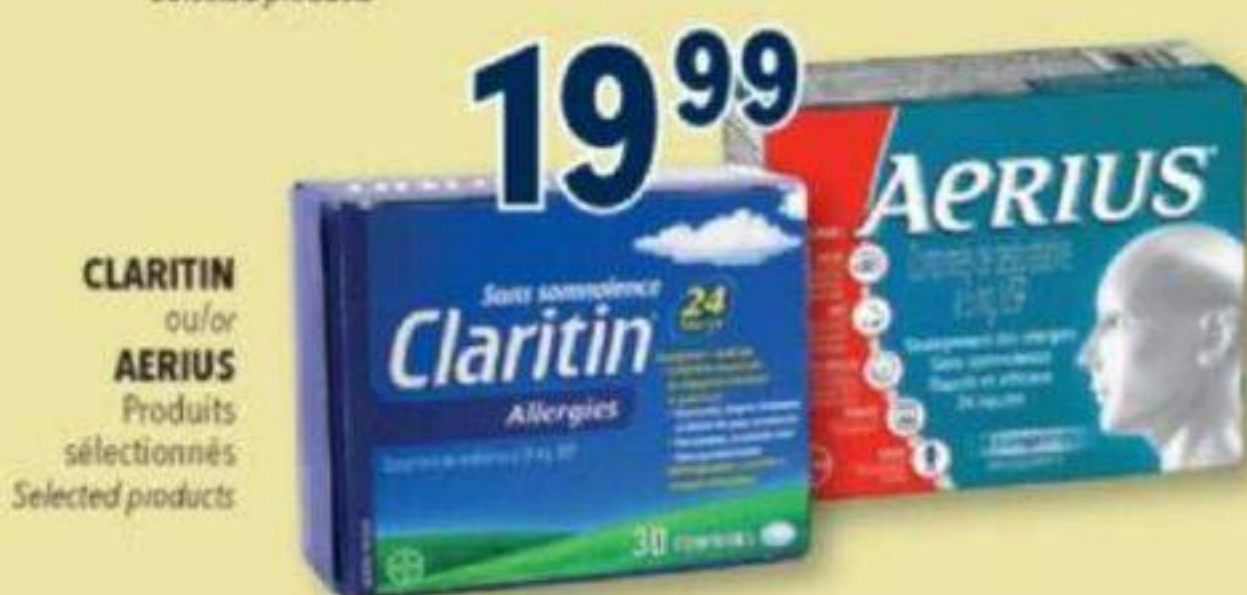
CLARITIN ou/ou AERIUS Produits sélectionnés Selected products