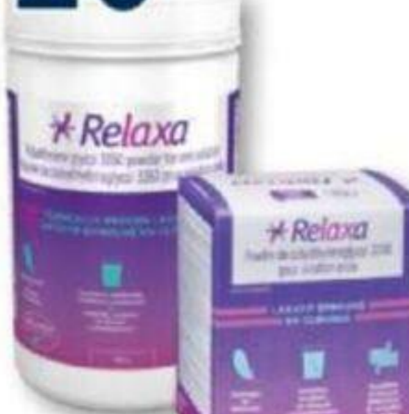
RELAXA Laxatif/Laxative, 510 g ou/ou 30 sachets x 17 g