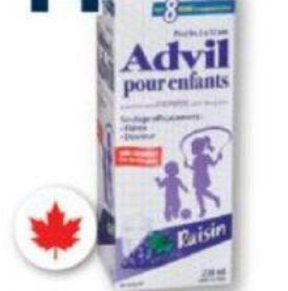
ADVIL Ibuprofène/Ibuprofen, Pour enfants/Children's, 230 ml ou/ou Junior, 40 comprimés/tablets