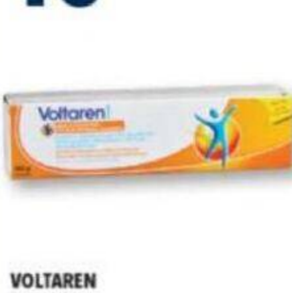
VOLTAREN Emulgel, Douleur dorsale et musculaire Back and muscle pain, 120 g ou/ou 150 g