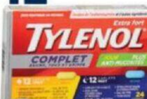
TYLENOL Compleat, Rhume, toux et grippe Complete, cold, cough and flu, formats sélectionnés/selected sizes