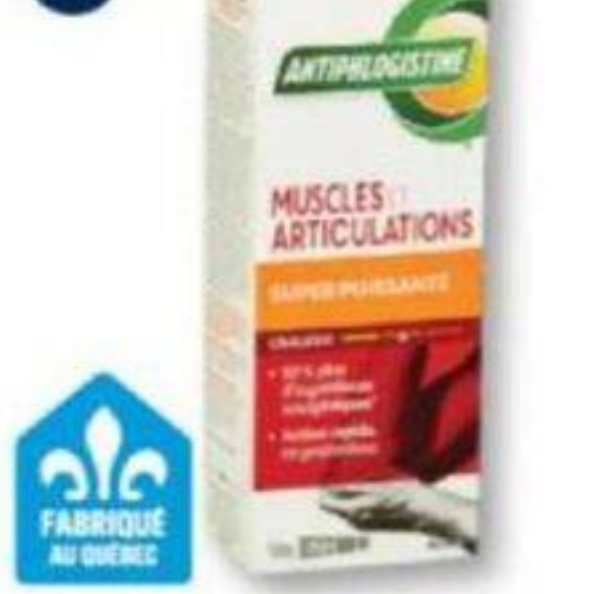
ANTIPHLOGISTINE Produits sélectionnés Selected products