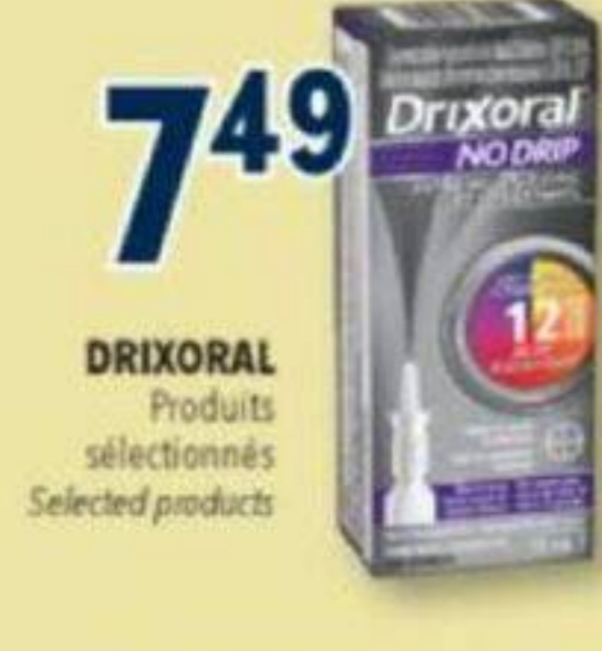
DRIXORAL Produits sélectionnés Selected products