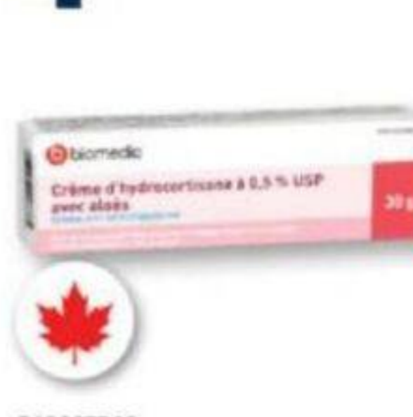
BIOMEDIC Crème d'hydrocortisone à 0,5 % USP avec aloès/Hydrocortisone cream 0.5 USP with aloe, 30 g