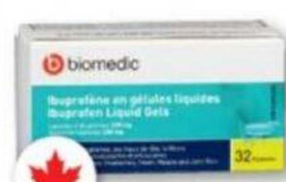
BIOMEDIC Ibuprofène en gélules liquides Ibuprofen liquid gels, 200 mg, 32 capsules