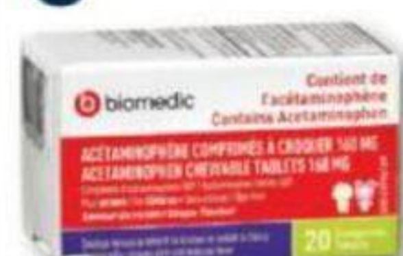
BIOMEDIC Acétaminophène pour enfant Acetaminophen for children, 160 mg, 20 comprimés/tablets