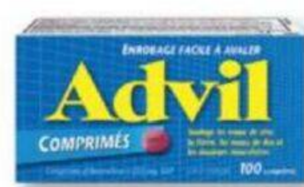
ADVIL Ibuprofène/Ibuprofen, 200 mg, 100 comprimés/tablets ou/ou 100 caplets