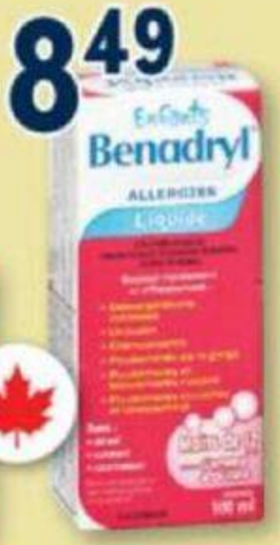
BENADRYL Allergies/Allergy, 100 ml