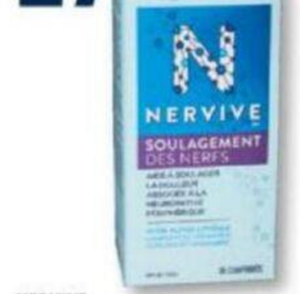
NERVIVE Soulagement des nerfs ou Santé des nerfs Nerve relief or Nerve health, 30 comprimés/tablets