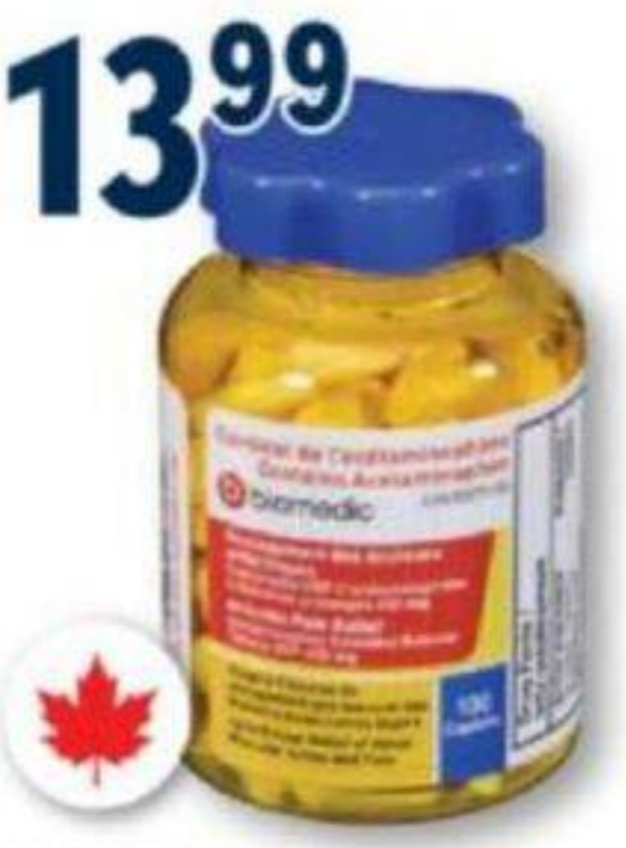
BIOMEDIC Soulagement des douleurs arthritiques Arthritis pain relief, 650 mg, 100 caplets