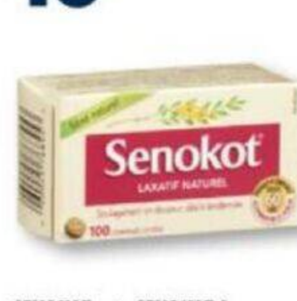
SEKOKOT ou/ou SEKOKOT-S Laxatif/Laxative, formats sélectionnés selected sizes