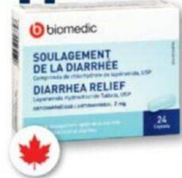
BIOMEDIC Soulagement de la diarrhée Diarrhea relief, 2 mg, 24 caplets