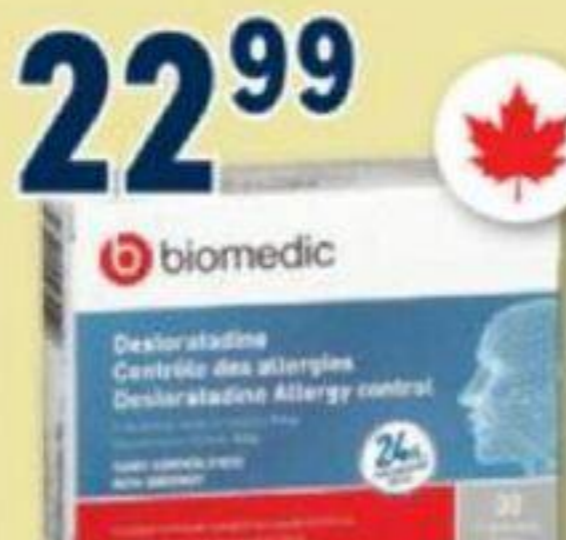
BIOMEDIC Desloratadine, Contrôle des allergies/Allergy control, 5 mg, 30 comprimés/tablets