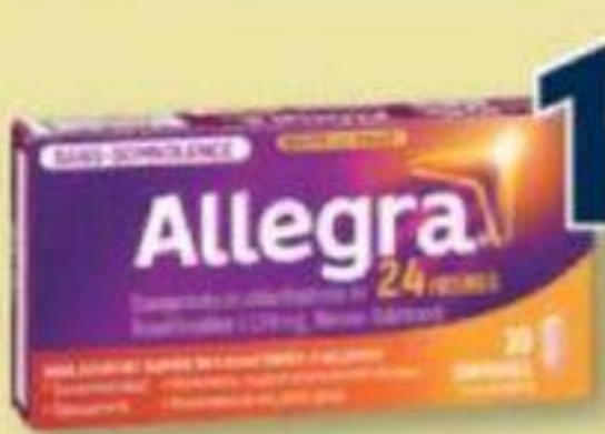
ALLEGRA Allergies/Allergy, 120 mg, 30 comprimés/tablets