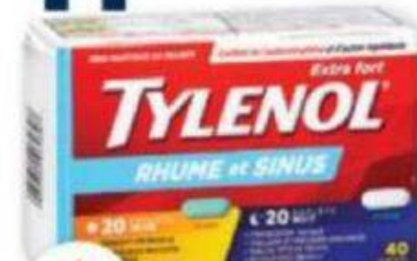
TYLENOL Rhume, Sinus ou Rhume et Sinus Cold, Sinus or Cold and Sinus, produits sélectionnés/selected products, 40 unités/units