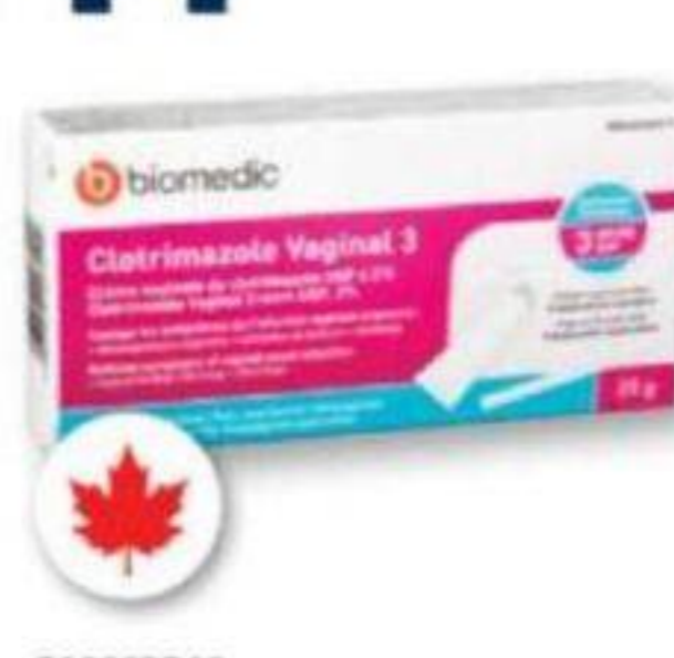
BIOMEDIC Crème vaginale de clotrimazole Clotrimazole vaginal cream, 3 traitements/treatments