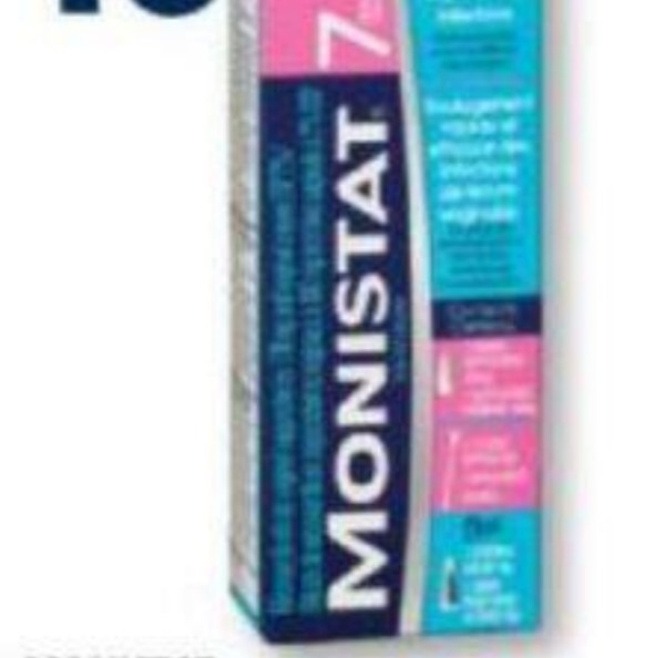
MONISTAT Soulagement des vaginites à levures Relief of vaginal yeast infections, produits sélectionnés/selected products