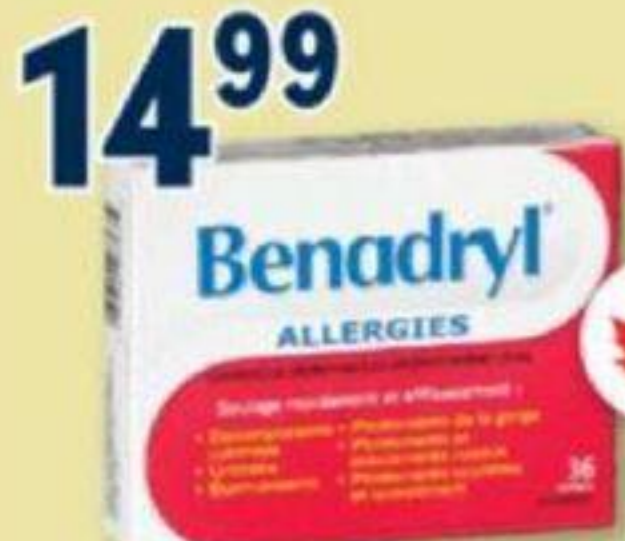
BENADRYL Produits sélectionnés Selected products