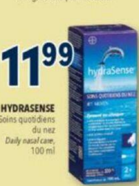
HYDRASENSE Soins quotidiens du nez Daily nasal care, 100 ml