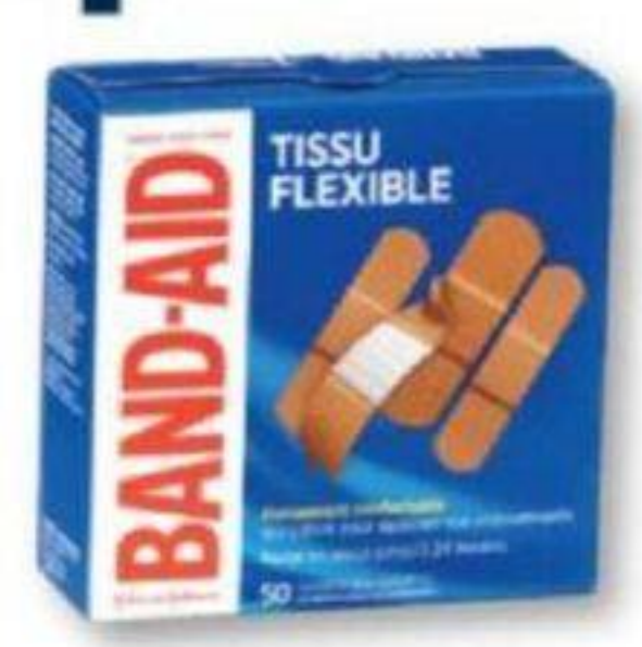
BAND-AID Pansements adhésifs sélectionnés Selected adhesive bandages