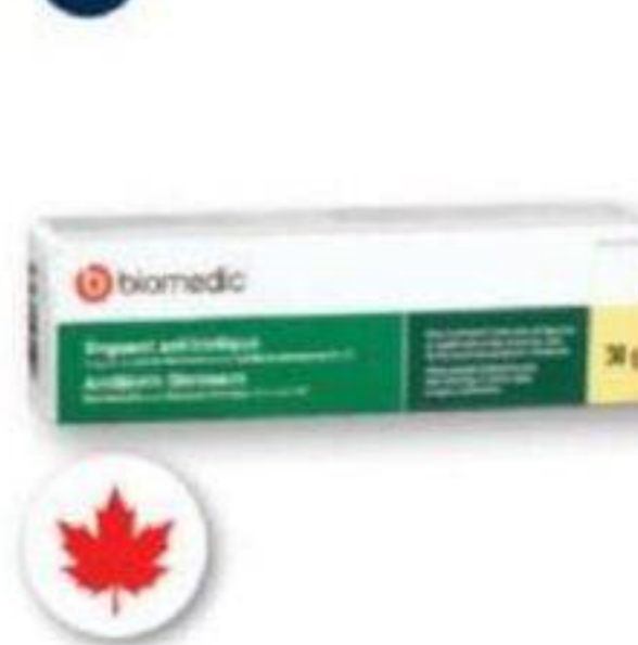
BIOMEDIC Onguent antibiotique Antibiotic ointment, 30 g