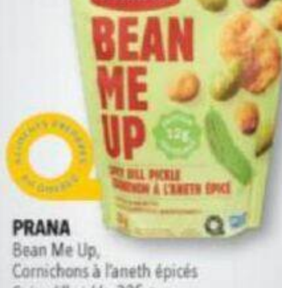
PRANA Bean Me Up, Cornichons à l'aneth épicés Spicy dill pickle, 325 g SUCCURSALES PARTICIPANTES PARTICIPATING STORES