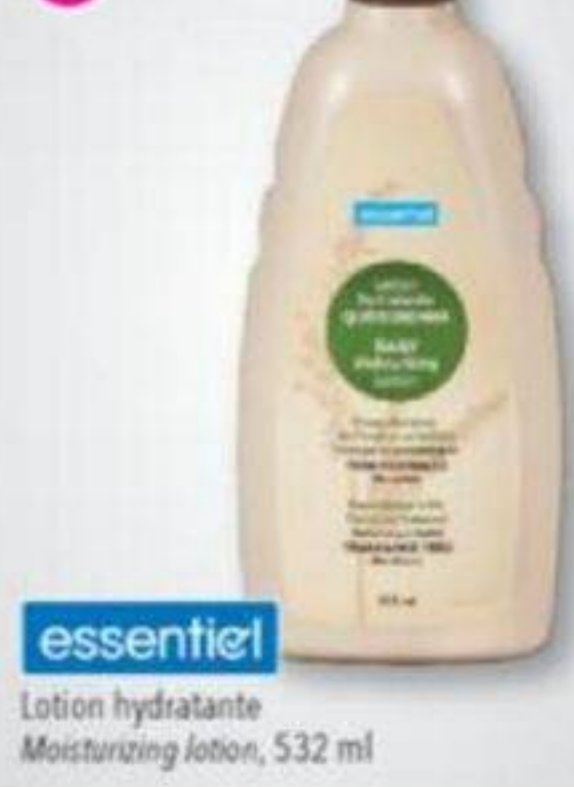
essentiel Lotion hydratante Moisturizing lotion, 532 ml