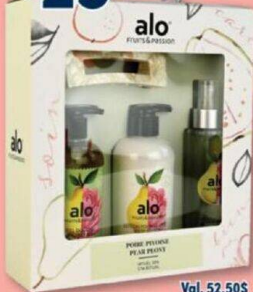
FRUITS & PASSION Alo, Ritual SPA/SPA Ritual, Coffret/Gift set, 4 pièces/pieces