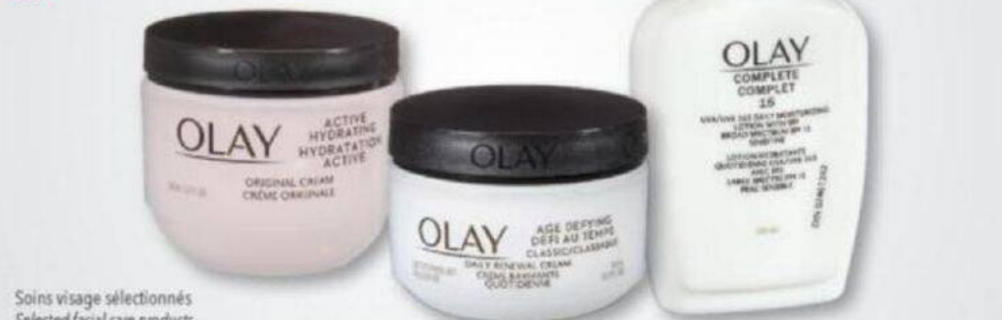
Soins visage sélectionnés Selected facial care products