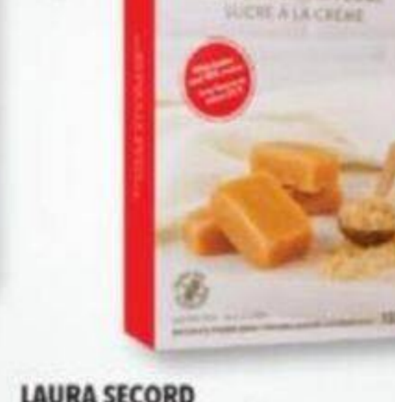
LAURA SECORD Sucre à la crème avec beurre et crème Butter and cream fudge, 180 g