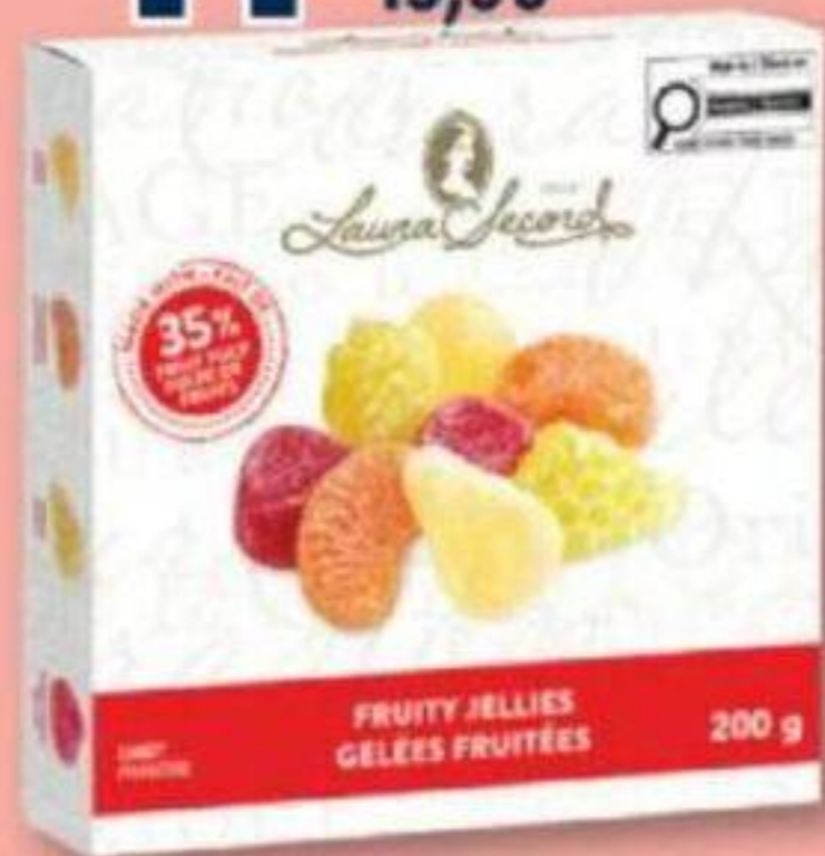
LAURA SECORD Friandises de gélee récolte fruitée Fruity harvest jelly treats, 200 g