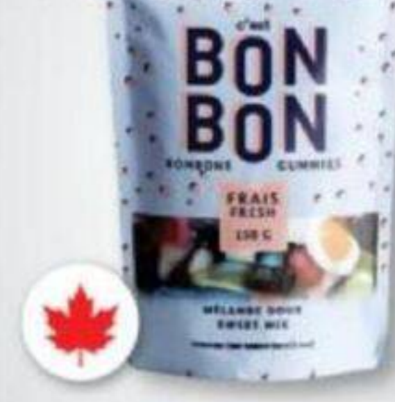
C'EST BONBON Bonbons géliés/Gummies, 150 g