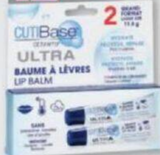
Ceramyd, Ultra baume à lèvres Ultra lip balm, 2 x 11,8 g