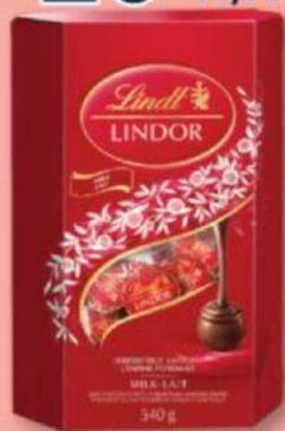
LINDT Lindor, Chocolat au lait Milk chocolate, 540 g