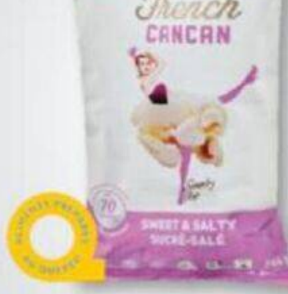
FRENCH CANCAN Maïs soufflé/Popcorn, 156 g ou/ou 256 g