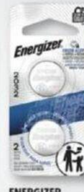
ENERGIZER Piles de montres et spécialités assorties Watch batteries and assorted specialties