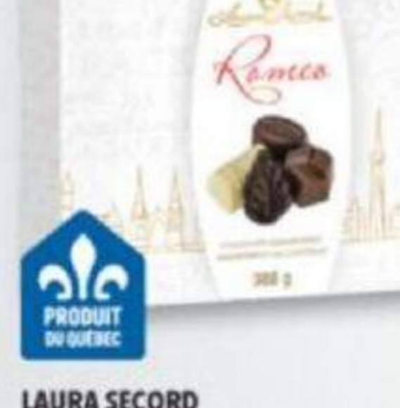
LAURA SECORD Romeo, Assortiment de chocolats Chocolates assortment, 388 g