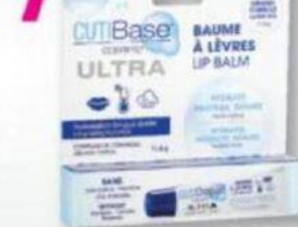
Ceramyd, Ultra baume à lèvres Ultra lip balm, 11,8 g