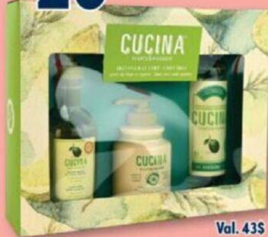
FRUITS & PASSION Cuina, Trio pour le Chef/Chef trio, Coffret/Gift set, 3 pièces/pieces