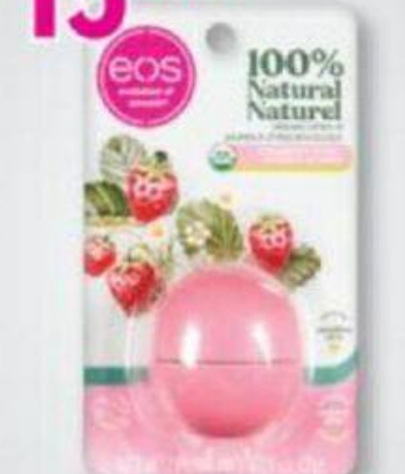
EOS Baume à lèvres/Lip balm, 4 g ou/ou 7 g