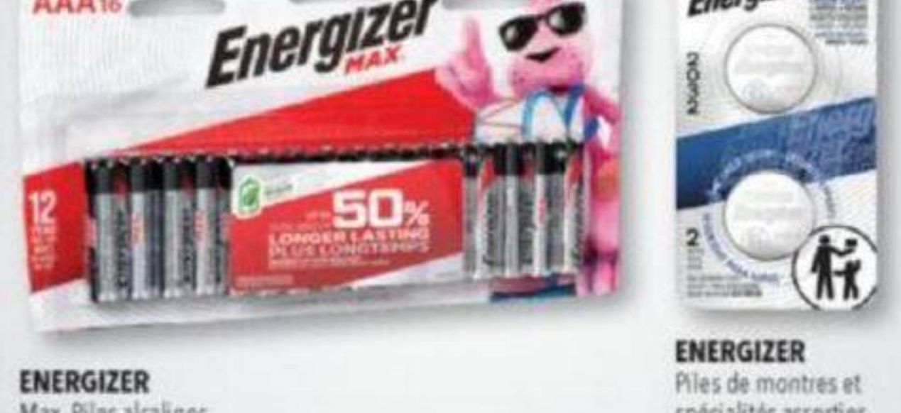
ENERGIZER Max, Piles alcalines sélectionnées Selected alkaline batteries