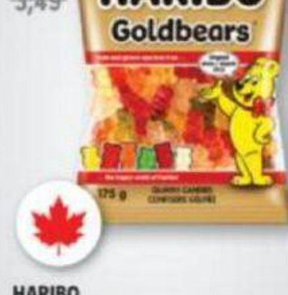
HARIBO Bonbons géliés Gummy candies, 175 g