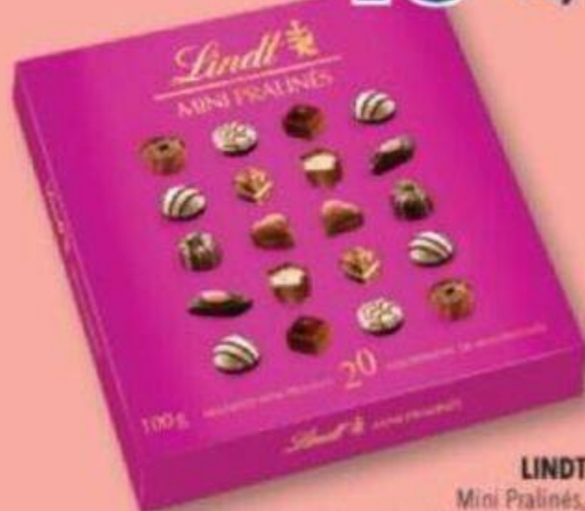
LINDT Mini Pralinés, Assortiment de mini pralinés, Assorted mini pralinés, 100 g