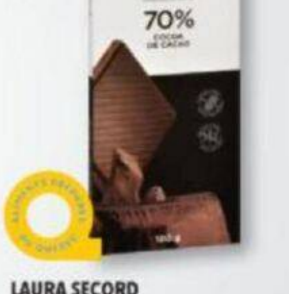
LAURA SECORD Barre de chocolat Chocolate bar, 100 g