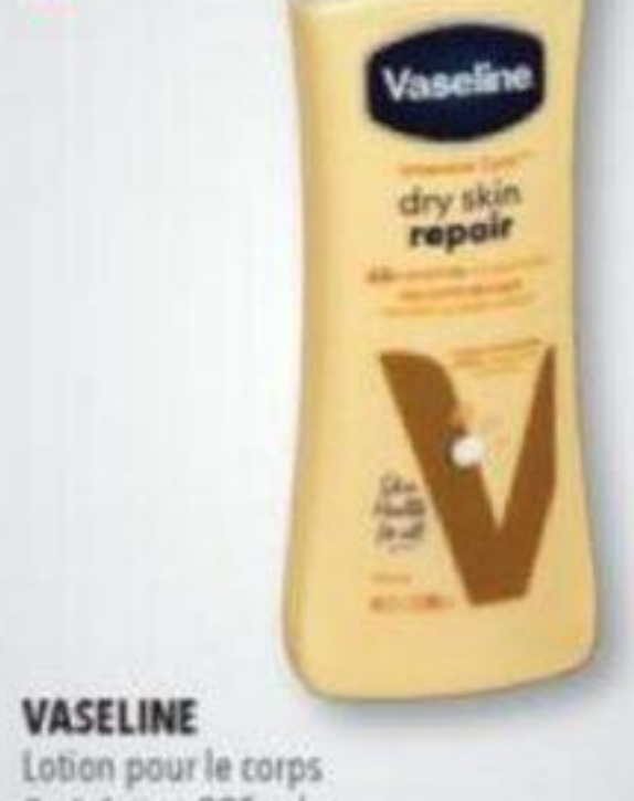
VASELINE Lotion pour le corps Body lotion, 295 ml