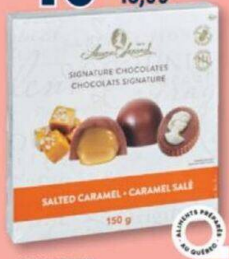
LAURA SECORD Chocolats signature Signature chocolates, 150 g