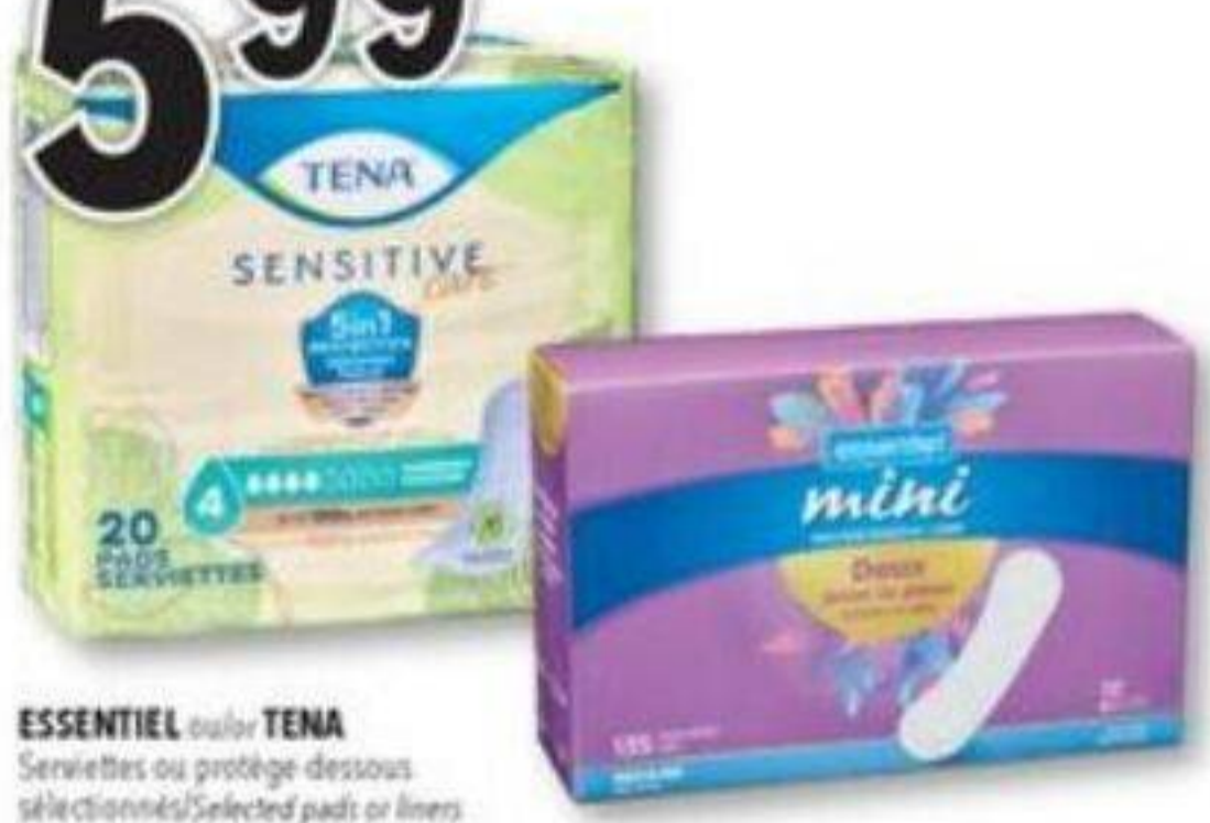
ESSENTIEL ou/ou TENA Serviettes ou protège-dessous sélectionnés/Selected pads or liners