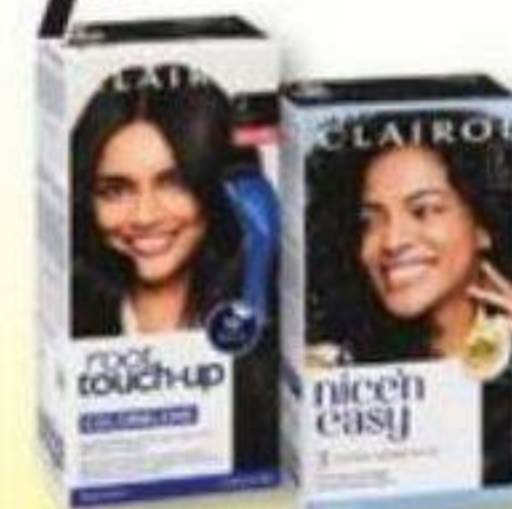
CLAIROL Colorations sélectionnées Selected colors