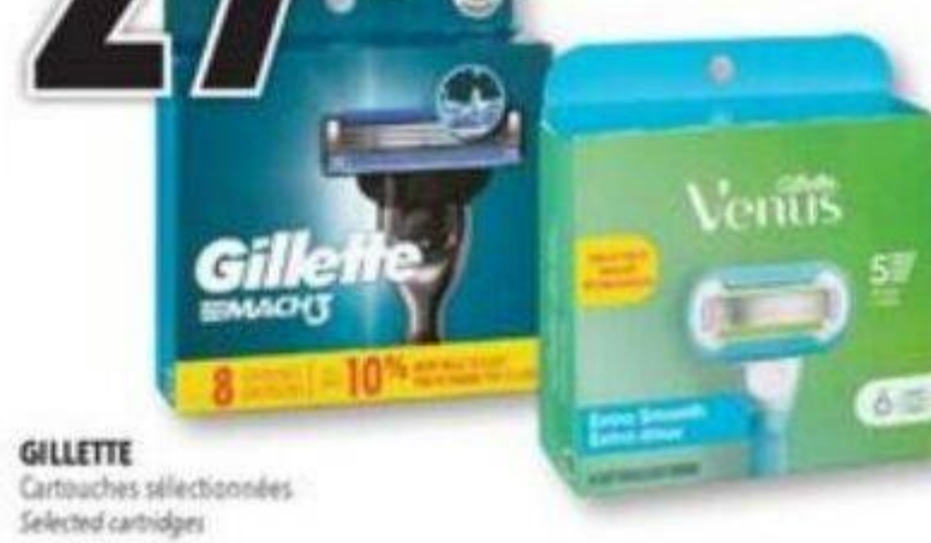
GILLETTE Cartouches sélectionnées Selected cartridges