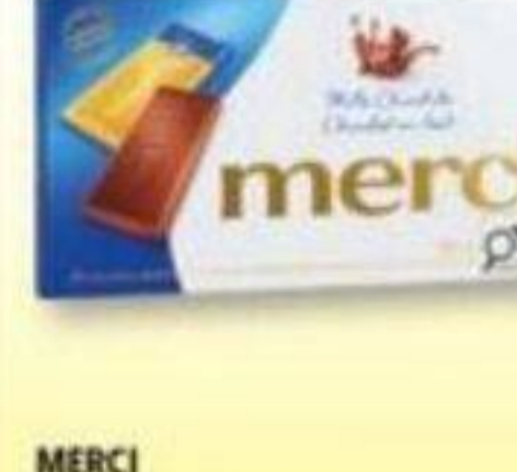
MERCI Bâtes de chocolat Chocolate bars, 4 x 25 g

Un duo irrésistible pour la fête des Mères