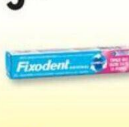
FIXODENT Produits buccaux sélectionnés Selected buccal products