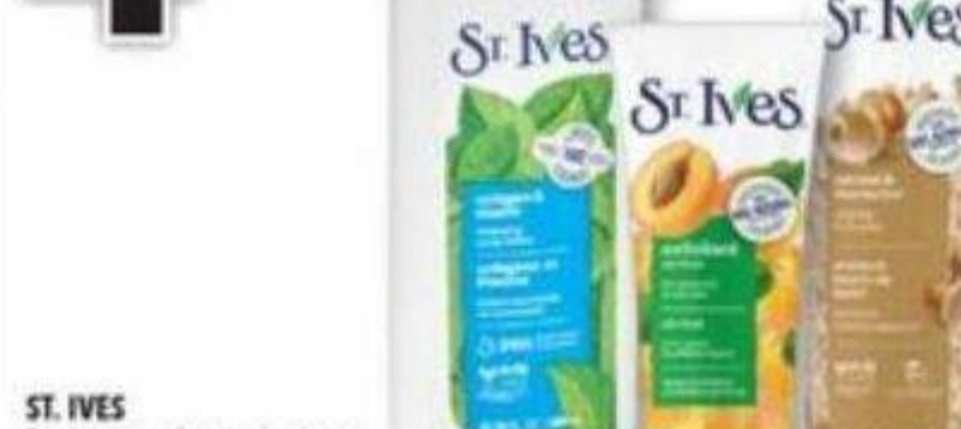
ST. IVES Produits pour le soin du visage ou du corps sélectionnés Selected skin or body care products