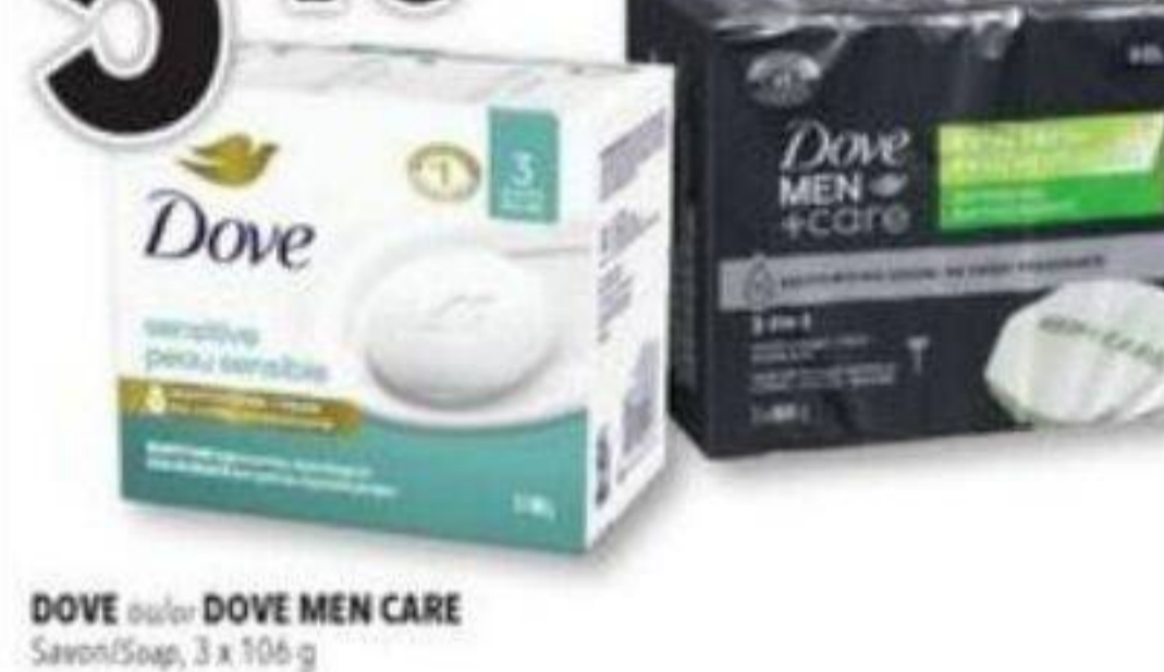
DOVE ou/ou DOVE MEN CARE Savon/Soap, 3 x 106 g