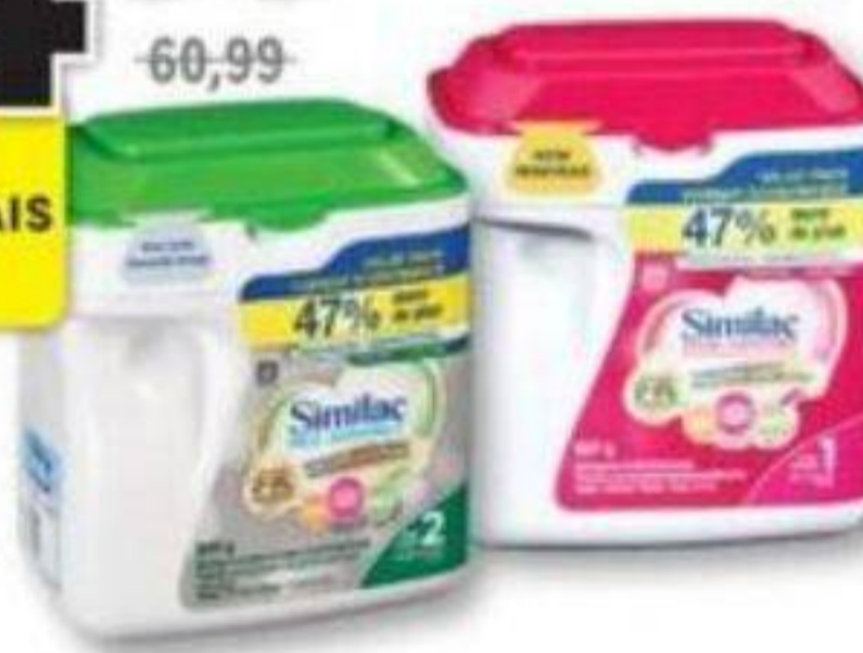
SIMILAC Total Comfort, Préparation en poudre pour nourrisson Powdered infant formula, 837 g ou/ou Pro-Advance, 859 g