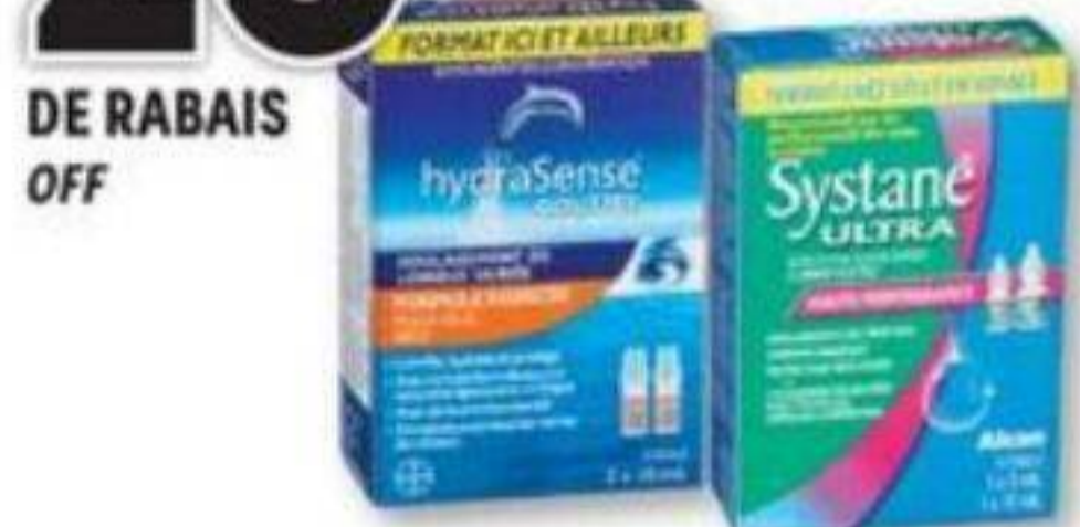
HYDRASENSE ou/ou SYSTANE Produits sélectionnés/Selected products