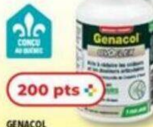
GENACOL Produits sélectionnés Selected products