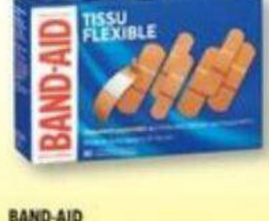
BAND-AID Pansements adhésifs sélectionnés Selected adhesive bandages