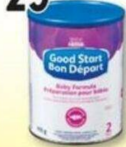
BON DÉPART/GOOD START Préparation en poudre pour bébé Powdered baby formula, 900 g