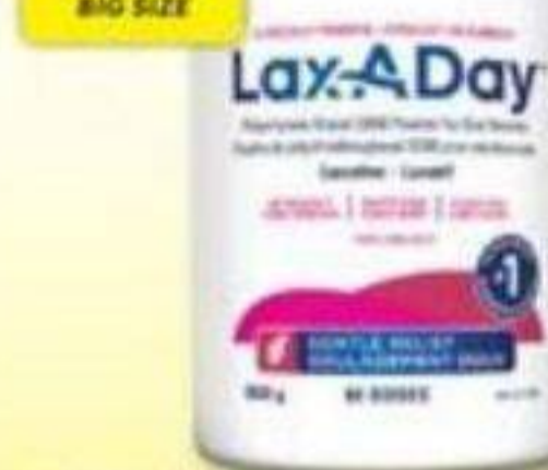
LAX-A-DAY Laxatif/Laxative, 1020 g