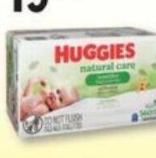
HUGGIES Lingettes pour bébé/Baby wipes, recharges sélectionnées/selected refills