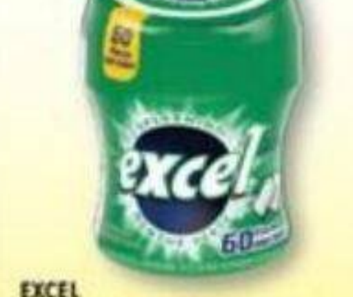
EXCEL Gomme sans sucre/Sugar-free gum, 60 morceaux/pièces