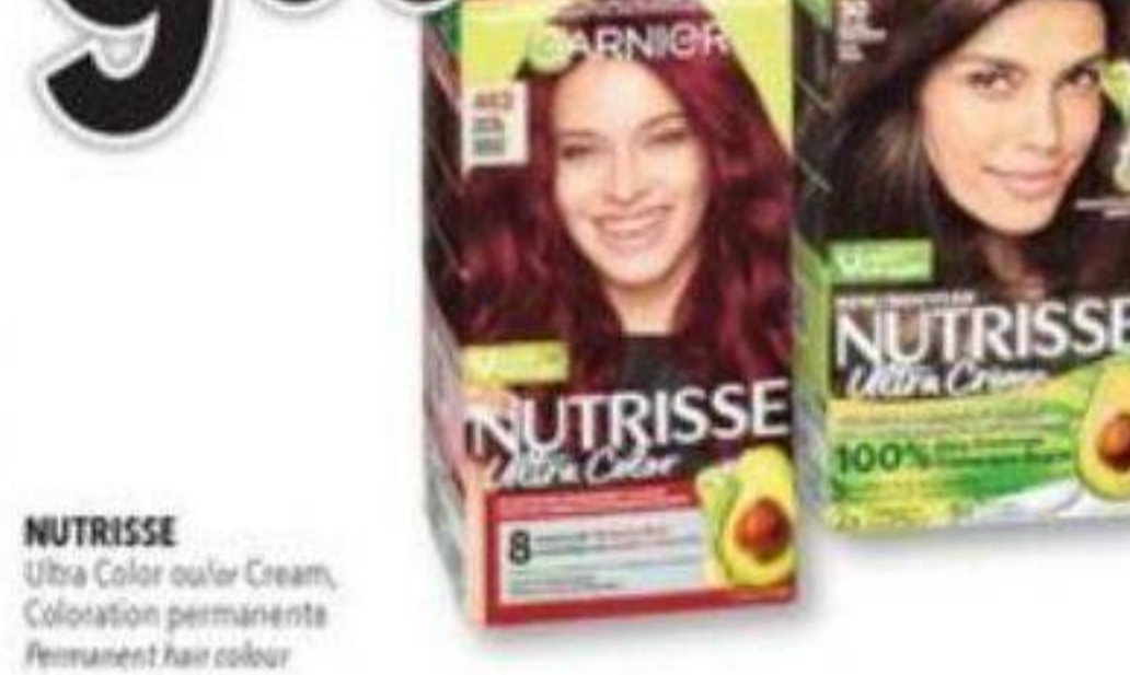
NUTRISSE Ultra Color ou/ou Cream, Coloration permanents Permanent hair colour