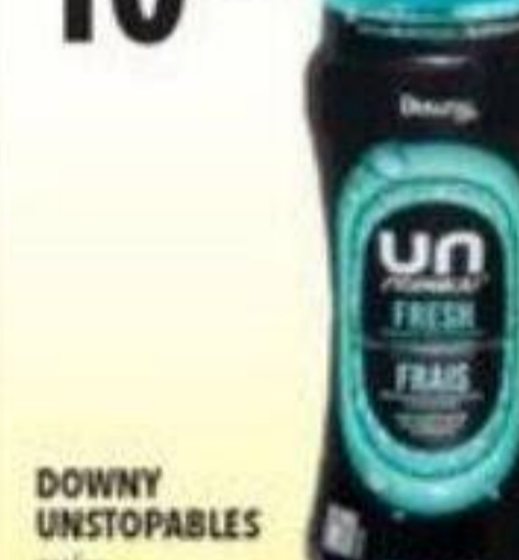
DOWNY UNSTOPABLES ou/ou GAIN FIREWORKS Rehausseur de parfum pour lessive In-wash scent booster, 379 g