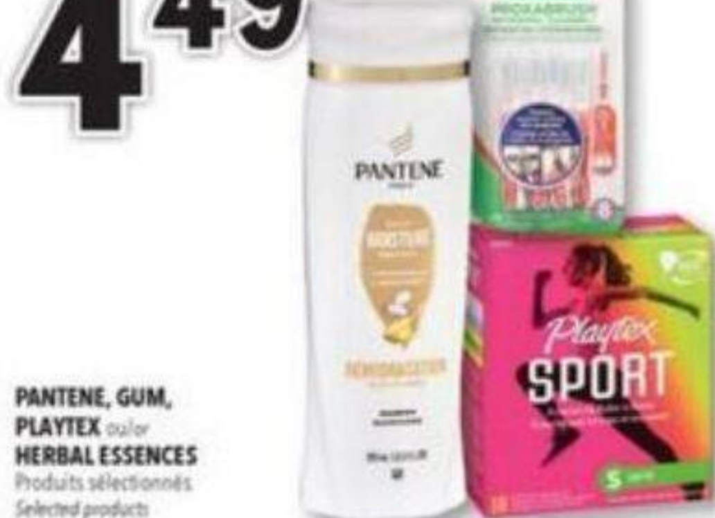
PANTENE, GUM, PLAYTEX ou/ou HERBAL ESSENCES Produits sélectionnés Selected products