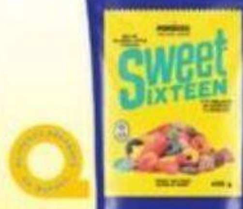
MONDOUX Sweet Sixteen, Bonbons/Candies, 400 g