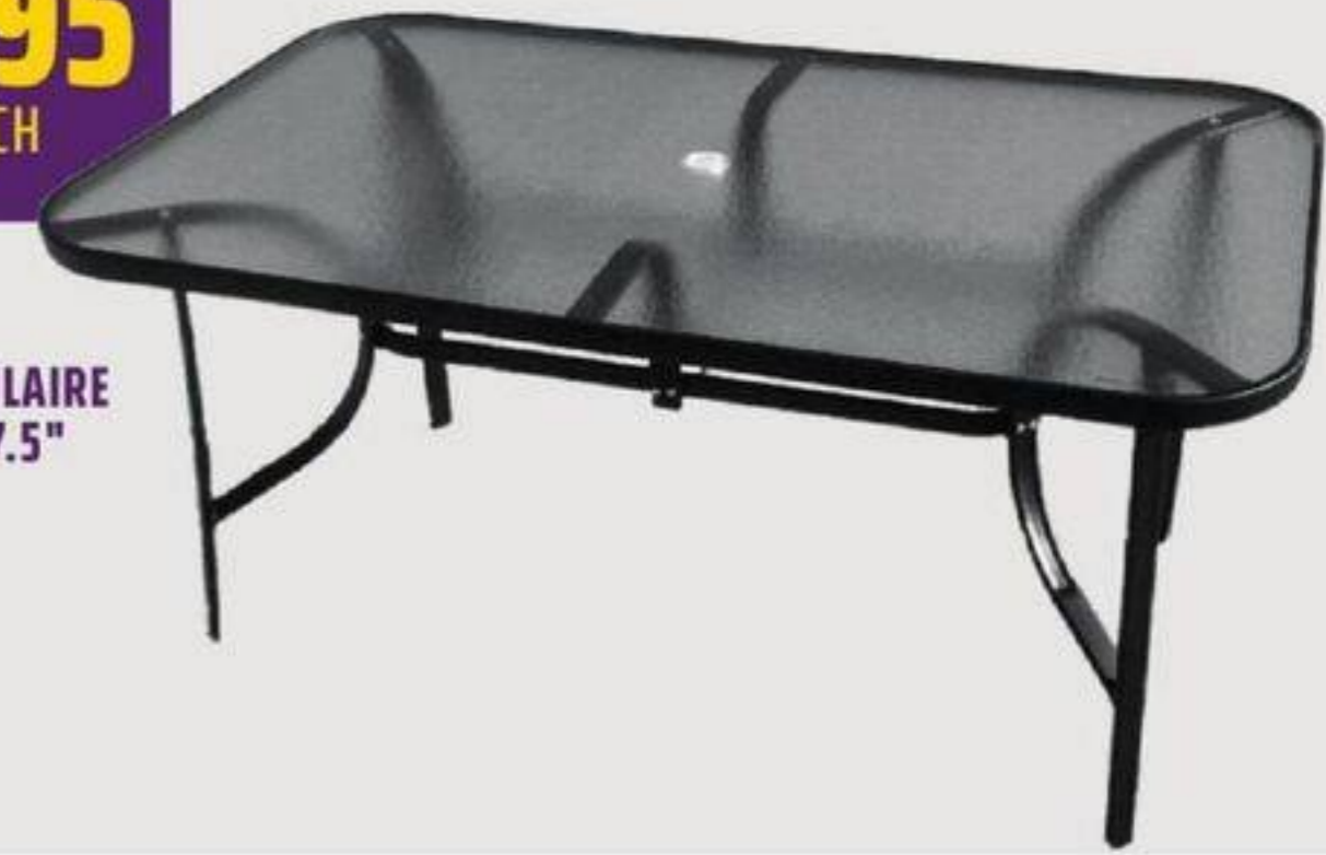
TABLE RECTANGULAIRE 59" X 35.4" X 27.5"