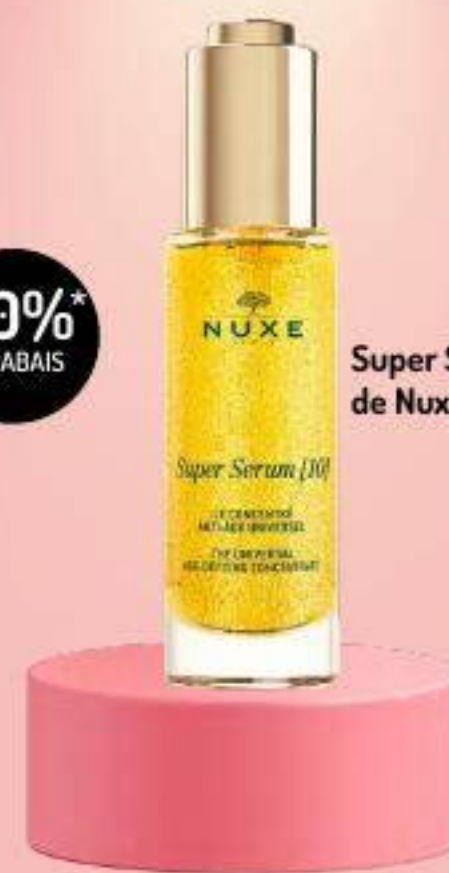
Super Serum 10 de Nuxe

Coup de coeur de Ludwine Cosméticienne à St-David