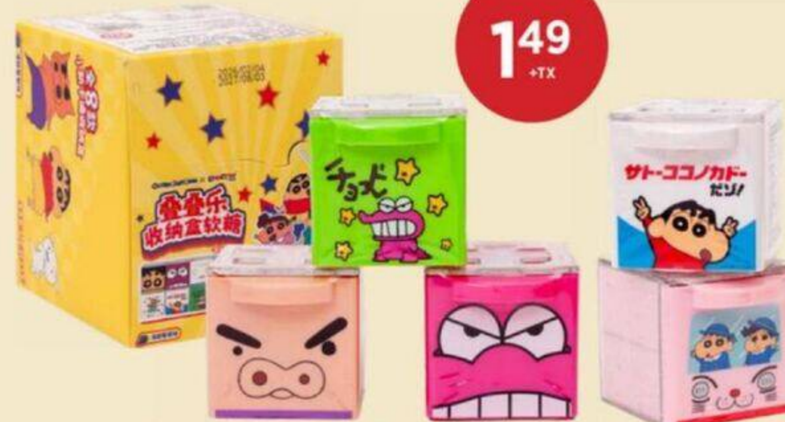
BONBONS GÉLIFIÉS CTM 8 G GRAPE GUMMY CANDIES 蠶筆小新疊疊樂收納盒軟糖 REG. 2,29 +TX