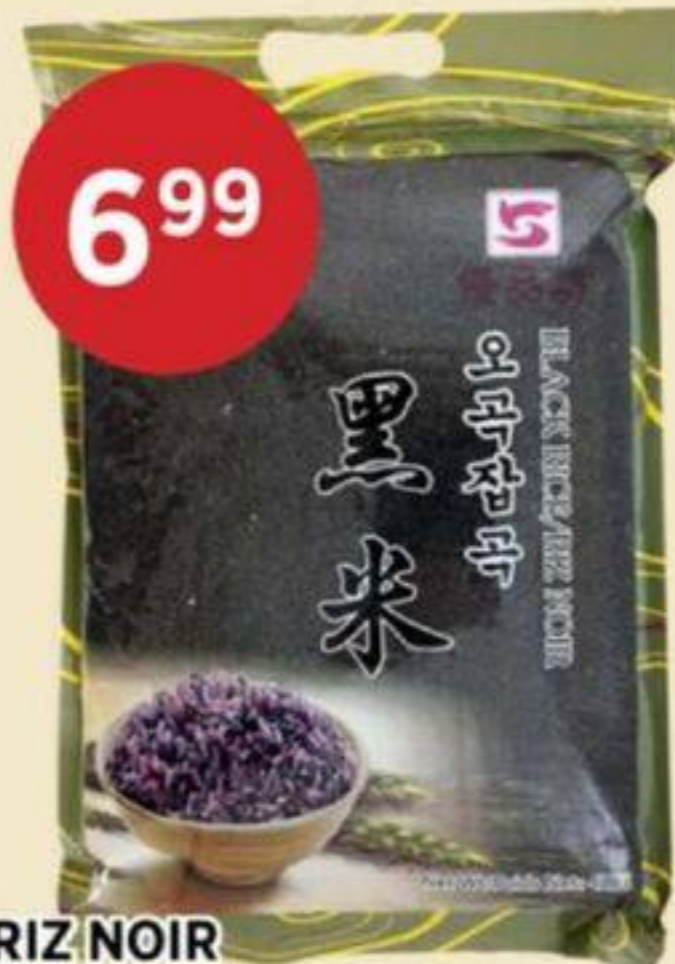
RIZ NOIR AJ 4 LB BLACK RICE 黑米 REG. 8,99