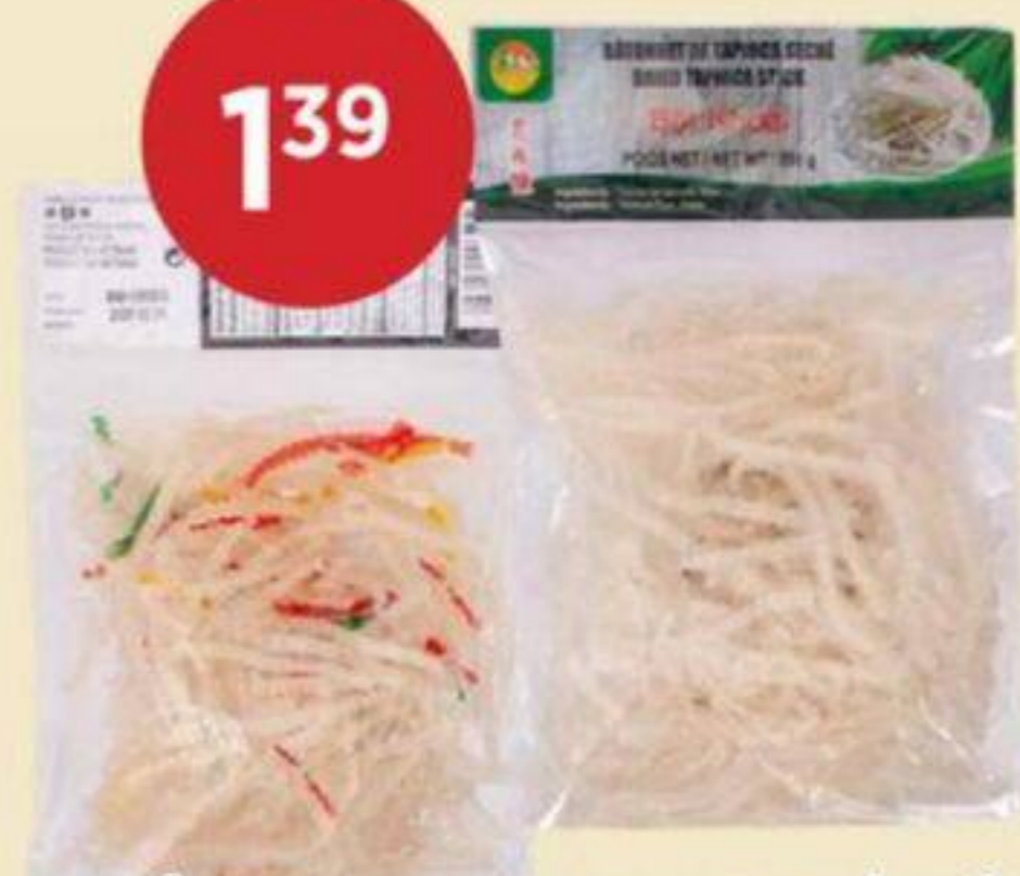
BÂTONNETS DE TAPIOCA SÉCHÉS (COLORÉS/BLANCS) MR 200 G COLORED DRIED TAPIOCA STICKS (COLORED/WHITE) 薯粉條(彩色/白色) REG. 1,99

Du Jeudi 16 avril au Mercredi 22 avril 2026 From Thursday April 16 to Wednesday April 22 2026 從2026年4月16號週四到4月22號週三結束