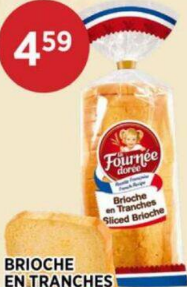
BRIOCHE EN TRANCHES LA FOURNÉE DORÉE 500 G SLICED BRIOCHE 切片麵包 REG. 5,69