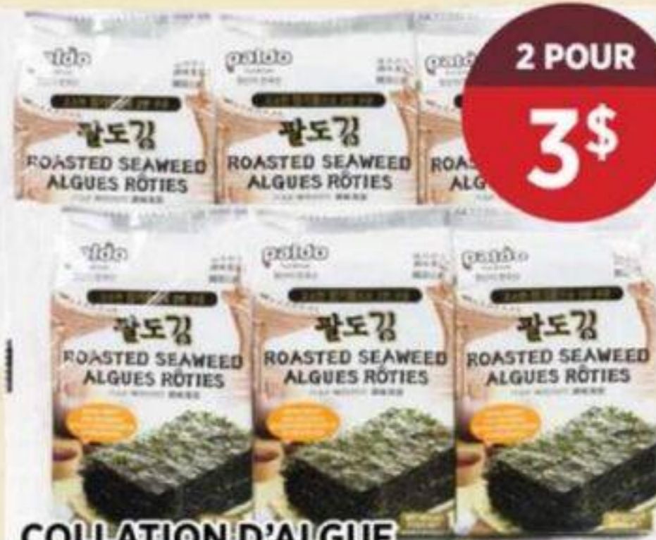
COLLATION D'ALGUE SÉCHÉE ORIGINALE PALDO 3 X 5 G 1,69/CH ORIGINAL ROASTED SEAWEED SNACK 原味即食海苔 REG. 2,09/CH