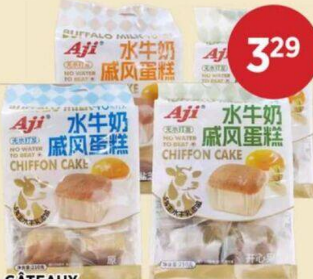
GÂTEAUX (VARIÉTÉS MULTIPLES) AJI 210 G CAKES (MULTIPLE VARIETIES) 水牛奶戚風蛋糕 (多種口味) REG. 3,99