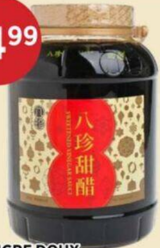
VINAIGRE DOUX PAT CHUN 2,4 L SWEET VINEGAR 八珍甜醋 REG. 44,99