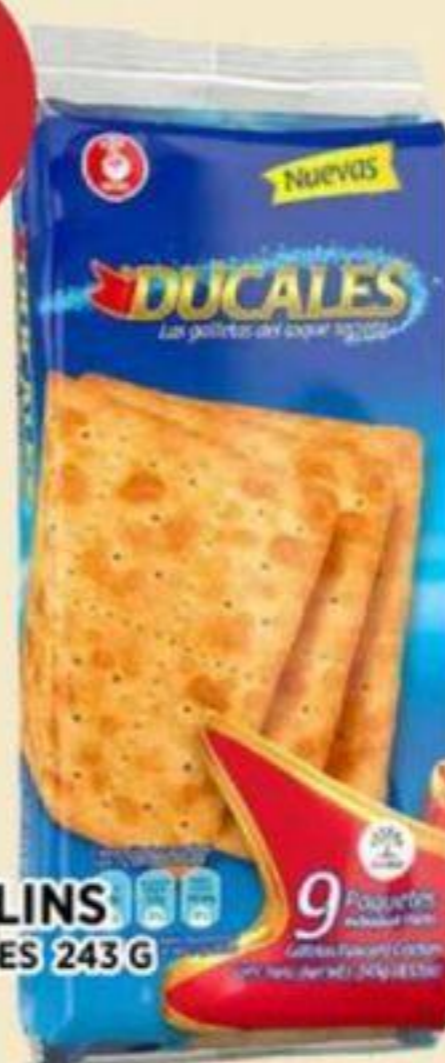
CRAQUELINS NOEL DUCALES 243 G CRACKERS 餅乾 REG. 2,49