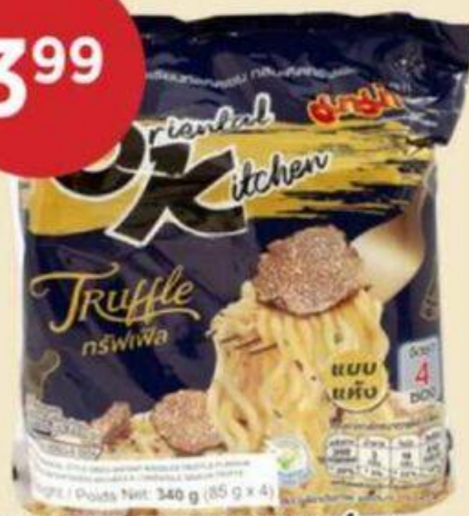
NOUILLES INSTANTANÉES SAVEUR DE TRUFFE MAMA 340 G INSTANT NOODLES WITH TRUFFLE FLAVOR 即食麵 (黑松露口味) REG. 4,99