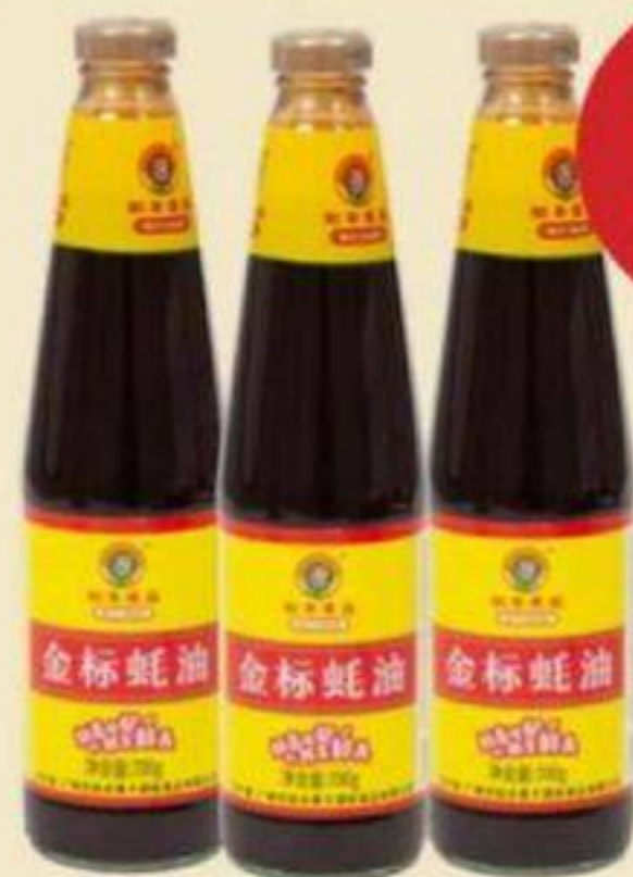
SAUCE AUX HÛÎTRES RUFENG 700 G OYSTER SAUCE 金標蠔油 REG. 2,99