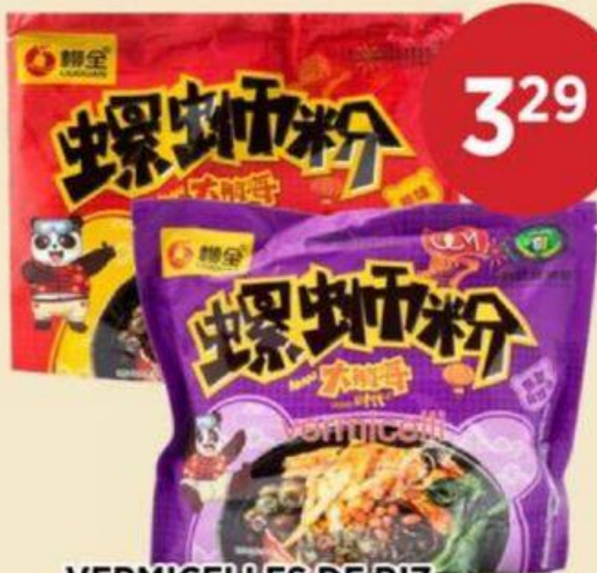
VERMICELLES DE RIZ (VARIÉTÉS MULTIPLES) LIUQUAN 315 G - 335 G RICE VERMICELLI (MULTIPLE VARIETIES) 螺獅粉 (多種口味) REG. 4,29