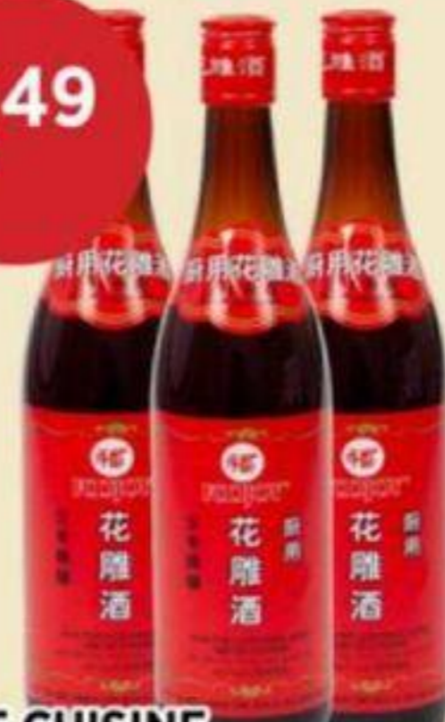
VIN DE CUISINE SHAOXING (VIEILLI 3 ANS) FOOJOY 640 ML SHAOXING COOKING WINE (3-YEAR AGED) 紹興三年陳釀花雕酒 REG. 3,79