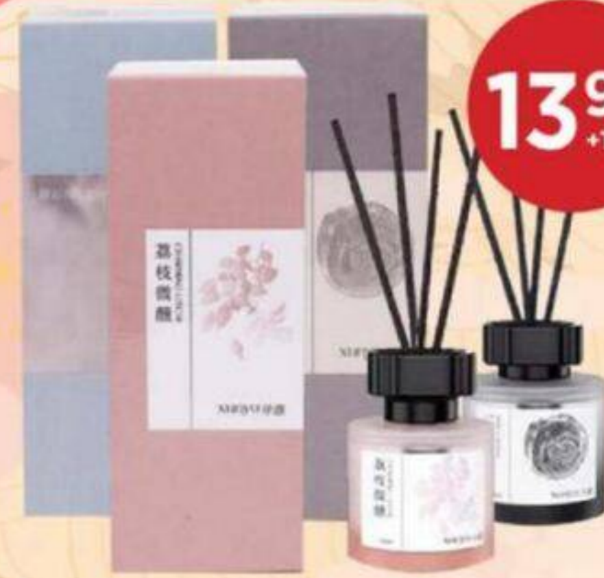
DIFFUSEUR DE PARFUM (SÉLECTIONS MULTIPLES) XUNYU UN - 100 ML FRAGRANCE DIFFUSER (MULTIPLE SELECTIONS) 香薰 (多種選擇) REG. 19,99/CH +TX