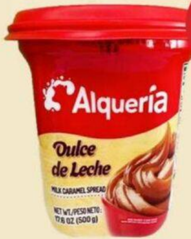
TARTINADE AU CAMEL ALQUERIA 500 G CARAMEL SPREAD 焦糖抹醬 REG. 7,49