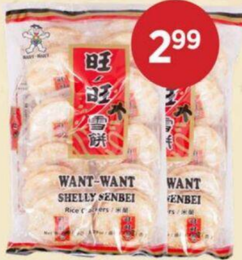
CRAQUELINS AU RIZ HOT KID 150 G RICE CRACKERS 旺旺雪餅 REG. 3,99