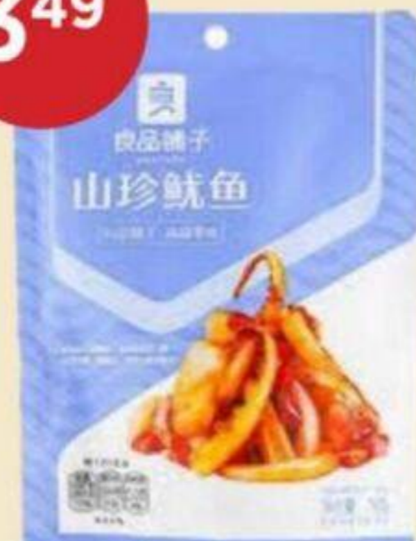
CALMAR SÉCHÉ LPPZ 70 G DRIED SQUID 山珍魷魚 REG. 4,29