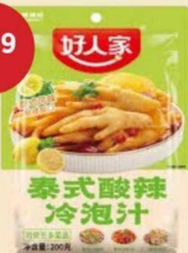
CONDIMENT POUR SOUPE THAÏE AIGRE ET ÉPICÉE HAO REN JIA 200 G THAI HOT AND SOUR SOUP SEASONING 泰式酸辣冷泡汁 REG. 3,49