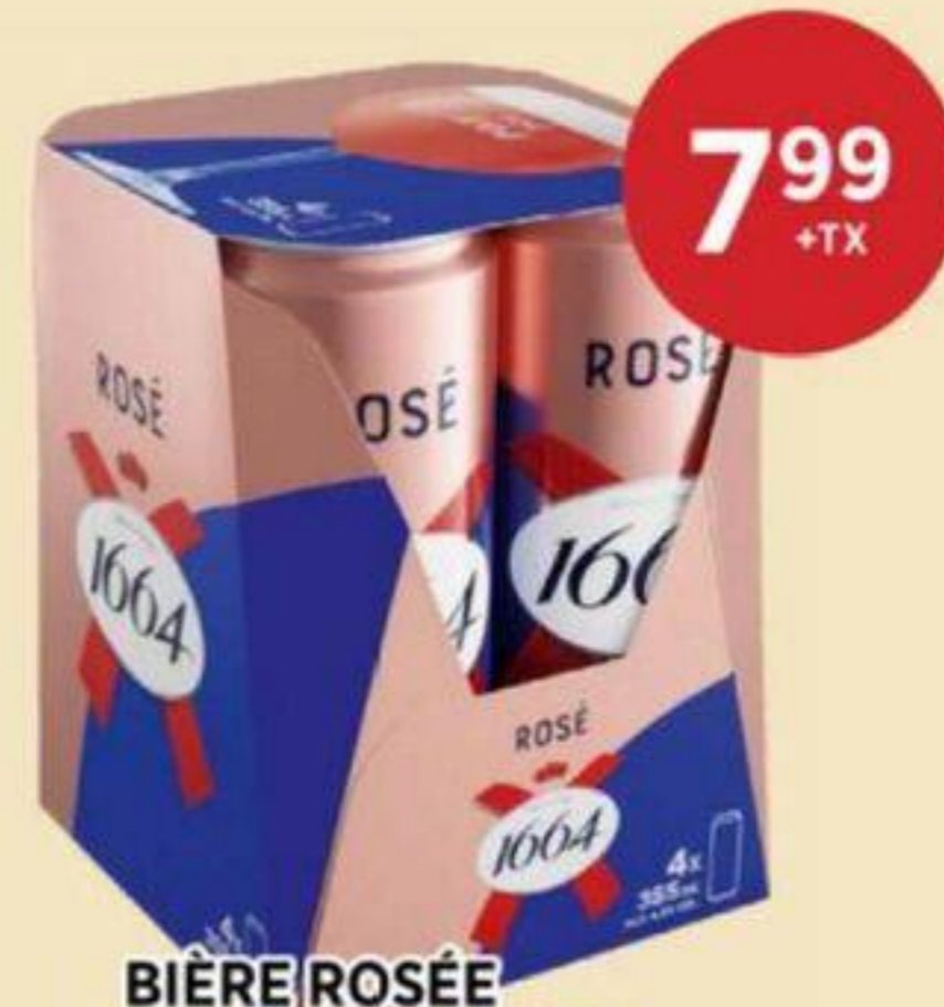
BIÈRE ROSÉE KRONENBOURG 4 X 355 ML ROSÉ BEER 玫瑰啤酒 REG. 10.99 + TX