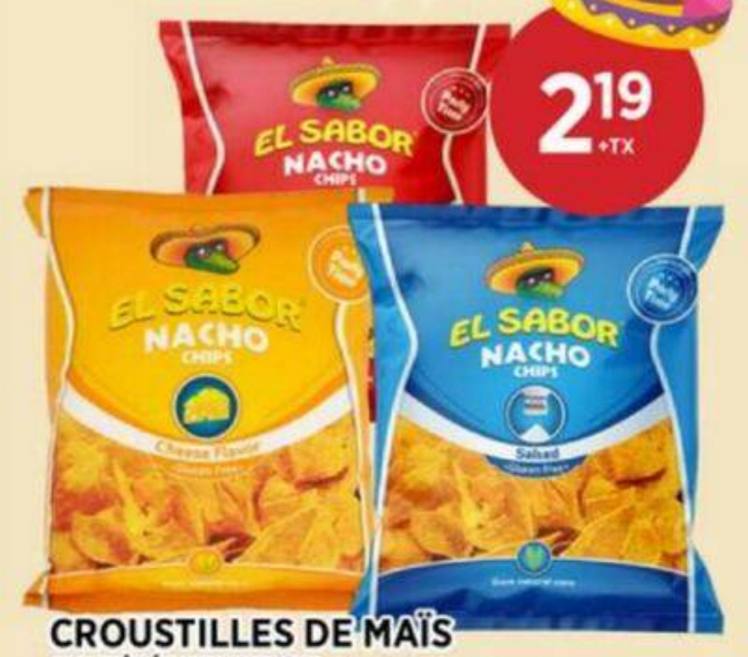
CROUSTILLES DE MAÏS (VARIÉTÉS MULTIPLES) EL SABOR 225 G CORN CHIPS (MULTIPLE VARIETIES) 玉米脆片 (多種口味) REG. 2.99 + TX