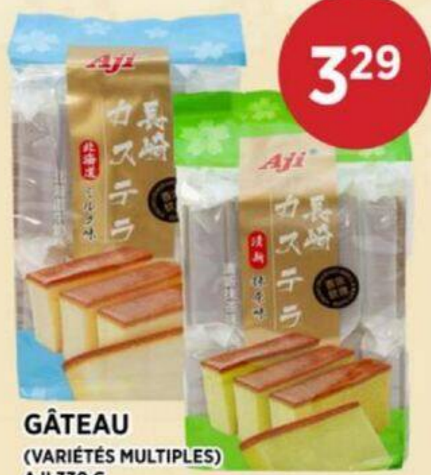
GÂTEAU (VARIÉTÉS MULTIPLES) AJI 330 G CAKE (MULTIPLE VARIETIES) 蛋糕 (多種口味) REG. 3.99