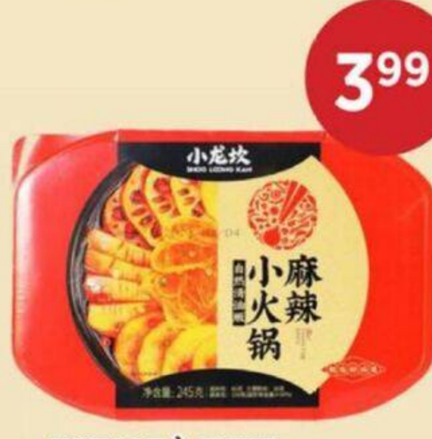
HOT POT À CUIRE SOI-MÊME ÉPICÉ XLK 245 G SELF-COOKED SPICY HOT POT 小龍坎麻辣小火鍋 REG. 4.99