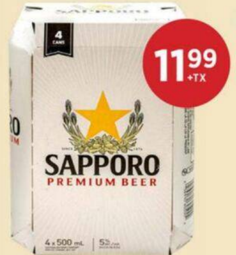
BIÈRE JAPONAISE PREMIUM SAPPORO 4 X 500 ML JAPANESE PREMIUM BEER 日本精釀啤酒 REG. 15.99 + TX

Du Jeudi 23 avril au Mercredi 29 avril 2026 From Thursday April 23 to Wednesday April 29 2026 從2026年4月23號週四到4月29號週三結束