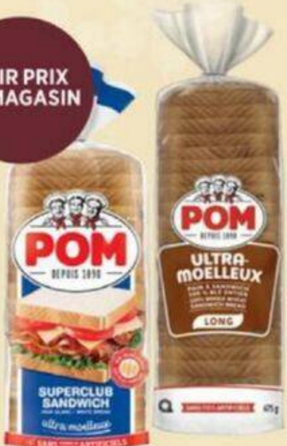
PAIN TRANCHÉ (BLANC/BLÉ ENTIER) SLICED BREAD (WHITE/WHOLE WHEAT) 切片麵包 (白麵包/全麥麵包)