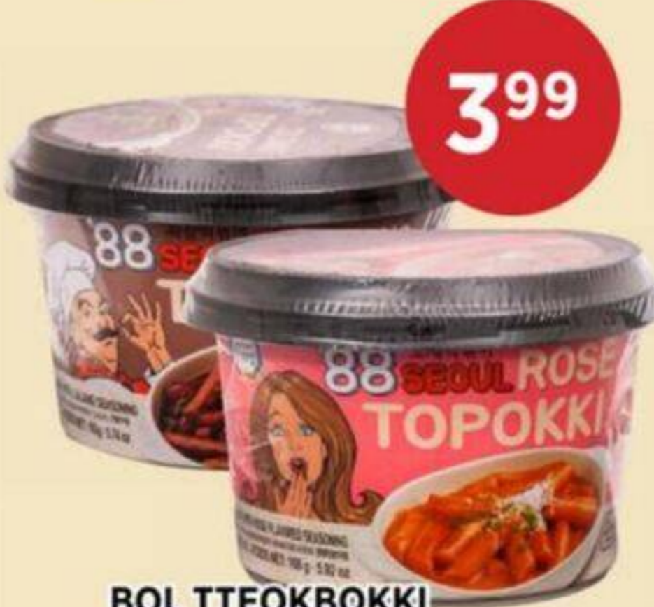
BOL TTEOKBOKKI (VARIÉTÉS MULTIPLES) SURASANG 163 G - 170 G TTEOKBOKKI BOWL (MULTIPLE VARIETIES) 韓式即食年糕碗 REG. 4.99