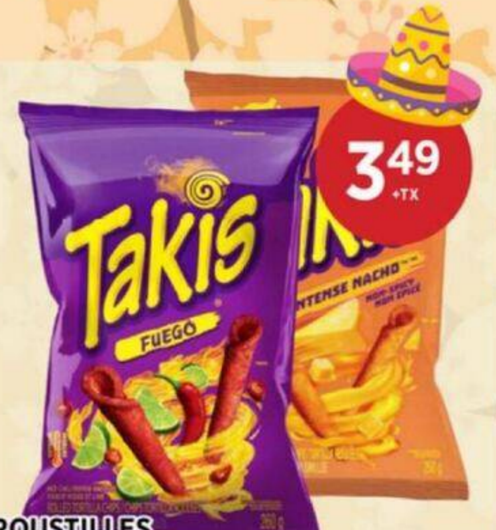
CROUSTILLES (VARIÉTÉS MULTIPLES) TAKIS 260 G CHIPS (MULTIPLE VARIETIES) 薯片 (多種口味) REG. 4.99 + TX