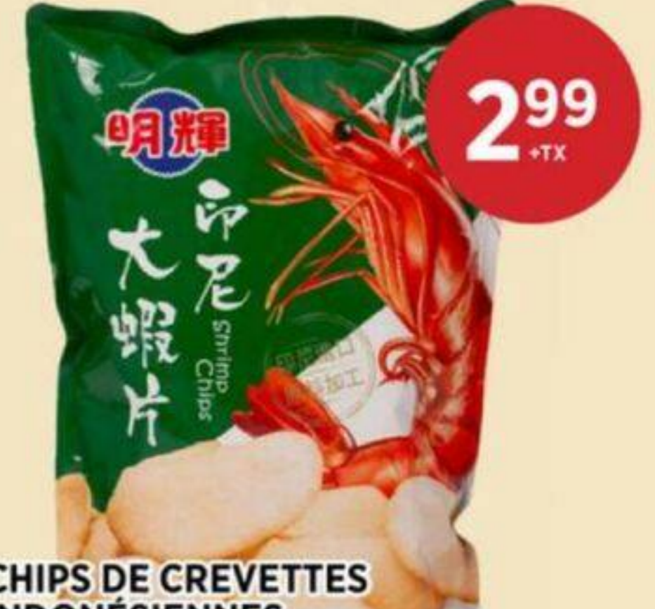
CHIPS DE CREVETTES INDONÉSIENNES BRILLIANT 80 G JUMBO SHRIMP CHIPS 印尼蝦片 REG. 5.29 + TX