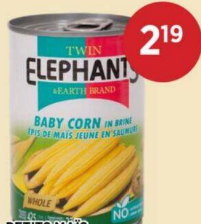
PETITS MAÏS TWIN ELEPHANTS 425 G BABY CORN 小玉米 REG. 2.79