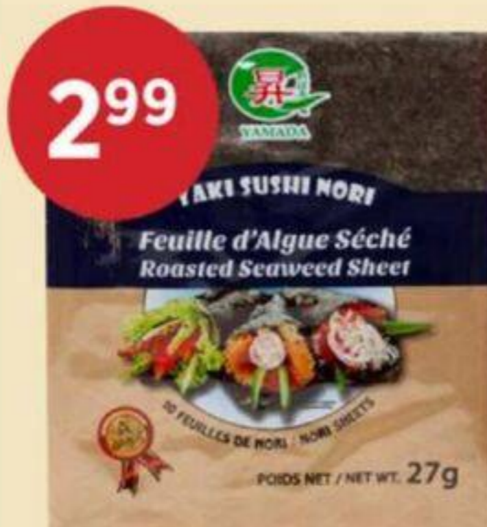
ALGUES SÉCHÉES POUR SUSHI NORI YAMADA 27 G DRIED SEAWEED FOR SUSHI NORI 壽司紫菜 REG. 3.99