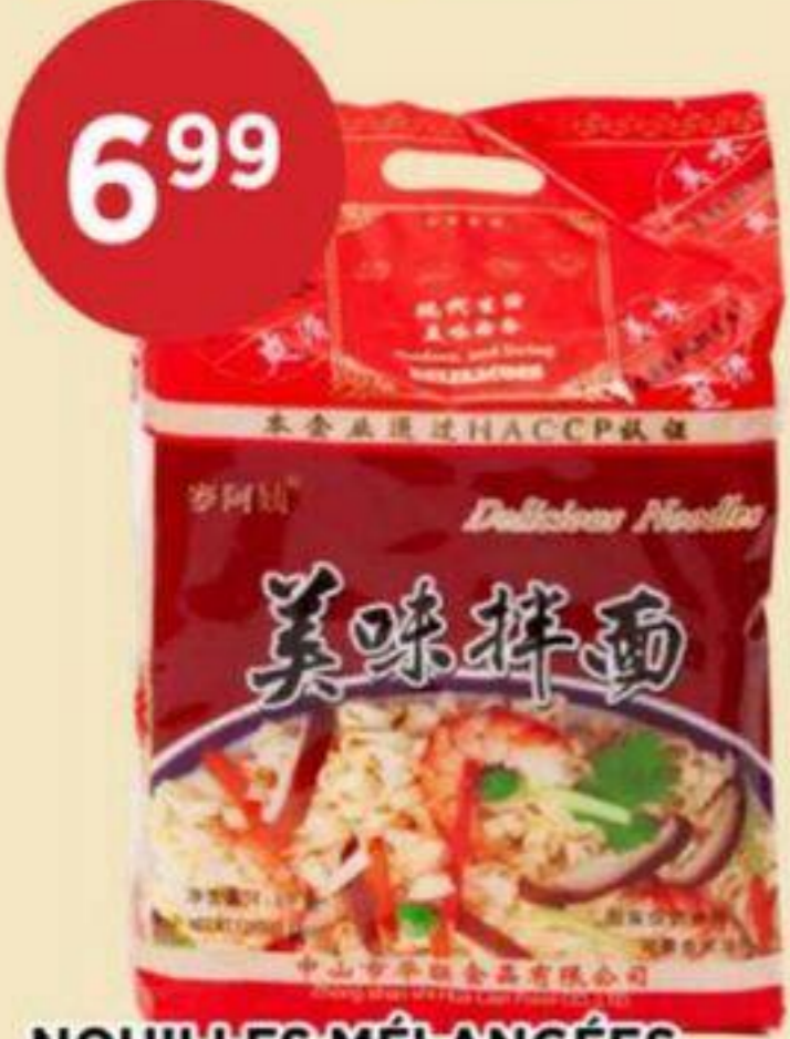
NOUILLES MÉLANGÉES HUA LIAN 1100 G MIXED NOODLES 美味拌麵 REG. 8.99