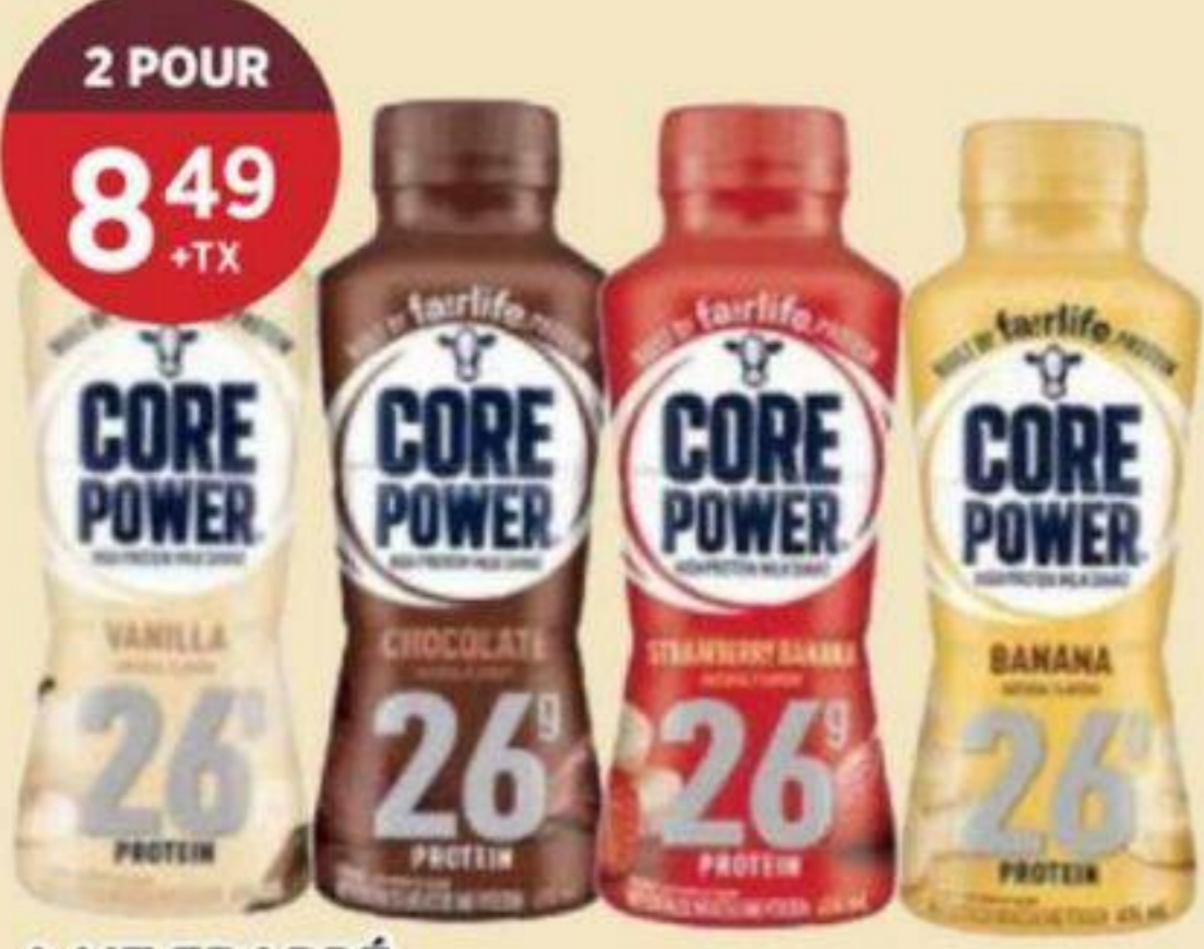
LAIT FRAPPÉ (VARIÉTÉS MULTIPLES) CORE POWER 414 ML 4.59/CH + TX MILKSHAKE (MULTIPLE VARIETIES) 奶昔 (多種口味) REG. 5.59/CH + TX