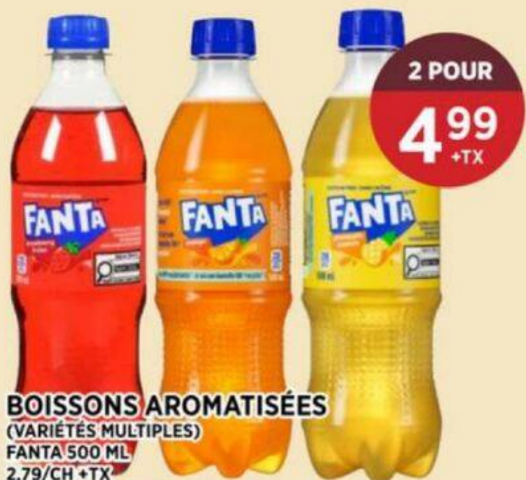
BOISSONS AROMATISÉES (VARIÉTÉS MULTIPLES) FANTA 500 ML 2.79/CH + TX FLAVOURED BEVERAGES (MULTIPLE VARIETIES) 芬達系列飲料 REG. 3.39/CH + TX