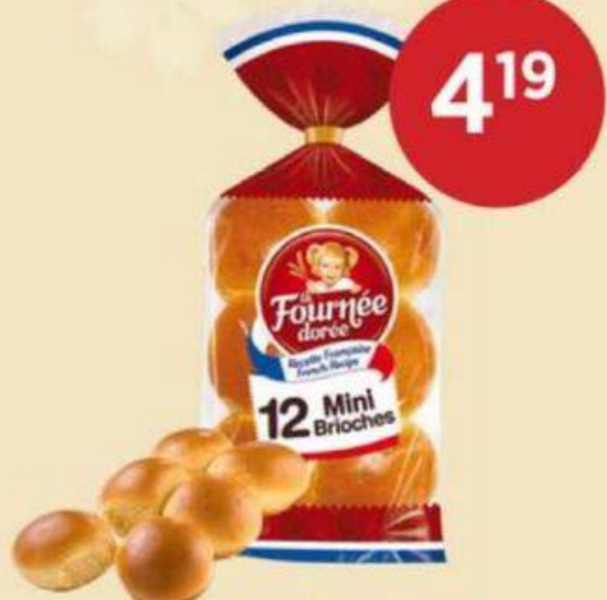
MINI BRIOCHES NATURE LA FOURNÉE DORÉE 480 G MINI BRIOCHES 迷你麵包 REG. 5.29