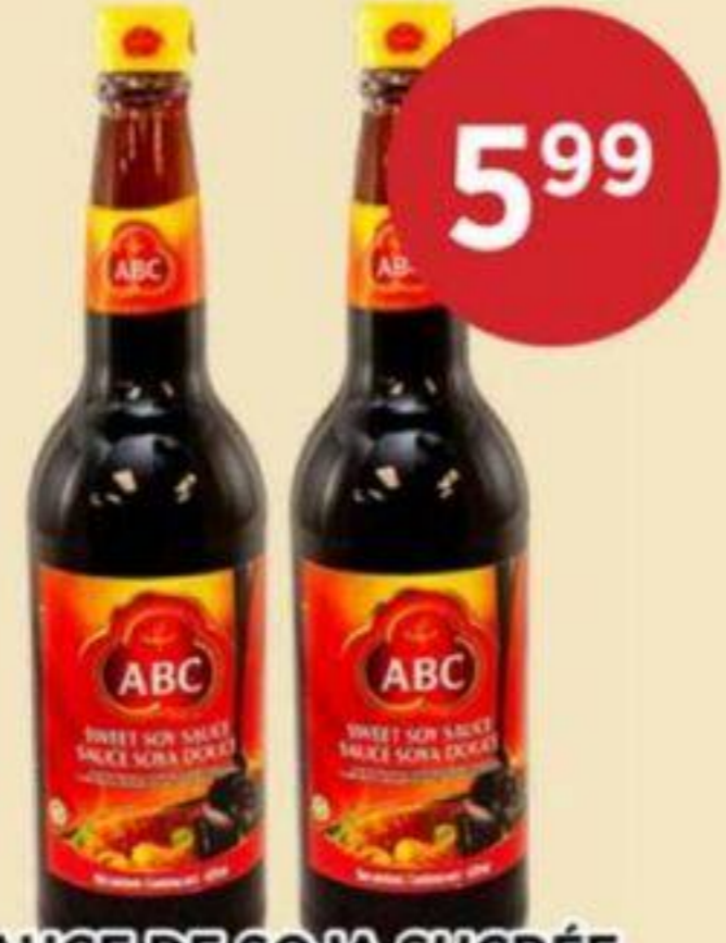
SAUCE DE SOJA SUGRÉE ABC 620 ML SWEET SOY SAUCE 甜醬油 REG. 6.99