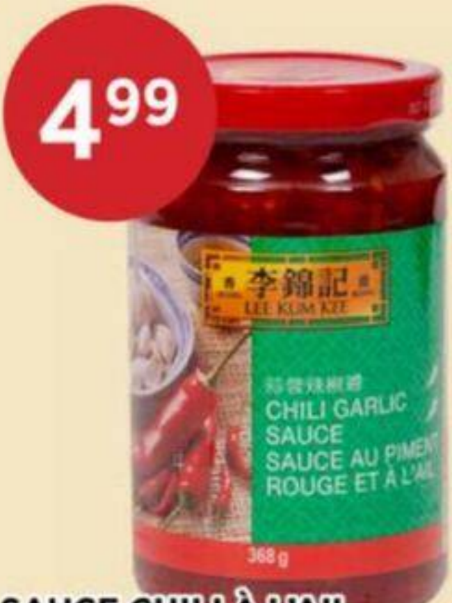
SAUCE CHILI À L'AIL LKK 368 G CHILI GARLIC SAUCE 李錦記蒜蓉辣椒醬 REG. 6.99