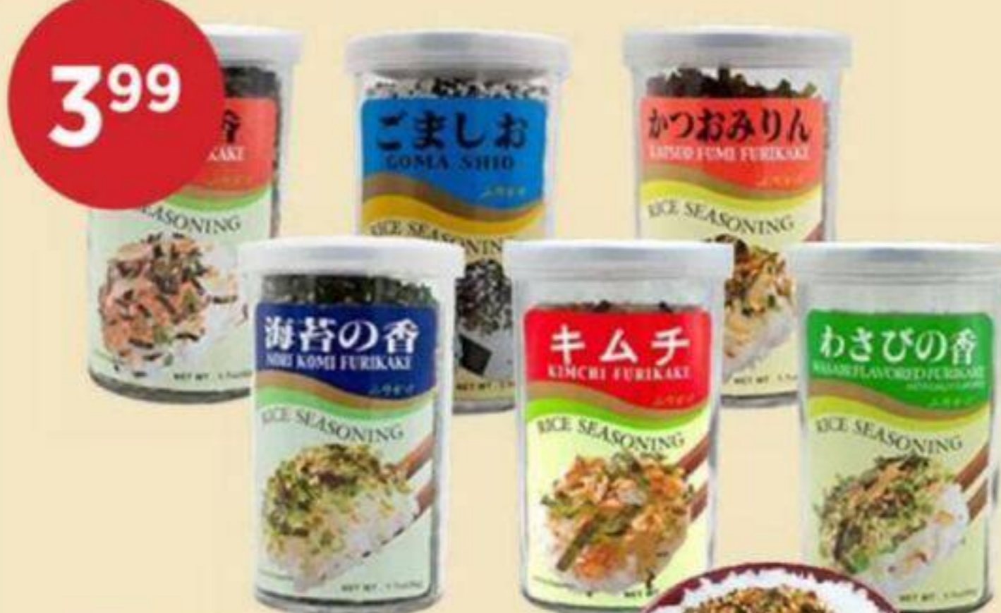
ASSAISONNEMENT POUR RIZ (VARIÉTÉS MULTIPLES) AJISHIMA 48 G - 55 G RICE SEASONING (MULTIPLE VARIETIES) 拌飯調味料 (多種口味) REG. 4.99