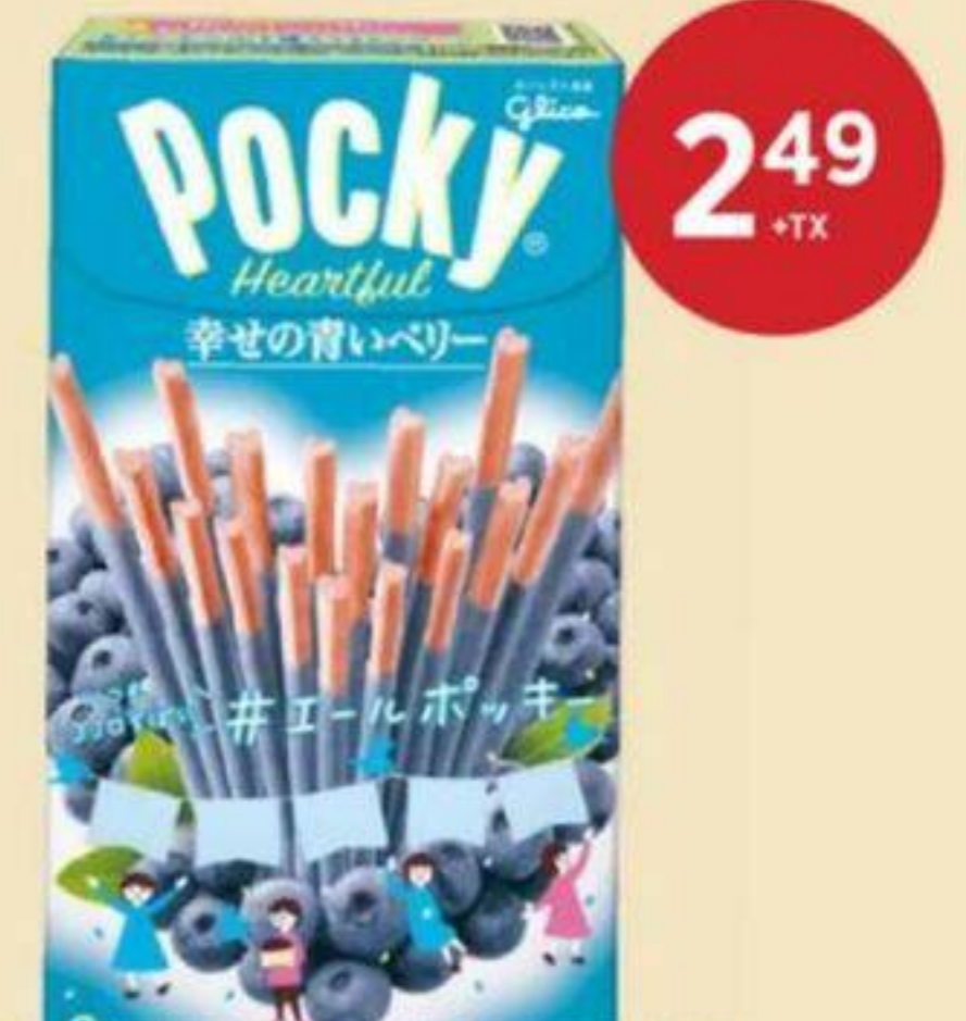
BÂTONNETS POCKY MYRTILLE GLICO 54 G POCKY BLUEBERRY STICKS 藍莓百奇餅乾棒 REG. 3.29 + TX