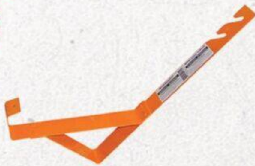
ÉTRIER À TOITURE 50 DEGRÉS #14011P