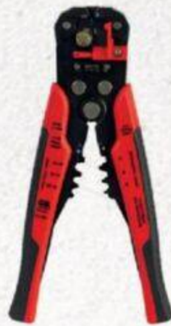
DÉNUDEUR COUPE-FIL AUTO 4-22WG #GS395