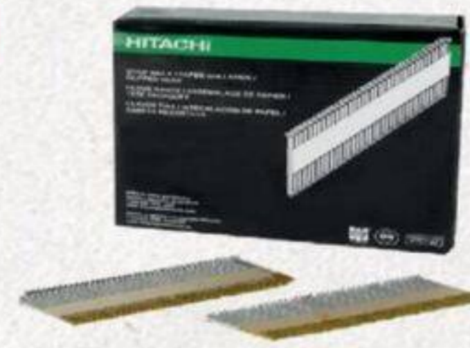
CLOUS DE CHARPENTE 30° Metabo HPT, 3 1/2" #15126HPT