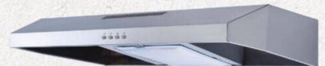
HOTTE DE CUISINE 220 PCM, Acier inoxydable #363619