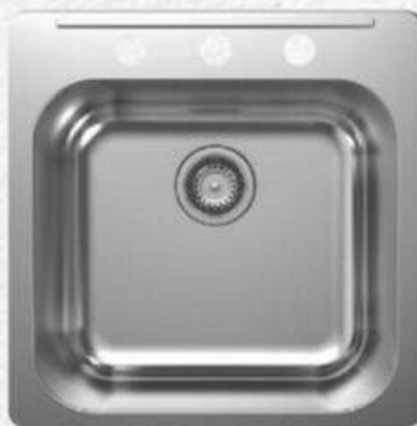
ÉVIER SIMPLE EN ACIER INOXYDABLE 3 trous, 20" x 20 1/2" #21214