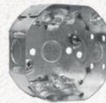
BOÎTE ÉLECTRIQUE OCTOGONALE #54151LVP6