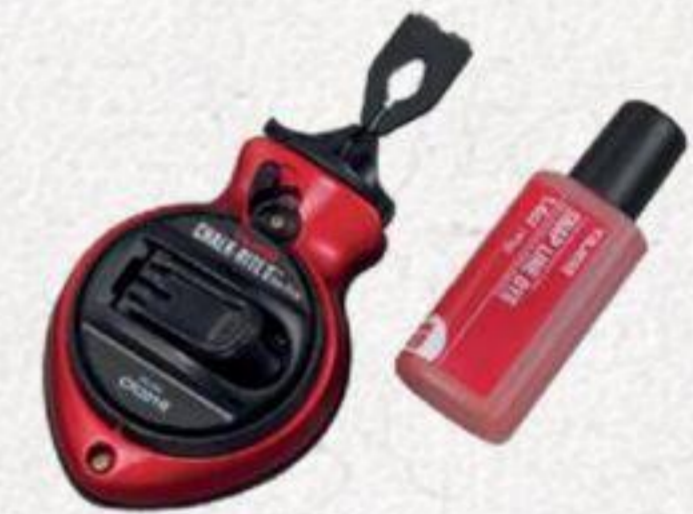
CORDEAU 100' À craie #CR201R