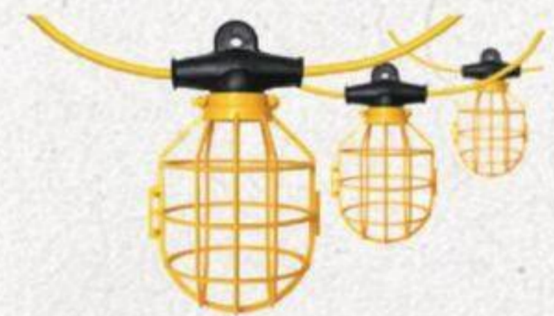
LAMPE DE TRAVAIL SUSPENDUE 14/3, 50' #L002750