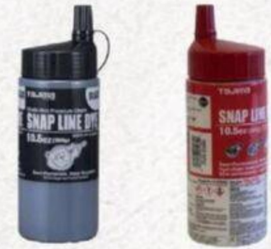
CRAIE POUR CORDEAU Noire ou rouge, Extra-fine, Semi-permanent, 10,5 oz #PLC3BK300/DR300