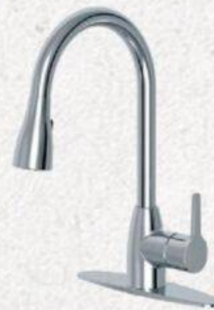
ROBINET D'ÉVIER LEXY Chrome #355225