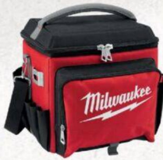
GLACIÈRE DE CHANTIER #48228250