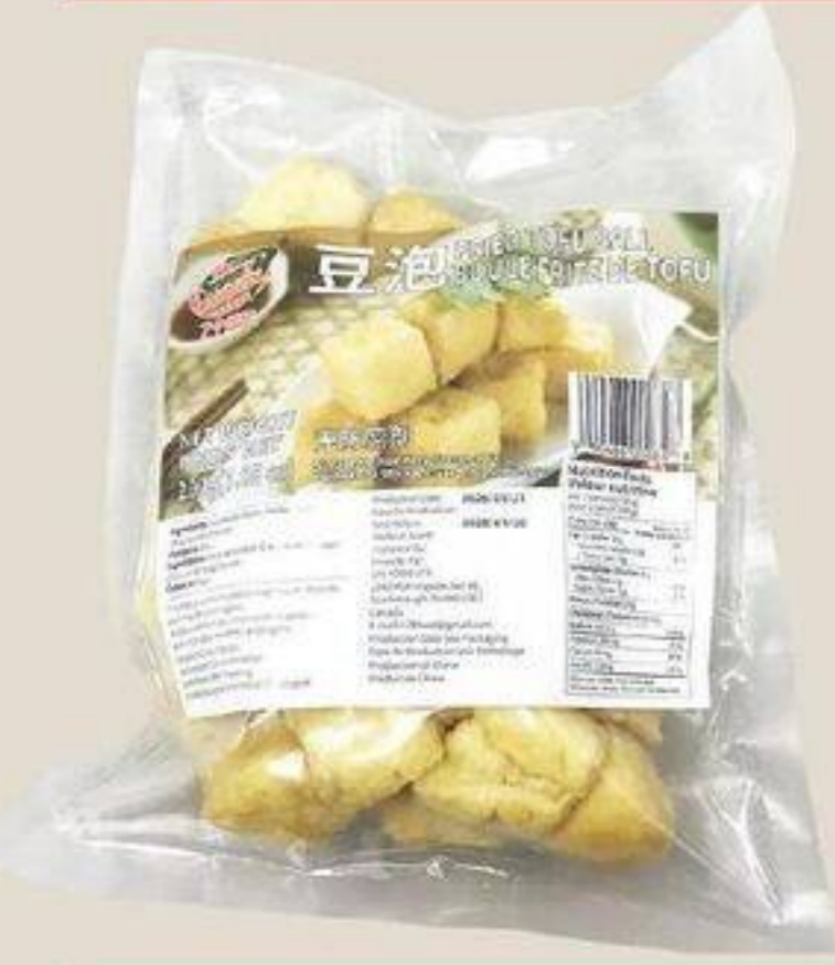
BOULE FRITES DE TOFU 豆泡 200 G