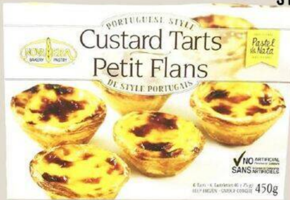
PETIT FLANS DE STYLE PORTUGAIS 盒装蛋挞 450 G