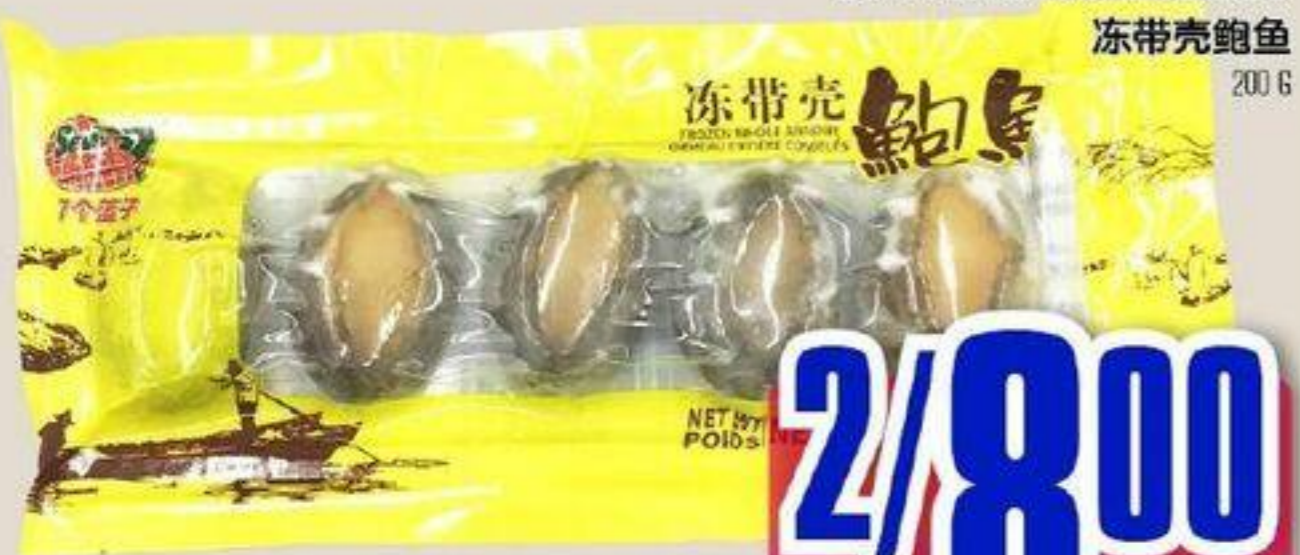
ORMEAUX ENTIÈRE CONGELÉS 冻带壳鲍鱼 200 G