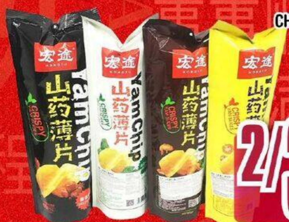
SÉRIES DE CHIPS D'IGNAME 宏途山药薄片系列 90 G