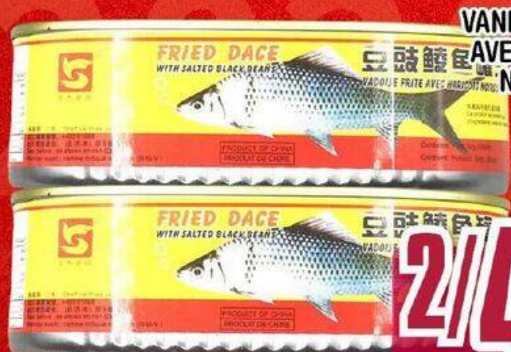
VANDOISE FRITE AVEC HARICOTS NOIRS SALÉS 豆豉鲮鱼 124 G