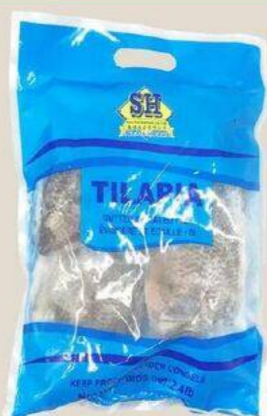
POISSON TILAPIA CONGELÉES 急冻金三侧鱼 2.4 LBS