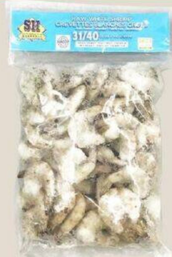
CREVETTES BLANCHES 31/40 去头白虾 908 G