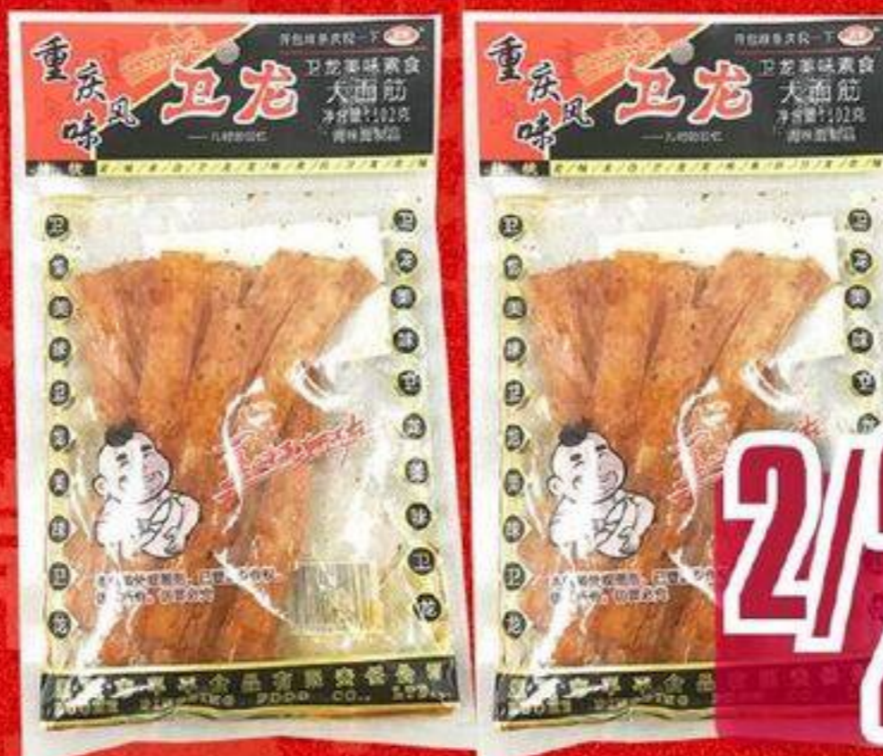
BÂTON DE GLUTEN 卫龙大面筋辣条 102 G