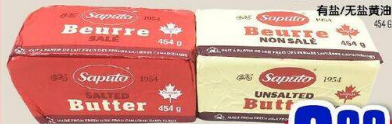
BEURRE SALÉ / NON SALÉ 有盐/无盐黄油 454 G