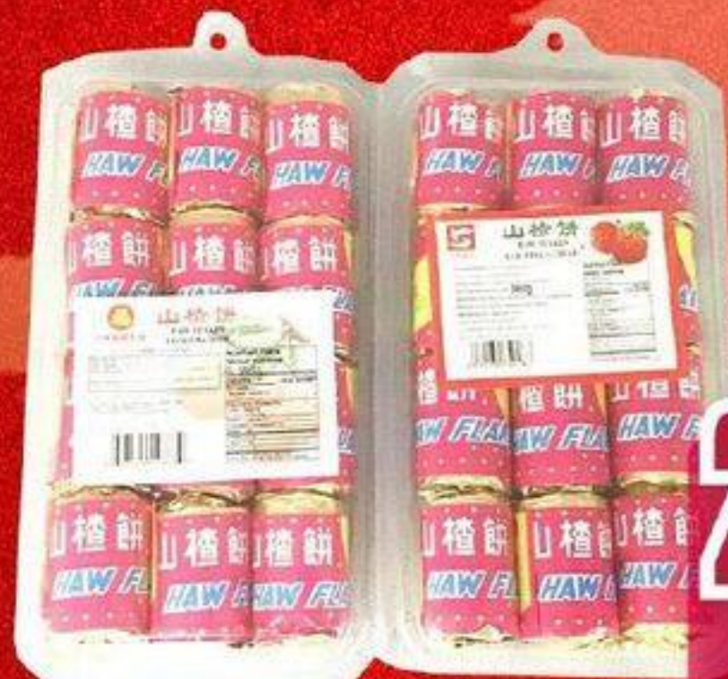
GÂTEAU À L'AUBÉPINE 福字/亚杰山楂饼 306 G