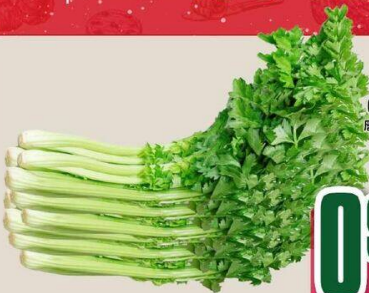
CÉLERI BLANC CHINOIS 唐人白香芹 2.16 /KG