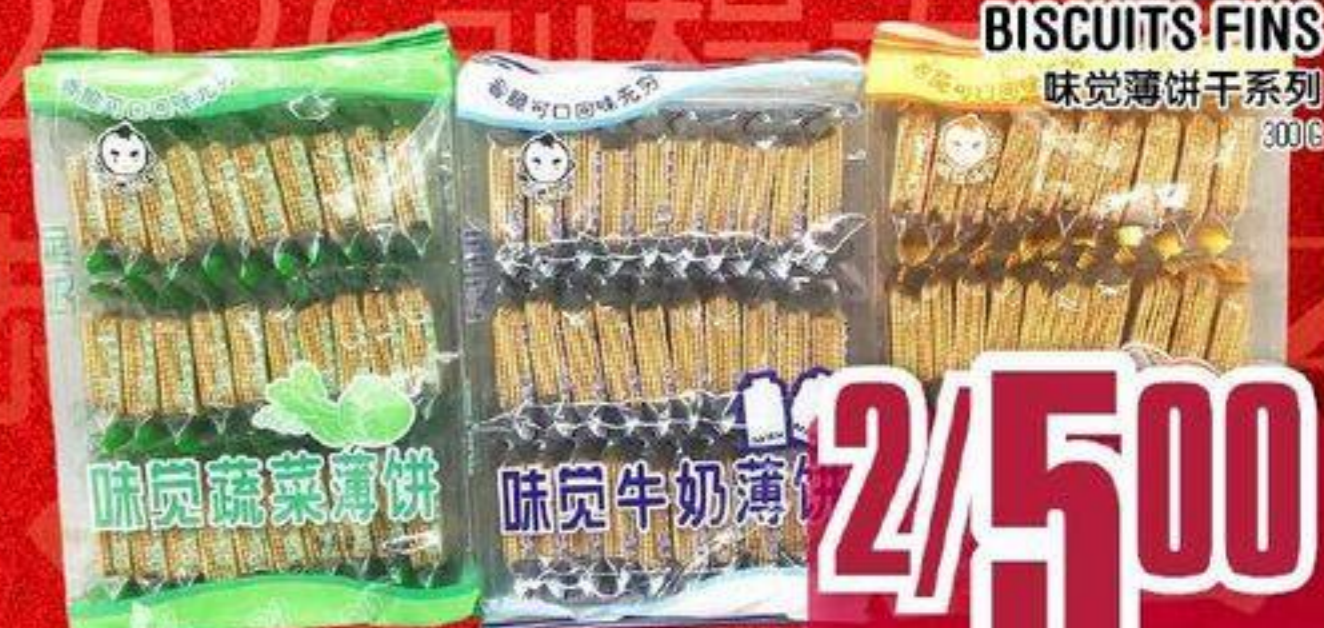
SÉRIES DE BISCUITS FINS 味觉薄饼干系列 200 G