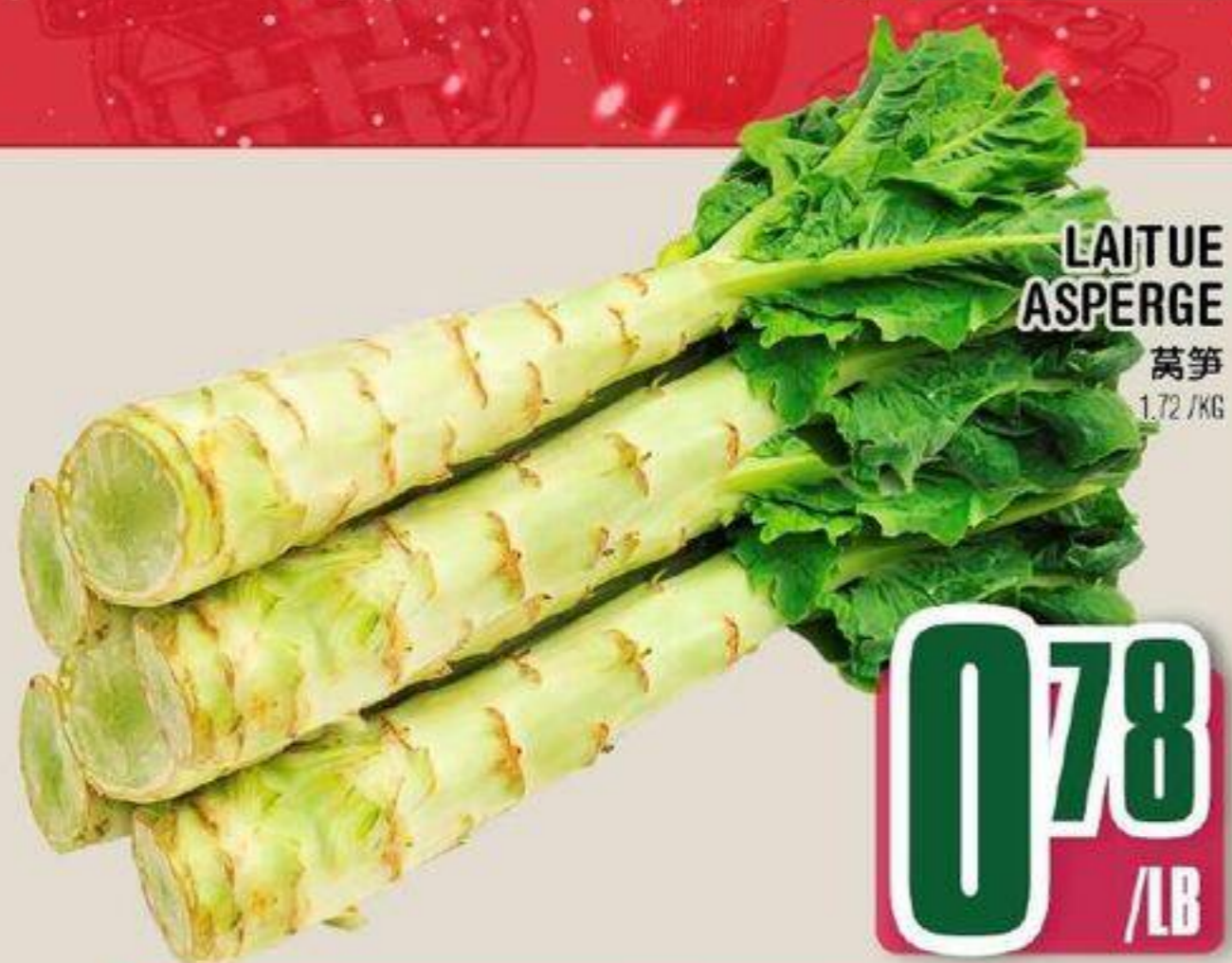
LAITUE ASPERGE 莴笋 1.72 /KG