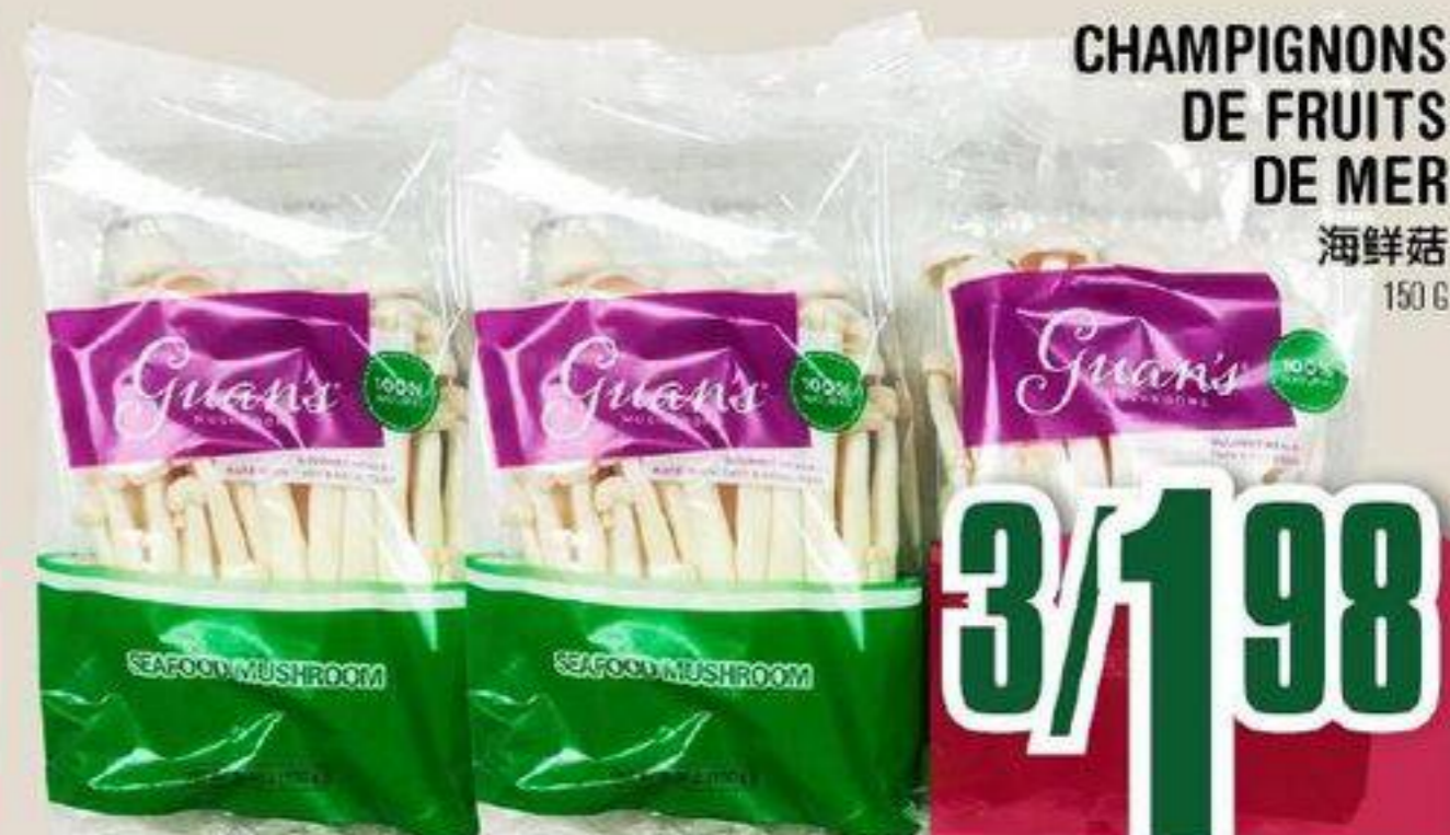
CHAMPIGNONS DE FRUITS DE MER 海鲜菇 150 G