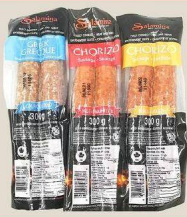
SÉRIES DE SAUCISSE SALAMINA 萨拉米香肠系列 300 G