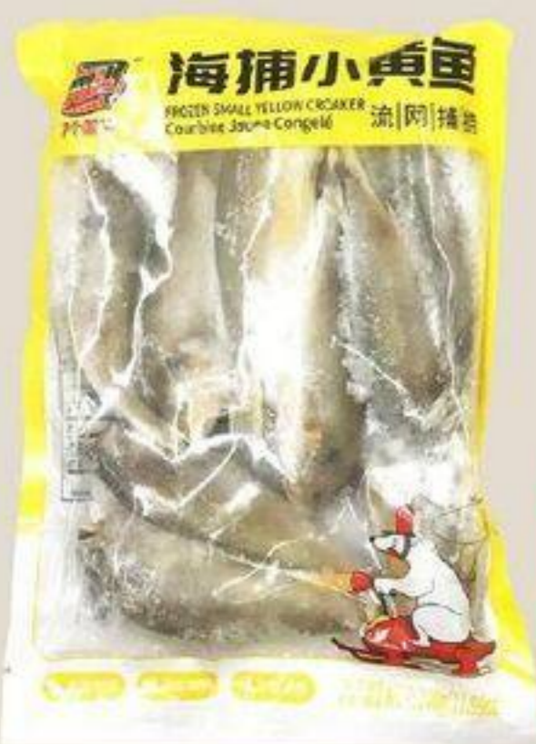
COURBINE JAUNE CONGELÉ 海捕小黄鱼 340 G