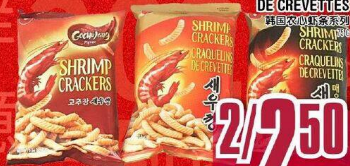
CRAQUELINS DE CREVETTES 韩国农心虾条系列 SHRIMP CRACKERS CRAQUELINS DE CREVETTE 178 G