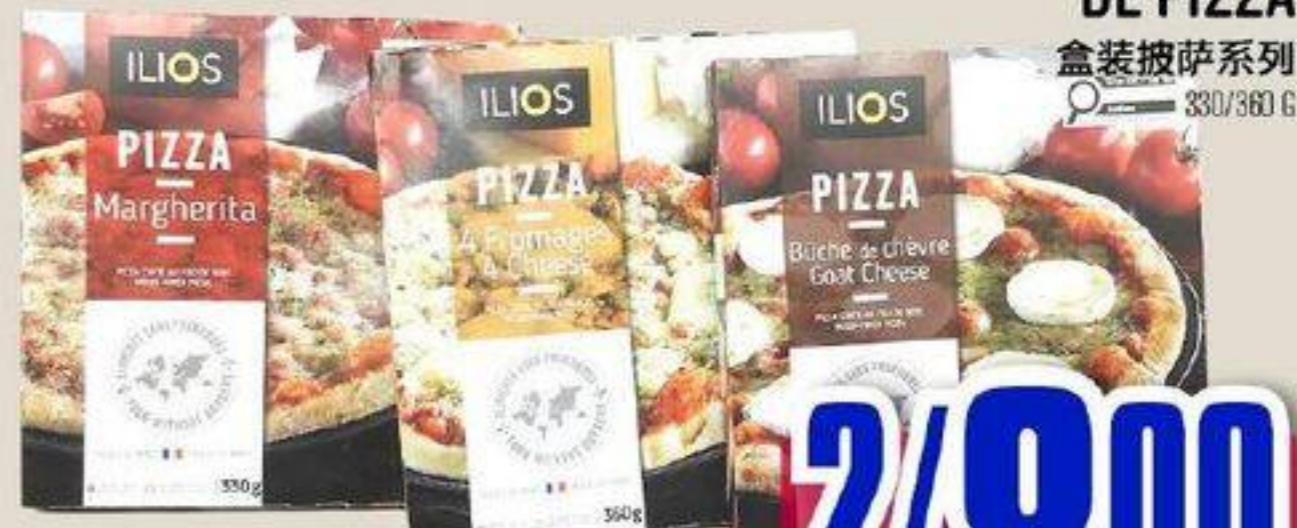
SÉRIES DE PIZZA 盒装披萨系列 330/380 G