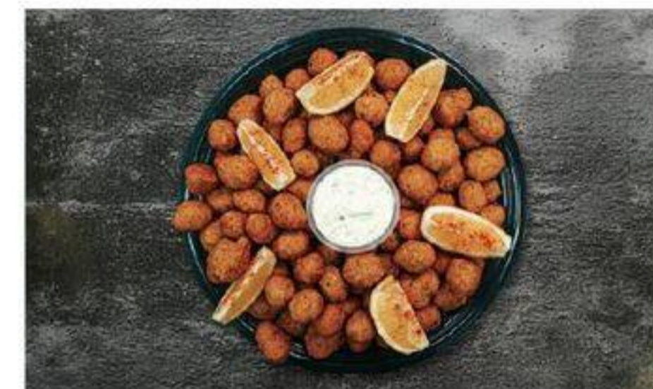
PLATEAU DE BEIGNETS AU SAUMON CAJUN