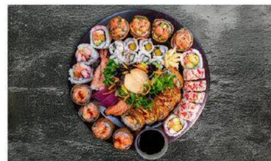
PLATEAU DE SUSHIS FESTIFS