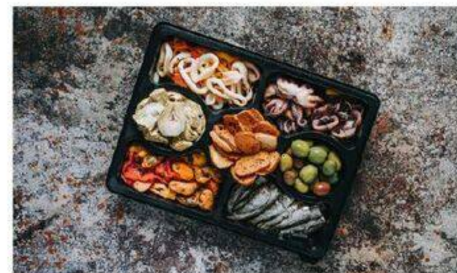
PLATEAU DE SPÉCIALITÉS TAPAS