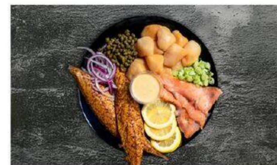
PLATEAU DU FUMOIR D'ANTAN