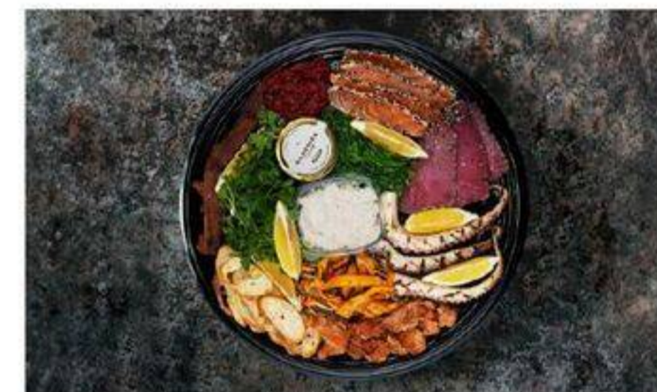
PLATEAU TÊTE À TÊTE