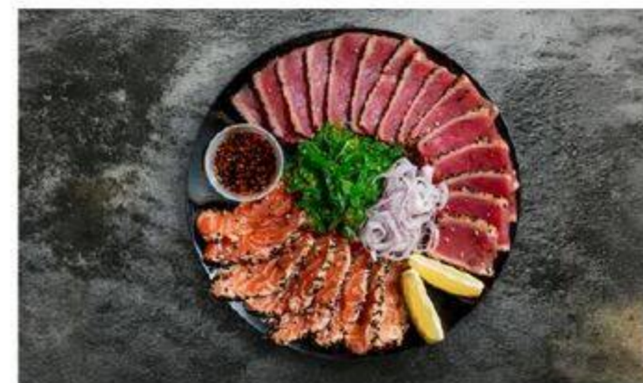
DUO DE TATAKIS