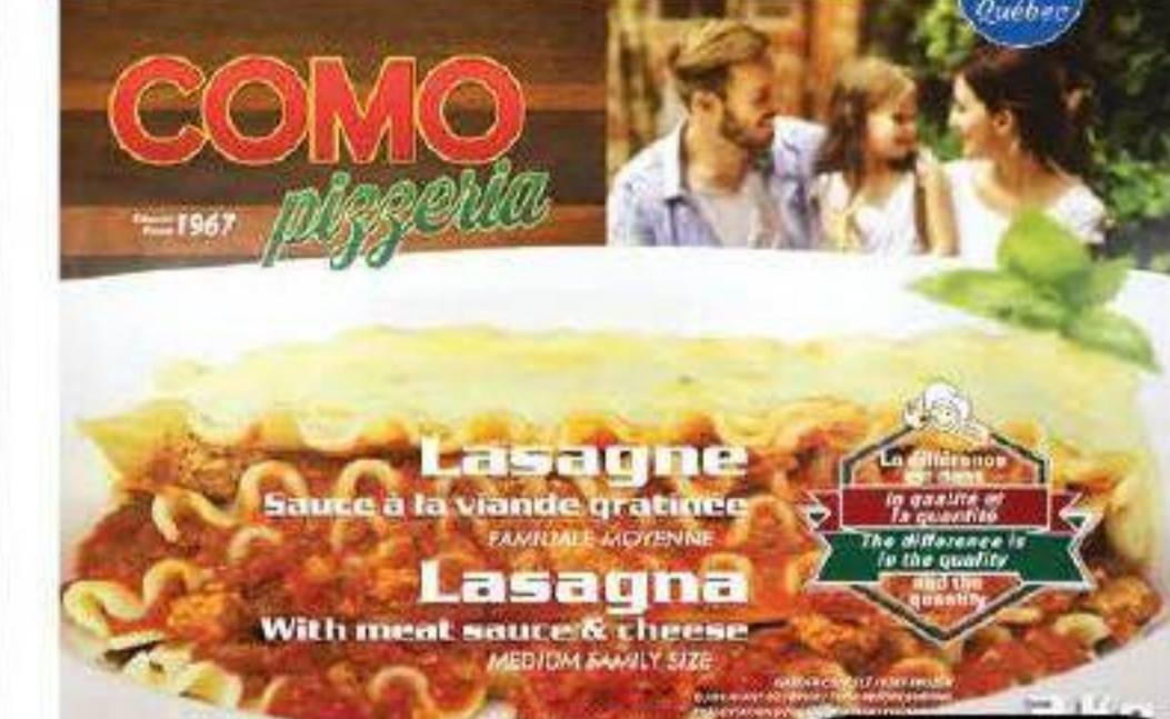
Lasagne gratinée à la viande «Como Pizzeria» 2kg