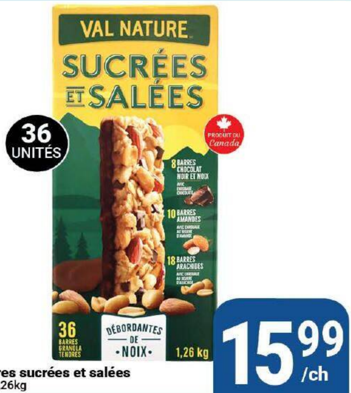
Barres tendres sucrées et salées «Val Nature» 1,26kg