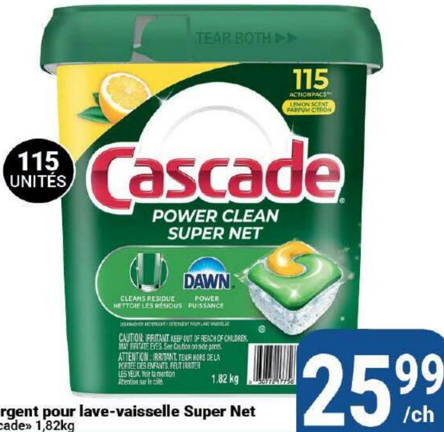
Détergent pour lave-vaisselle Super Net «Cascade» 1,82kg