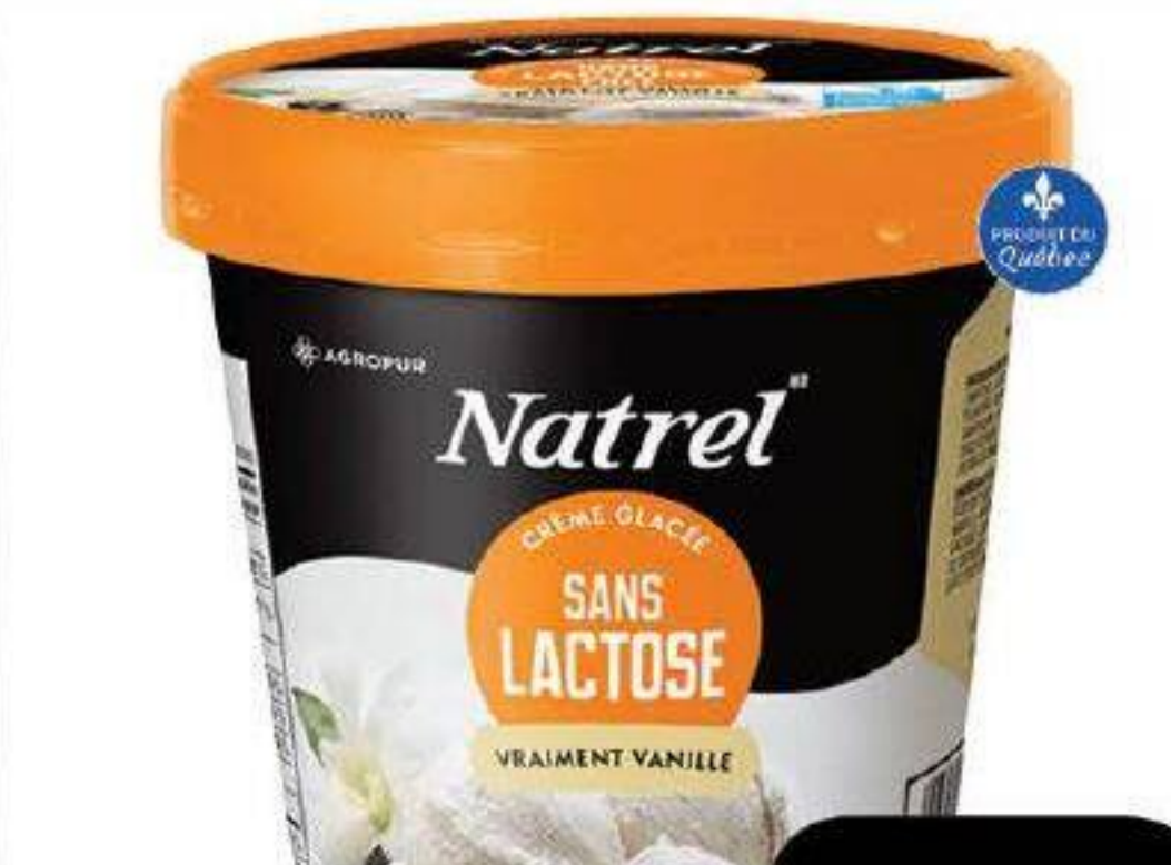
Crème glacée sans lactose «Natrel» 473ml