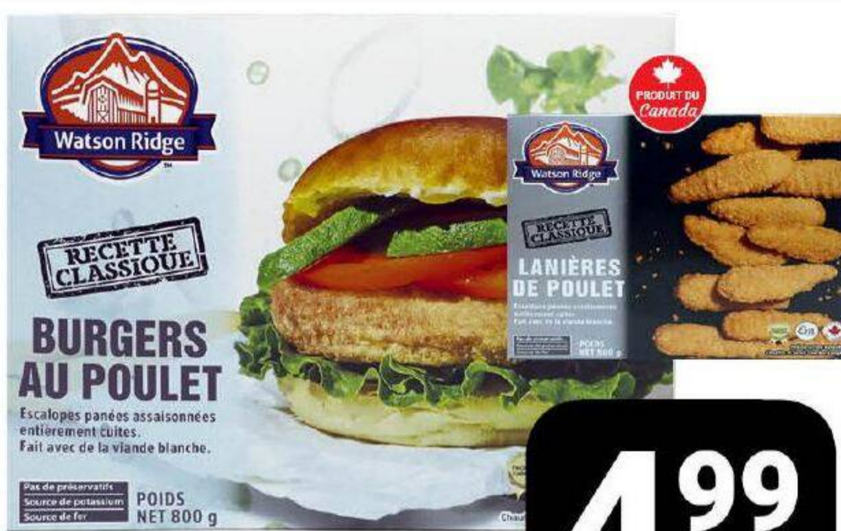
Poulet pop corn, en pépites, en lanières, burgers ou boulettes «Watson Ridge» 800g