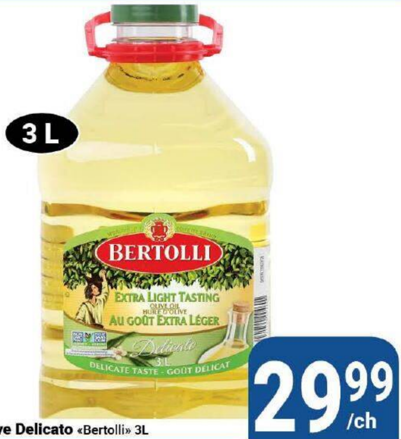
Huile d'olive Delicato «Bertolli» 3L