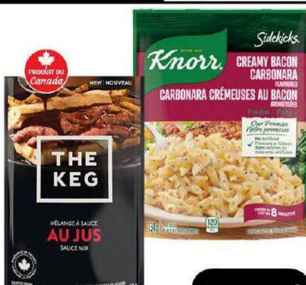
Plat d'accompagnement Sidekicks «Knorr» 120g / 167g ou Sauce en enveloppe «The Keg» 21g / 32g