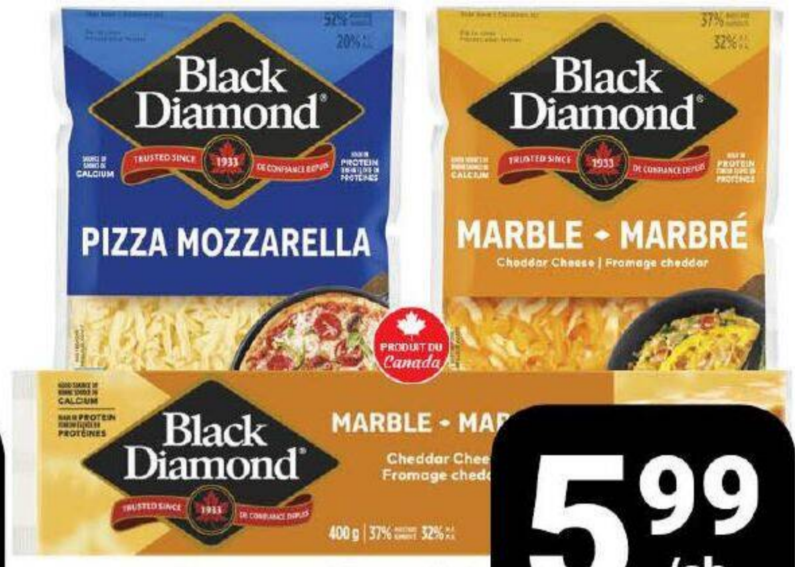
Fromage en bloc ou râpé «Black Diamond» 320g / 400g