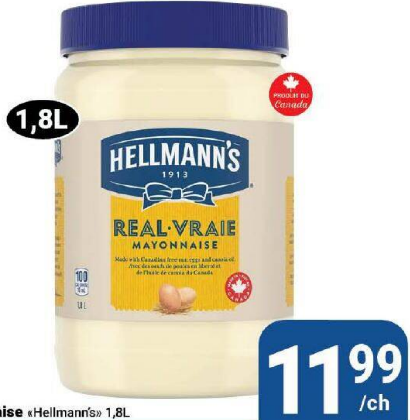
Mayonnaise «Hellmann's» 1,8L