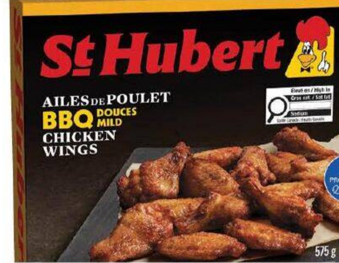
Ailes de poulet «St-Hubert» 575g