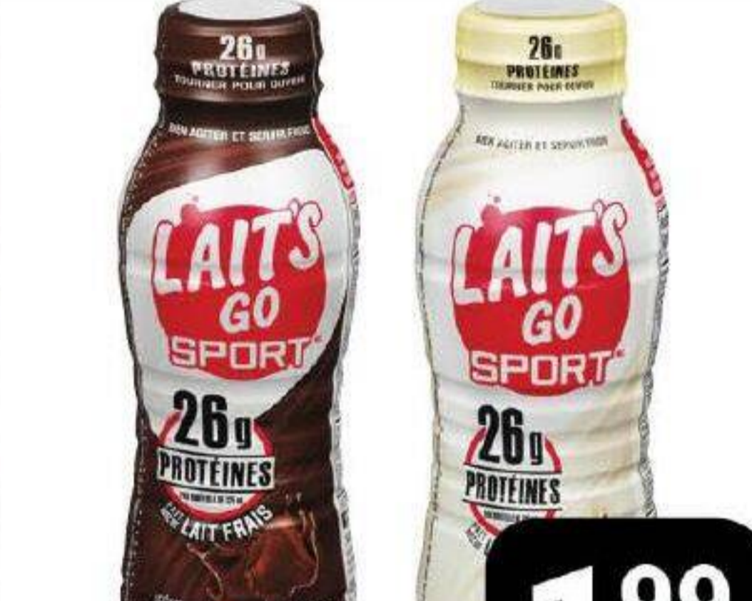
Lait frappé protéiné «Lait's Go» 325ml * Bouteilles consignées