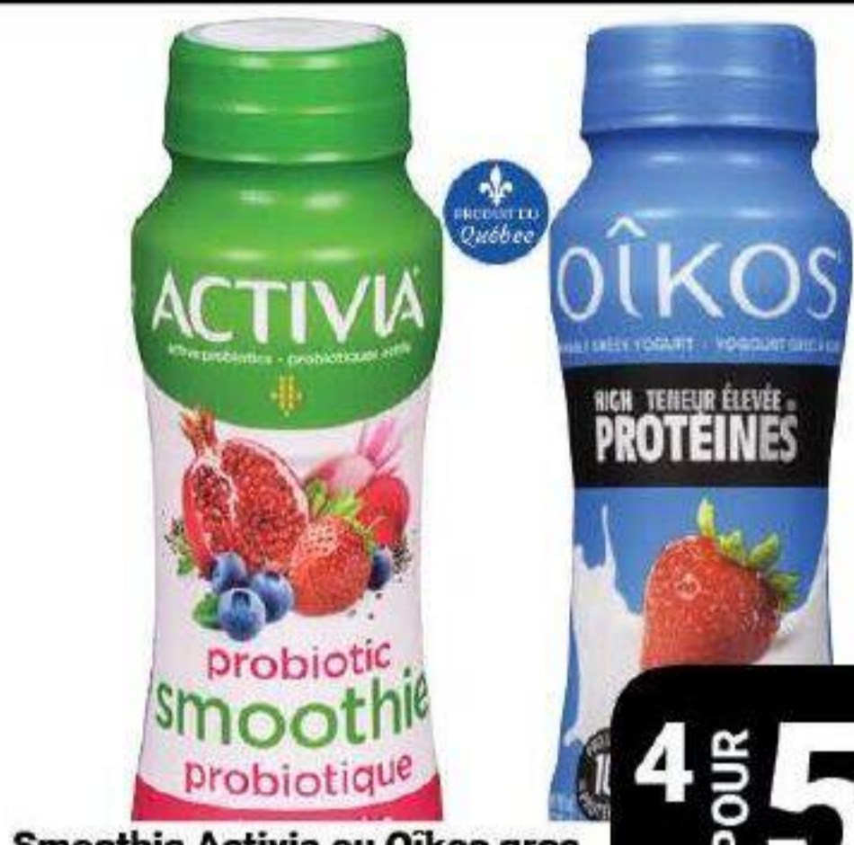
Smoothie Activia ou Oikos grec «Danone» 190ml