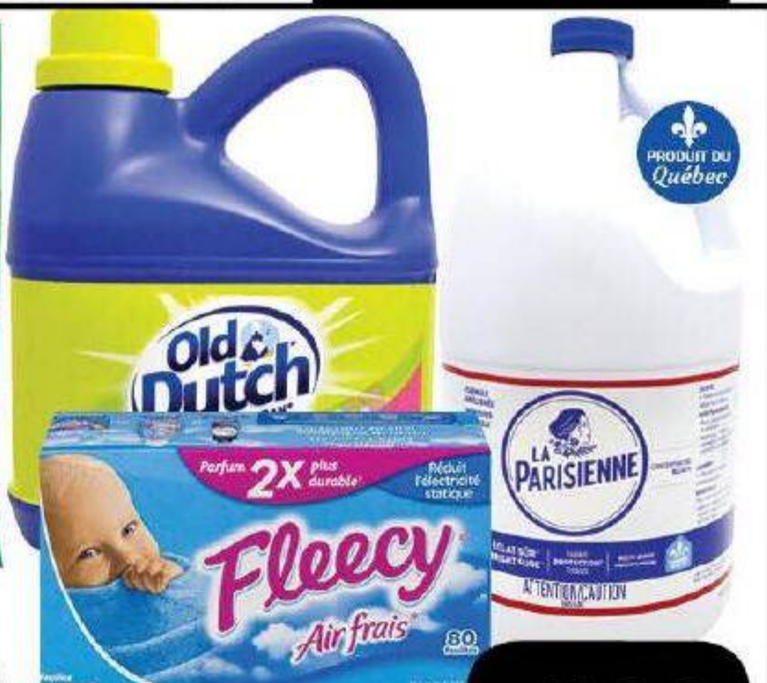
Eau de javel «La Parisienne» 3,6L, Assouplisseur à lessive «Fleecey» 80 feuilles ou Détergent à lessive «Old Dutch» 4L