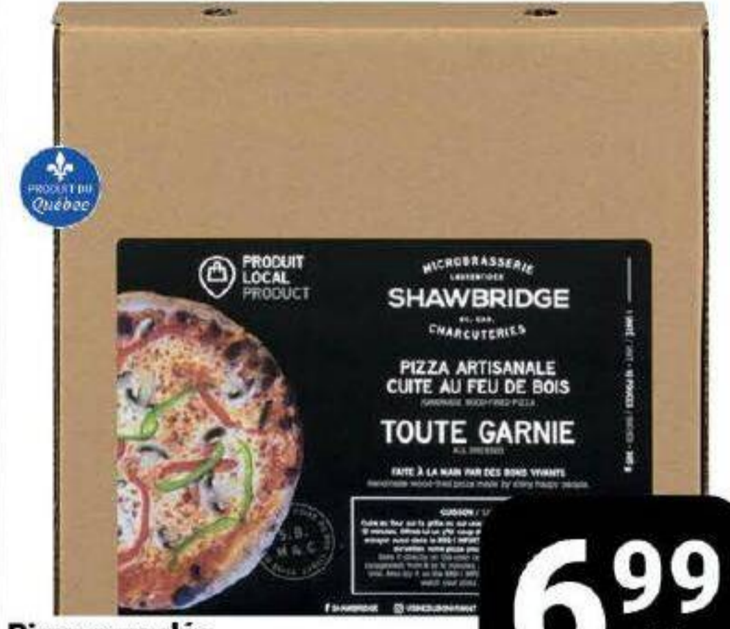
Pizza surgelée «Shawbridge» 325g / 385g