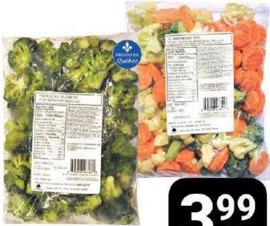
Légumes surgelés «Alaska» 1kg