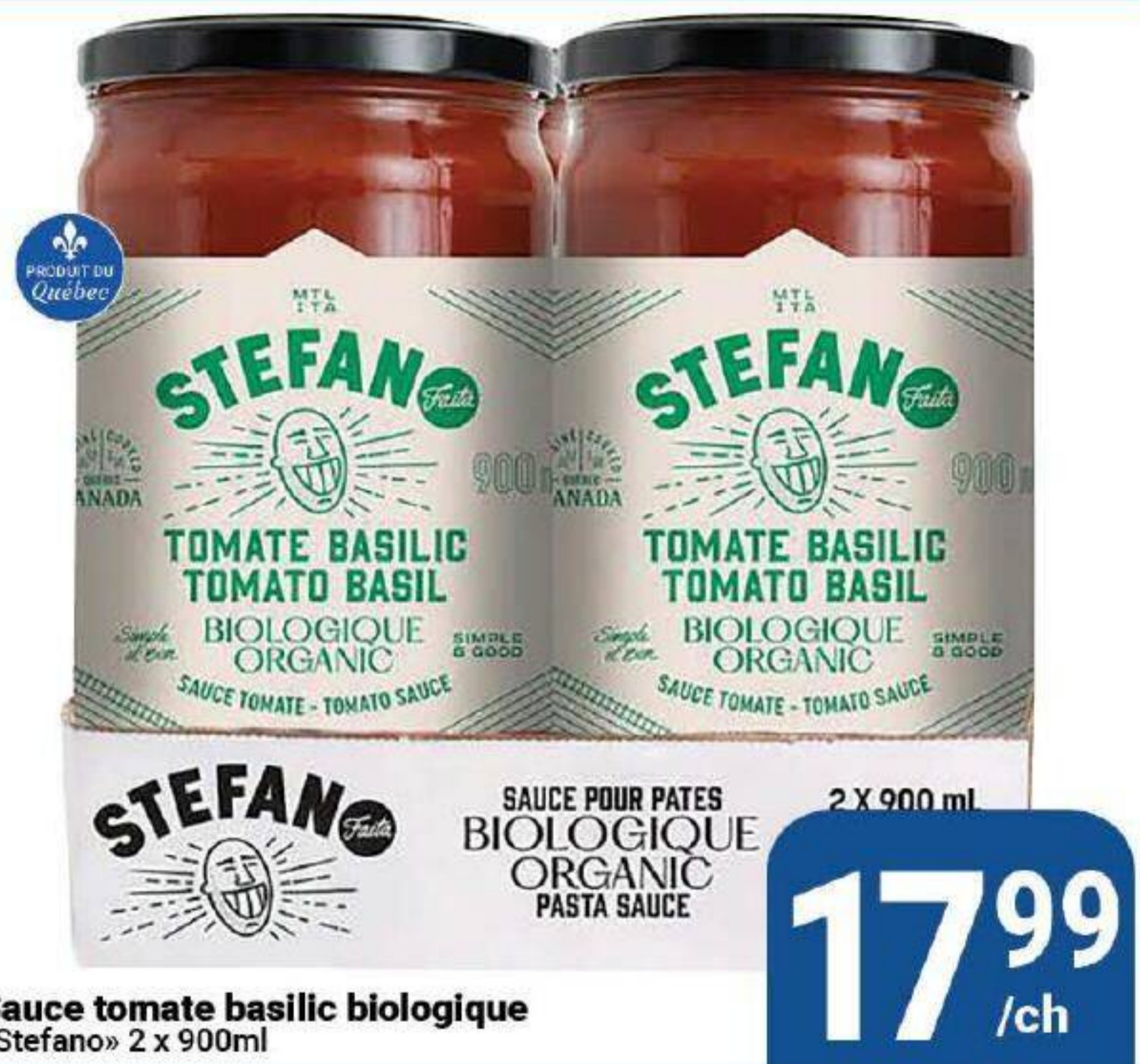
Sauce tomate basilic biologique «Stefano» 2 x 900ml