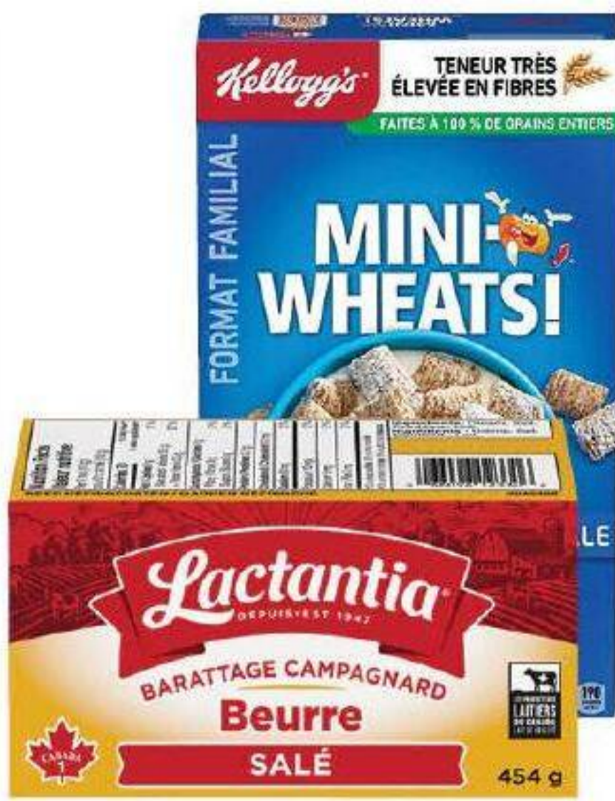
Beurre «Lactantia» 454g ou Céréales format familial «Kellogg's» 360g / 650g