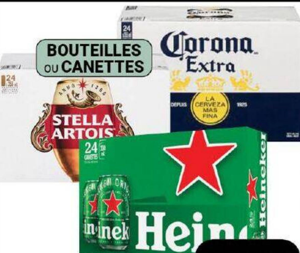
Bière «Heineken, Stella Artois ou Corona» 24 bouteilles ou canettes * Bouteilles et canettes consignées