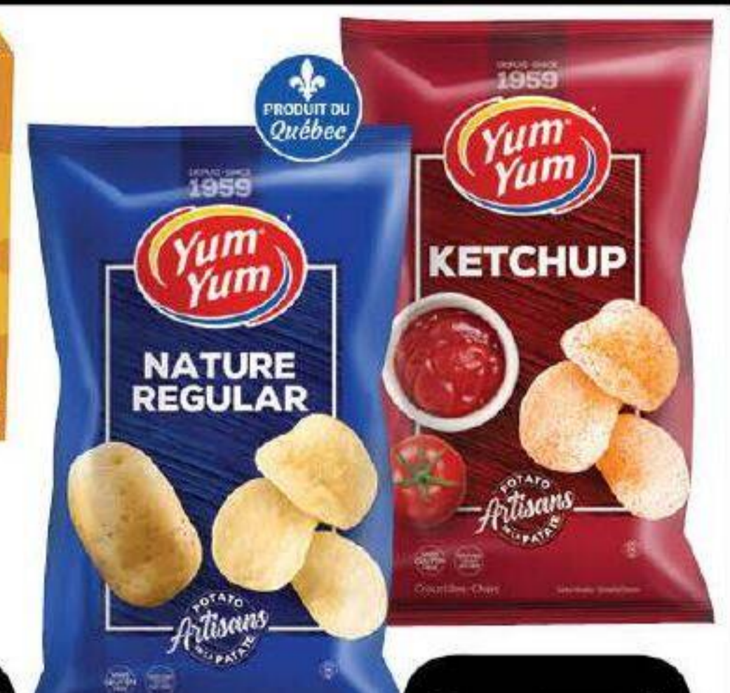
Croustilles «Yum Yum» 170g / 200g * Plusieurs variétés