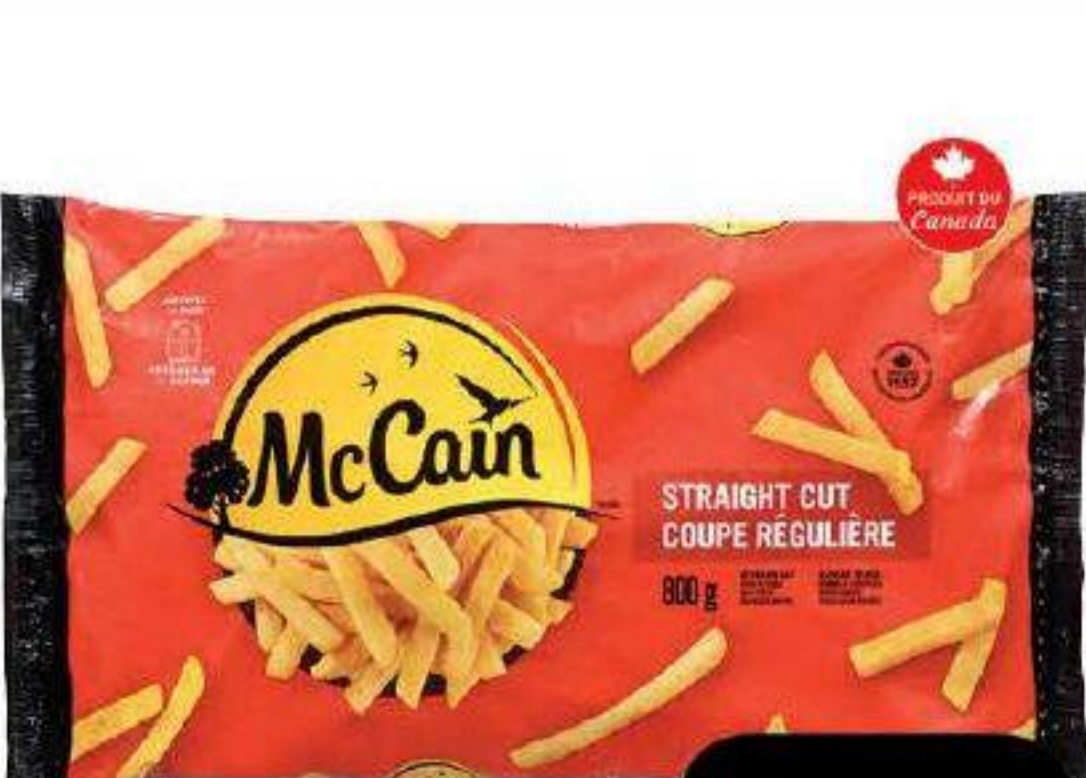
Frites régulières «McCain» 800g