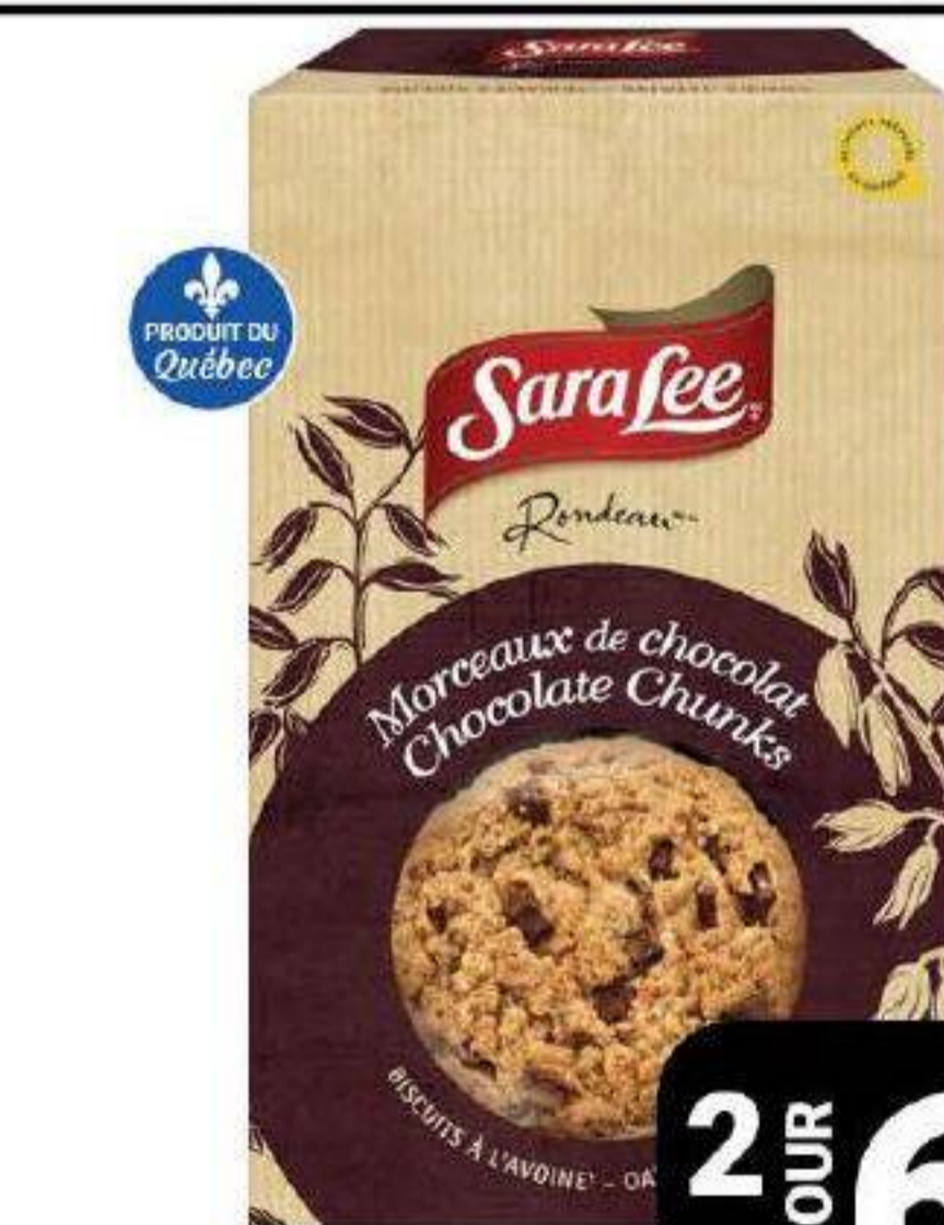
Biscuits Rondau «Sara Lee» 300g