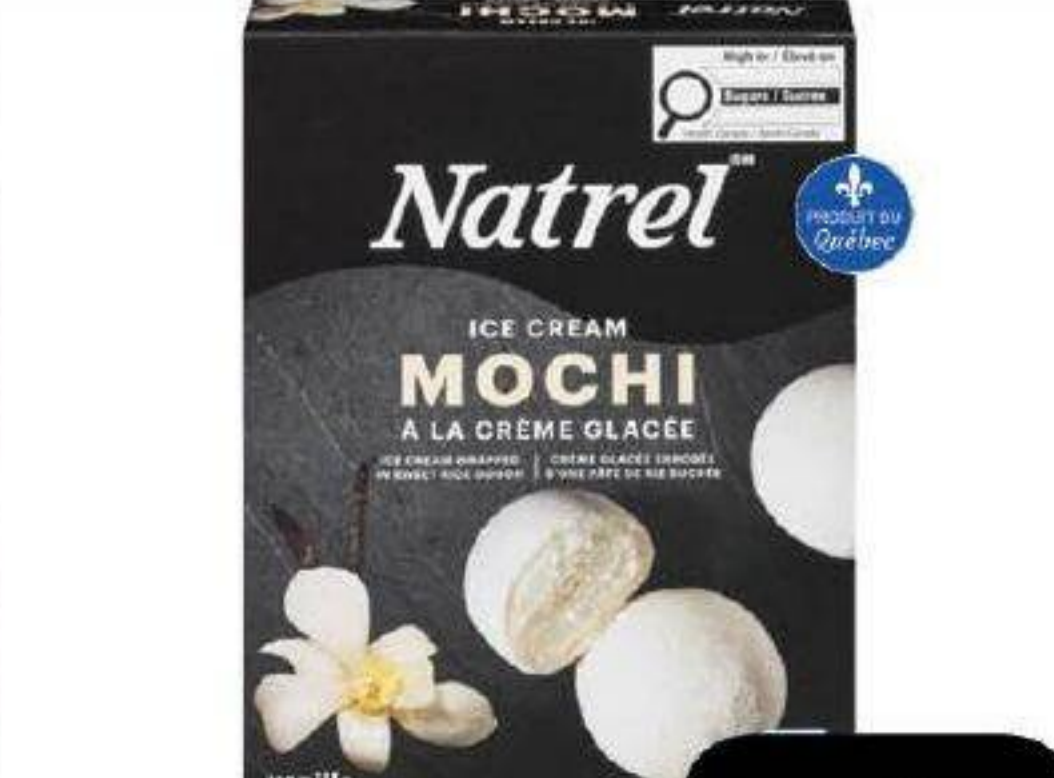
Mochi à la crème glacée «Natrel» 6 x 35ml