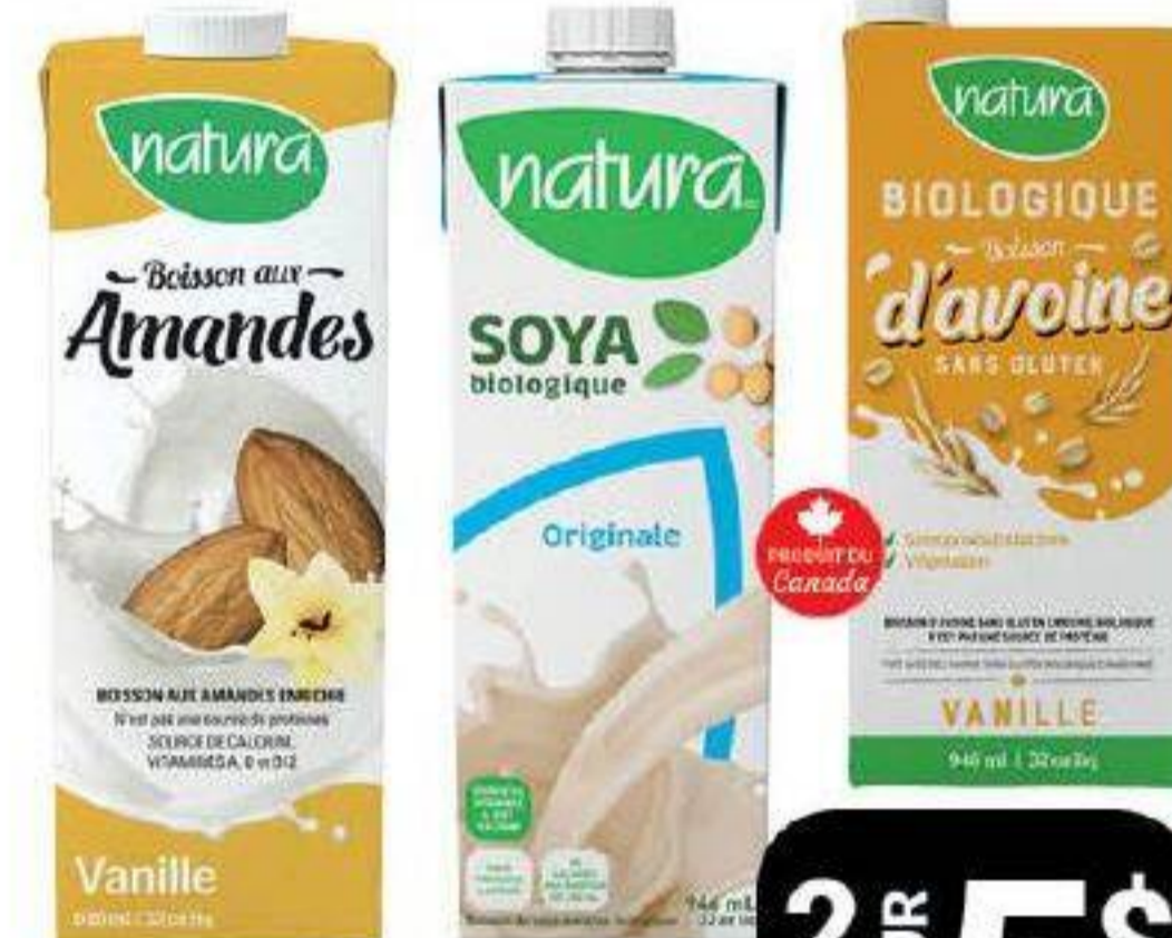
Boisson aux amandes, biologique d'avoine ou soya «Natura» 946ml