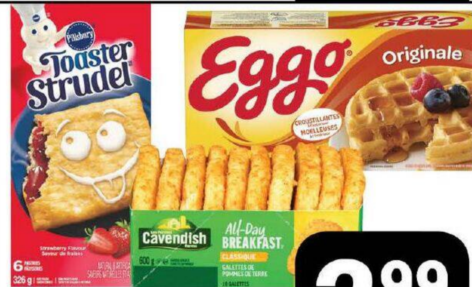
Gaufres 280g / 330g, Bâtonnets 270g Crêpes 280g «Kellogg's», Toaster Strudel «Pillsbury» 326g ou Galettes de pommes de terre hachées «Cavendish» 600g