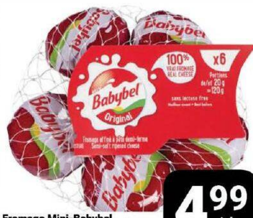
Fromage Mini-Babybel «Babybel» 6 unités