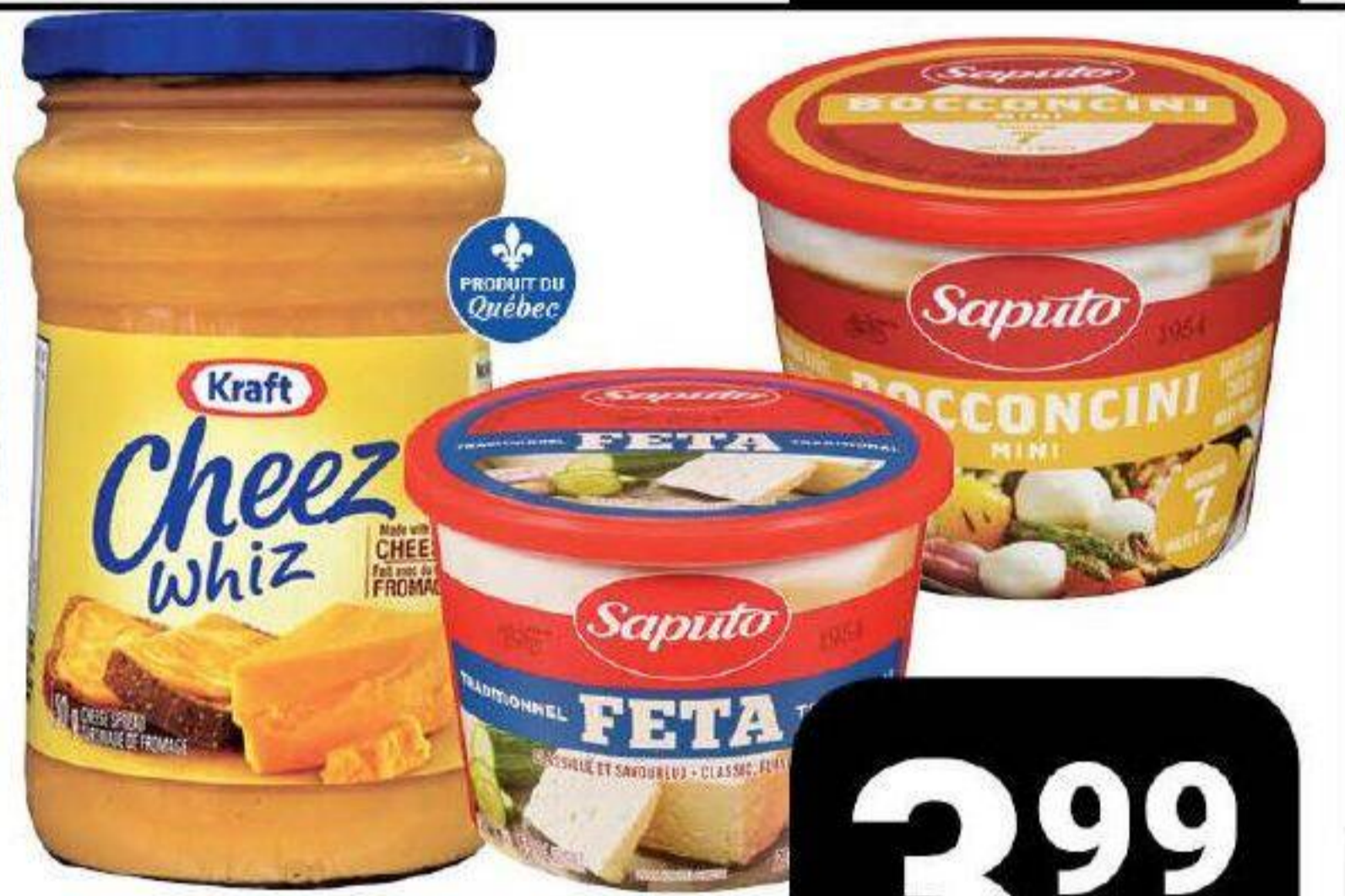
Fromage Bocconcini, Feta traditionnel ou à saveurs «Saputo» 170g / 200g ou Tartinade Cheez Whiz «Kraft» 450g