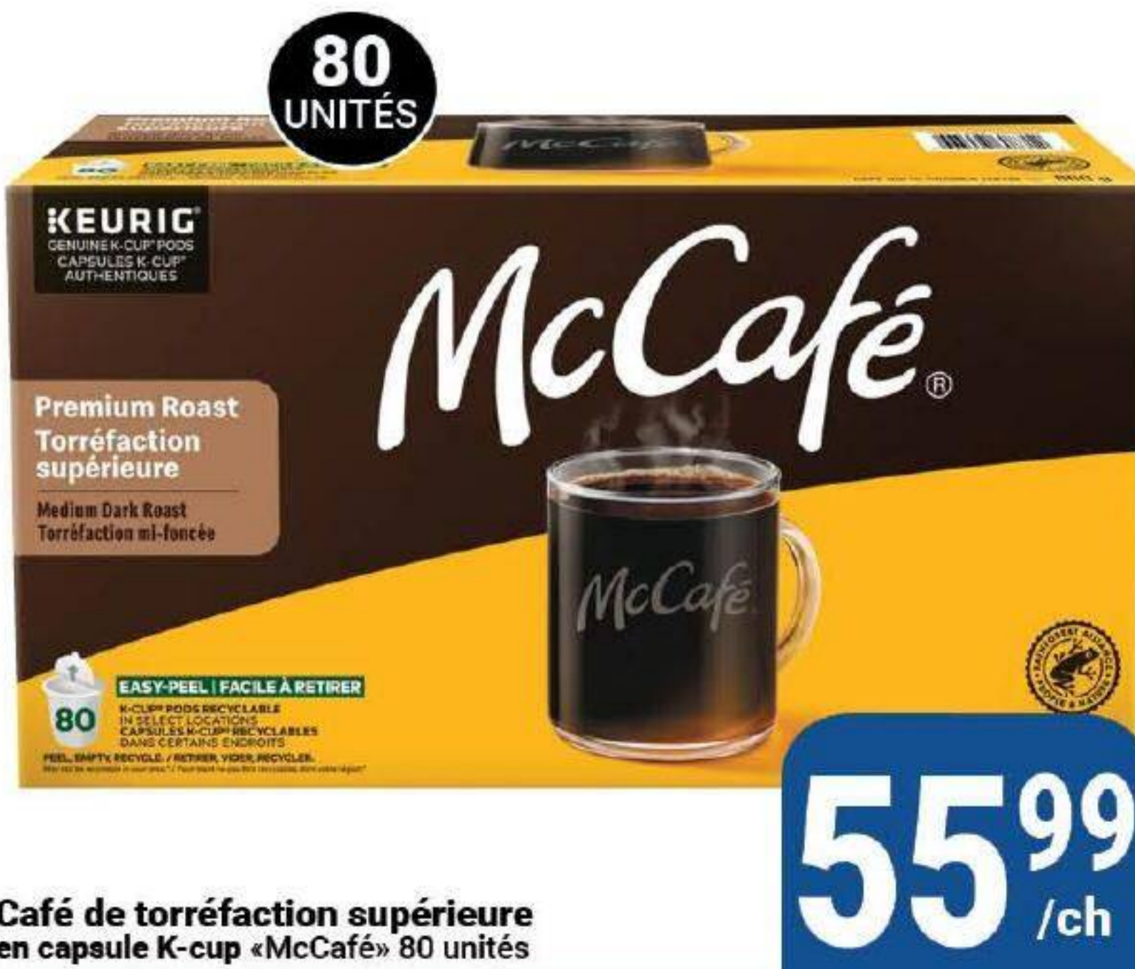
Café de torréfaction supérieure en capsule K-cup «McCafé» 80 unités