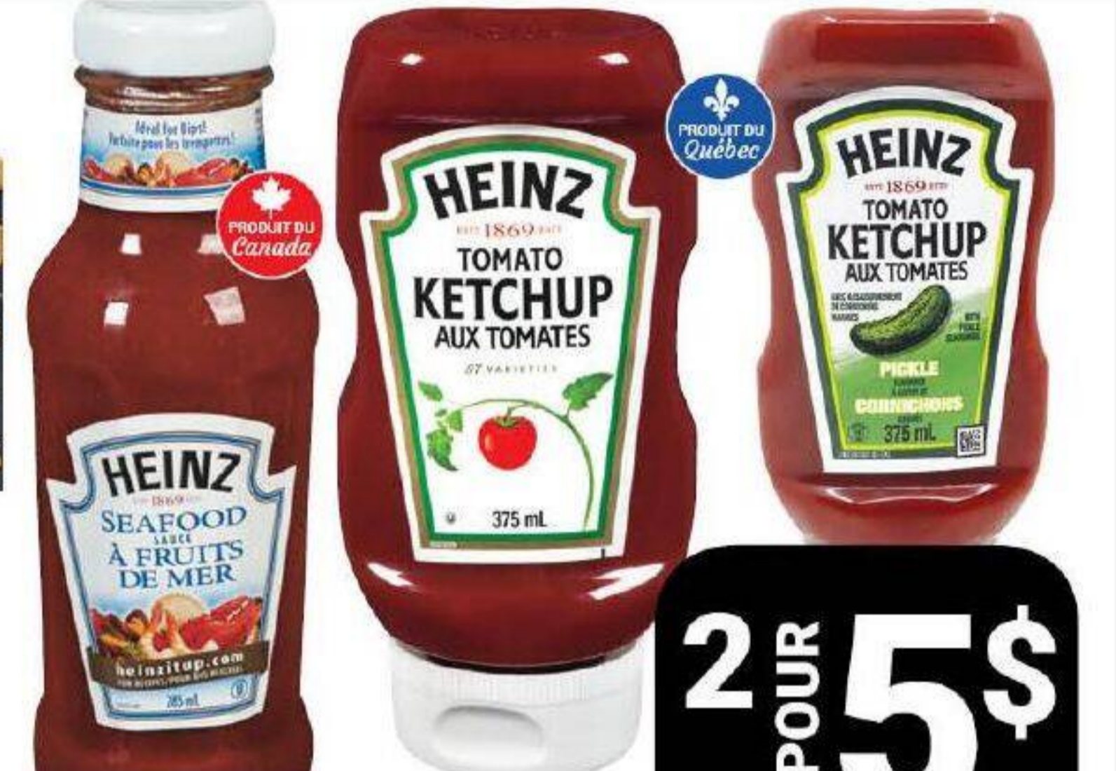
Ketchup régulier ou aux cornichons 375ml ou Sauce à fruits de mer 285ml «Heinz»