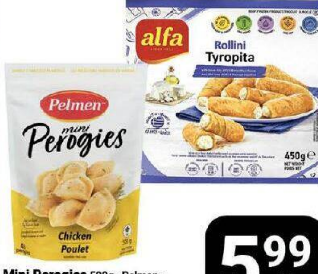
Mini Perogies 500g «Pelmen», Rollini ou Mini puffs «Alfa» 450g