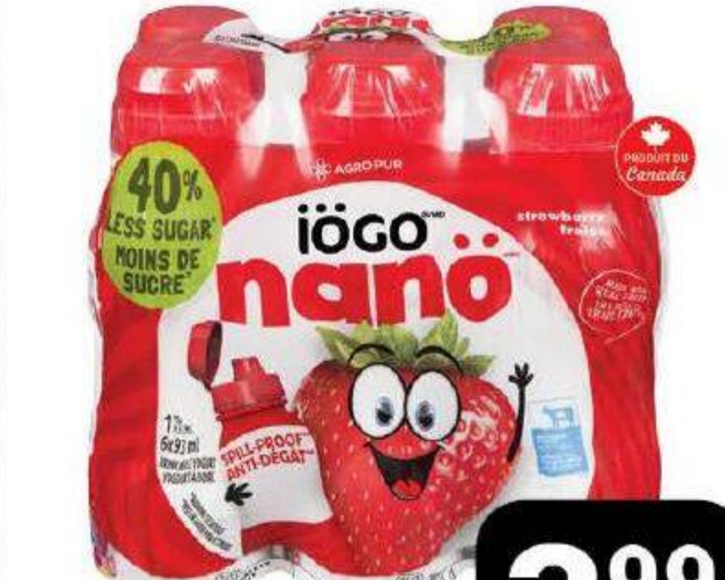
Yogourt à boire Nanö «iögo» 6 x 93ml