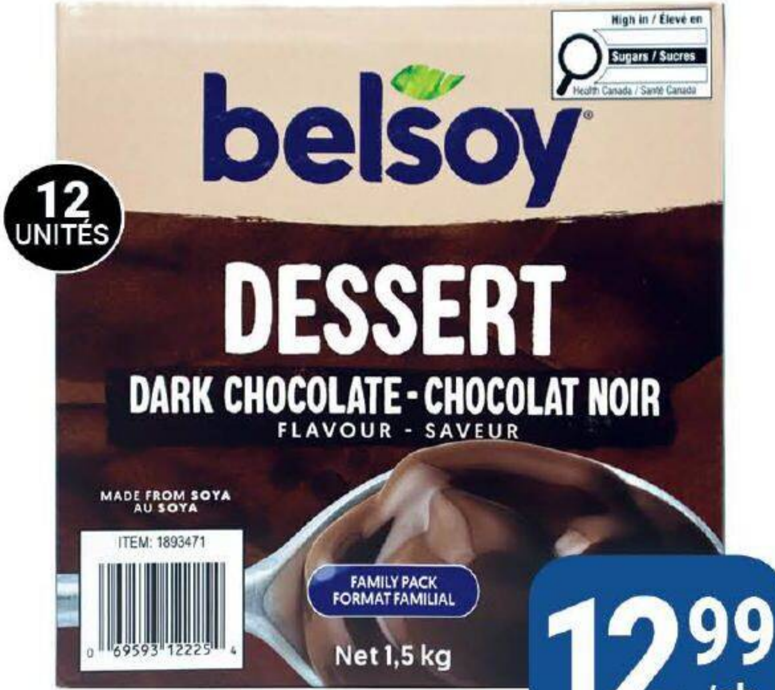
Dessert à saveur de chocolat noir «Belsoy» 12 x 125g