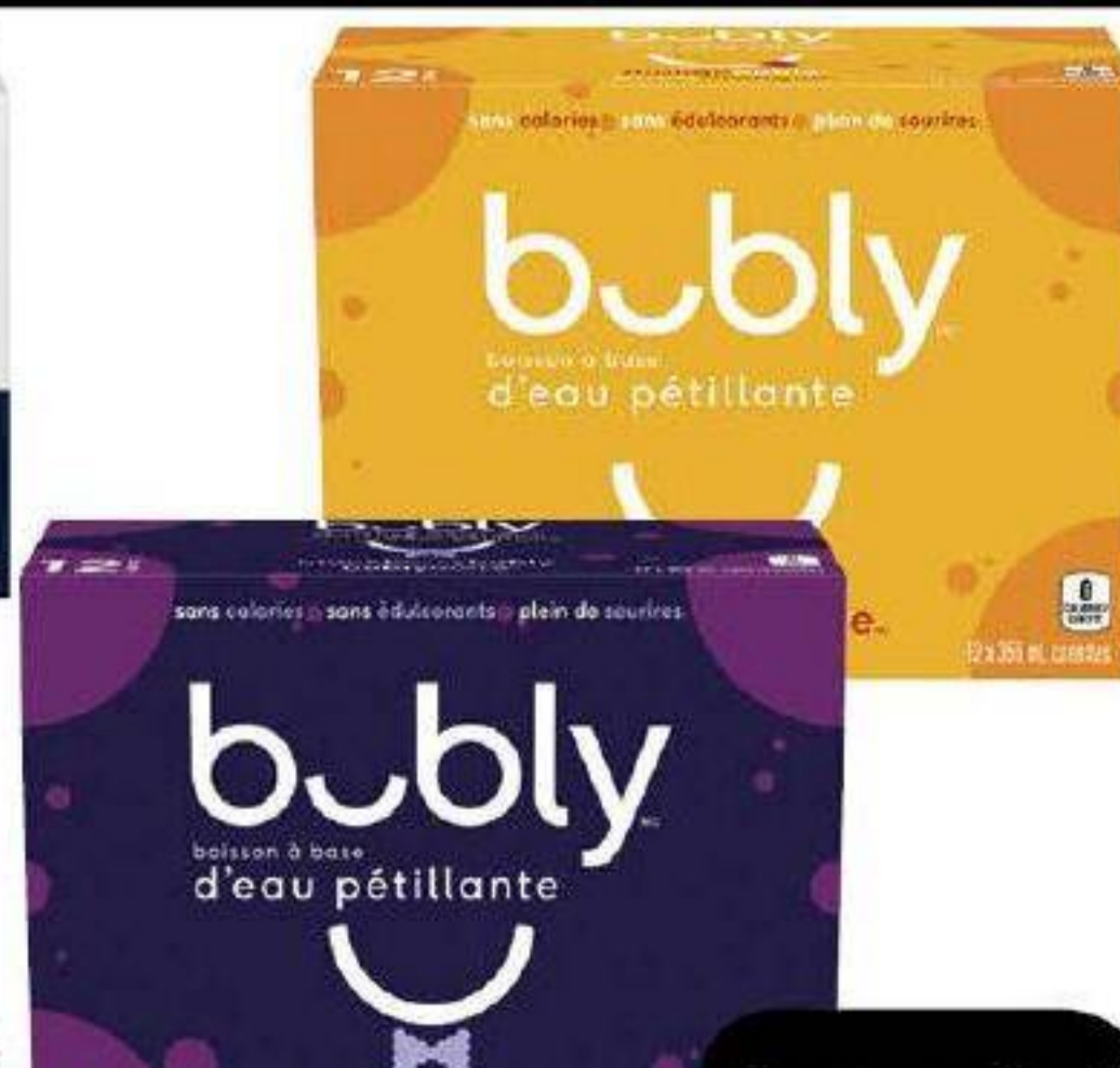
Eau gazeifiée «Bubly» 12 x 355ml * Canettes consignées