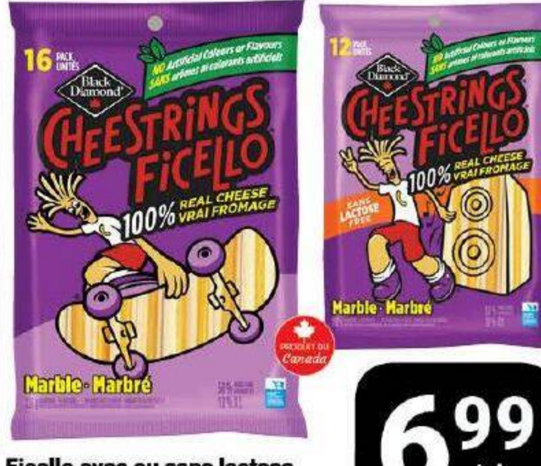
Ficello avec ou sans lactose «Black Diamond» 12 / 16 unités