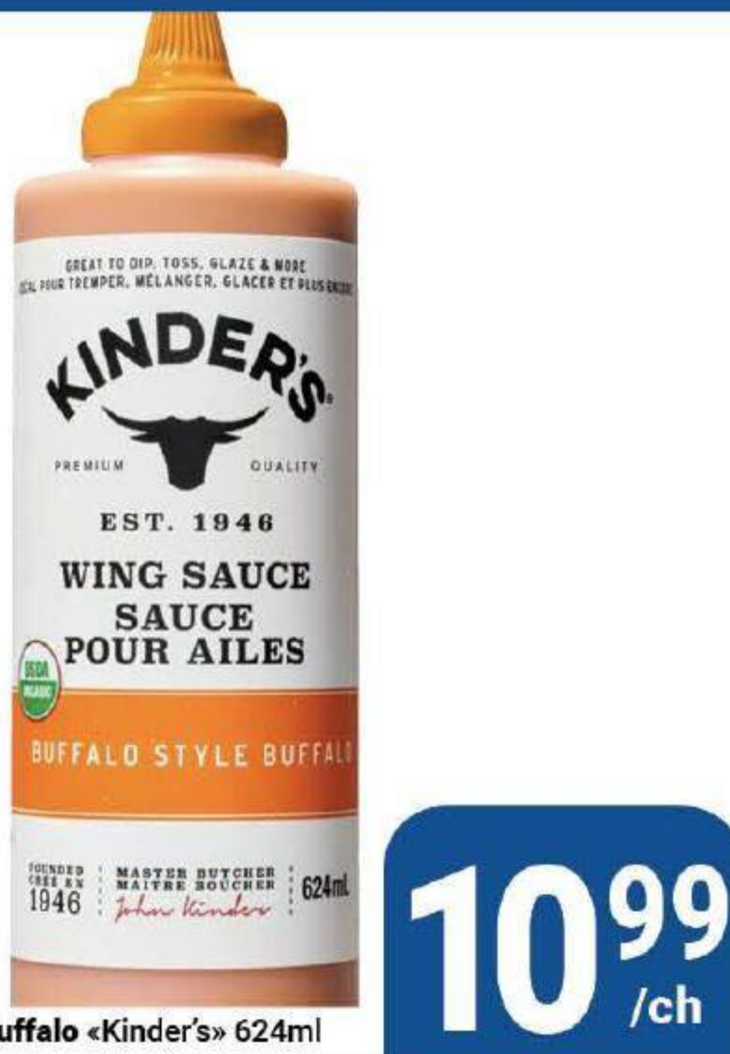
Sauce pour ailes style Buffalo «Kinder's» 624ml