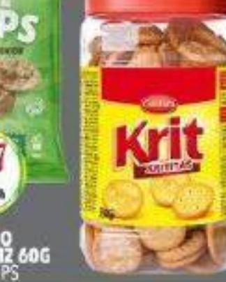
KRIT MINI CRAQUELINS 350G MINI CRACKERS