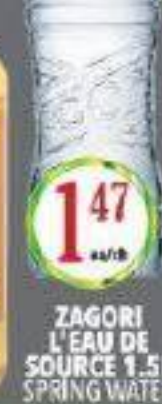
ZAGORI L'EAU DE SOURCE 1.5L SPRING WATER