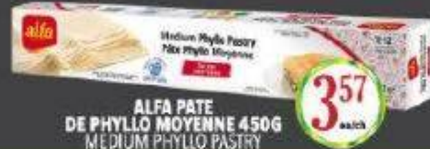
ALFA PATE DE PHYLLO MOYENNE 450G MEDIUM PHYLLO PASTRY