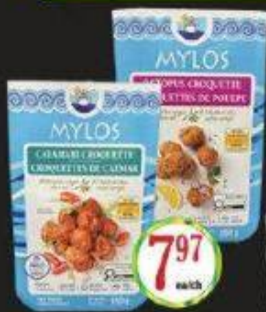
MYLOS CROQUETTES DE CALMAR ET AU POULPE 350G CALAMARI & OCTOPUS CROQUETTE