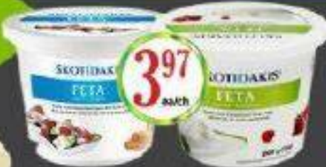
SKOTIDAKIS FROMAGE FETA 200G FETA CHEESE