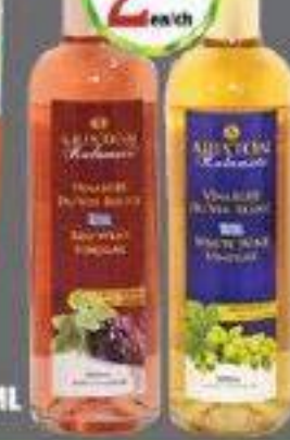
ARISTON VINAIGRES DE VIN BLANC ET ROUGE 500ML RED & WHITE WINE VINEGARS