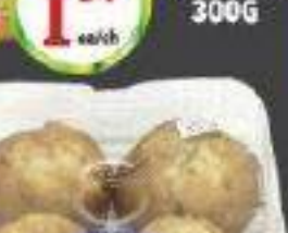
SAMI MUFFINS 4UN