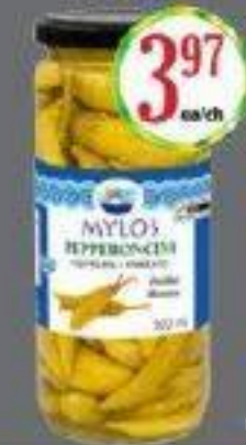
MYLOS POIVRONS VERTS MARINES 500ML "PEPPEROCINI" GREEN PICKLED PEPPERS