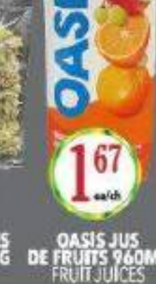
OASIS JUS DE FRUITS 960ML FRUIT JUICES