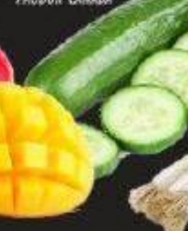
CONCOMBRES ANGLAIS ENGLISH CUCUMBERS