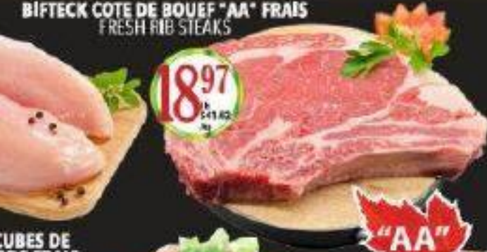
BIFTECK COTE DE BOUEF "AA" FRAIS FRESH RIB STEAKS