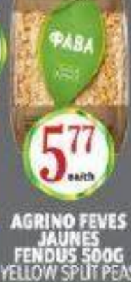
AGRINO FEVES JAUNES FENDUS 500G YELLOW SPLIT PEAS