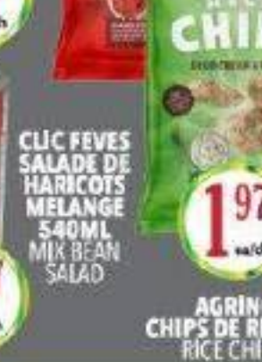
AGRINO RICE CHIPS