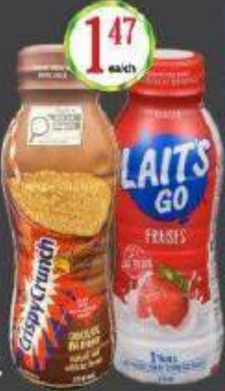
LAIT'S GO LAIT PARTIELLEMENT ECREME 310ML PARTLY SKIMMED MILK