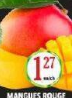
MANGUES ROUGE RED MANGOES