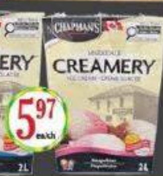
CHAPMANS CREME GLACE 2L ICE CREAM