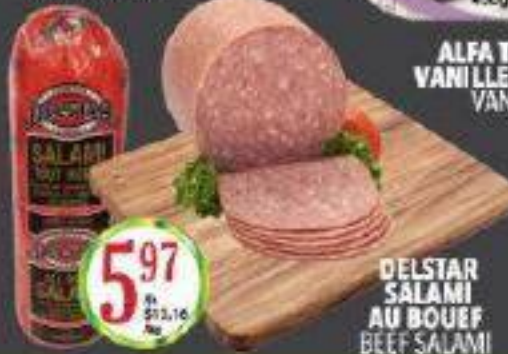
DELSTAR SALAMI AU BOUEF BEEF SALAMI