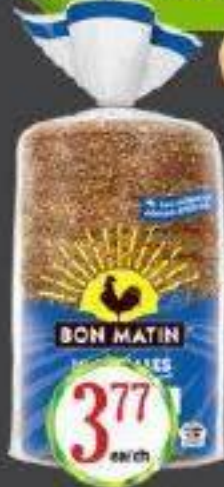
BON MATIN PAIN TRANCHE 595G SLICED BREAD