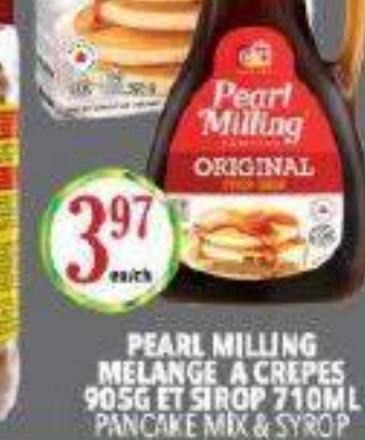
PEARL MILLING MELANGE A CREPES 905G ET SIROP 710ML PANCAKE MIX & SYROP