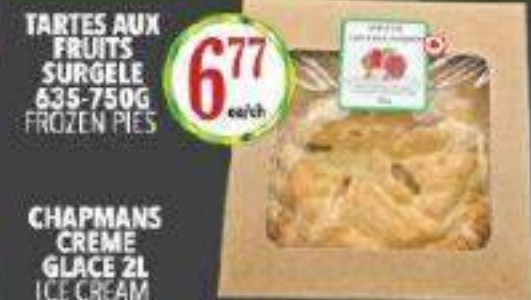
TARTES AUX FRUITS SURGELE 635-750G FROZEN PIES