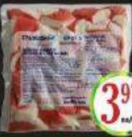
THALASSA IMITATION DE CHAIR DE CRABE 454G IMITATION CRAB MEAT