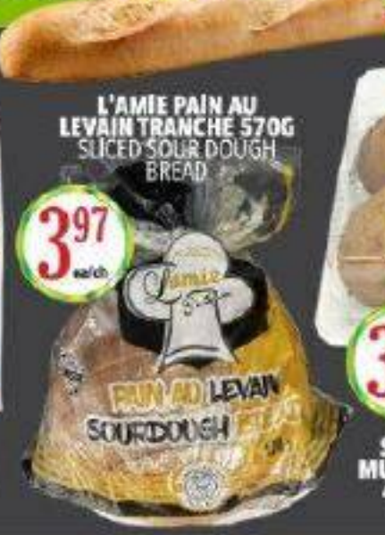
L'AMIE PAIN AU LEVAIN TRANCHE 570G SLICED SOUR DOUGH BREAD