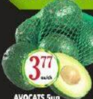
AVOCATS 5un AVOCADOS