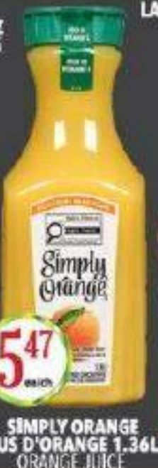
SIMPLY ORANGE JUS D'ORANGE 1.36L ORANGE JUICE