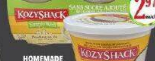
KOZYSHACK SANS SUCRE A LA PATE