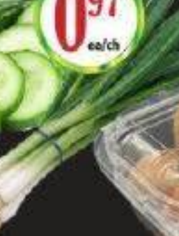
OIGNONS VERT GREEN ONIONS