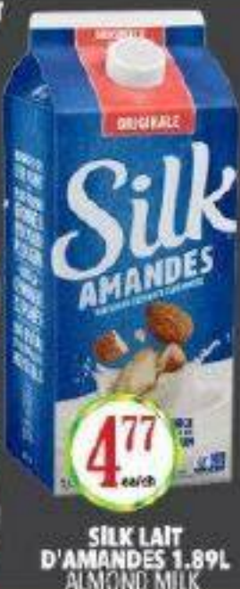
SILK LAIT D'AMANDES 1.89L ALMOND MILK