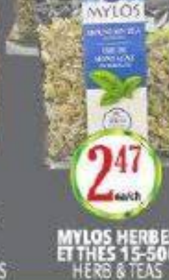
MYLOS HERBES ET THÉS 15-50G HERB & TEAS