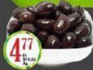
OLIVES KALAMATA JUMBO