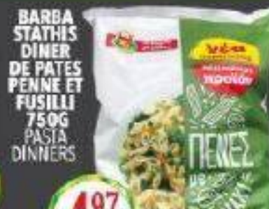
BARBA STATHIS DINNER DE PATES PENNE ET FUSILLI 750G PASTA DINNERS