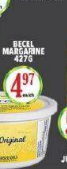
BECEL MARGARINE 427G