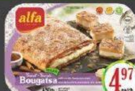
ALFA TARTE A LA CREME VANILLE 450G "BOUGATSA" VANILLA CREAM PIE