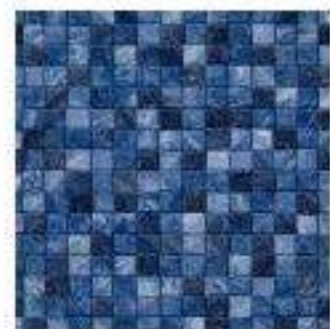
TOILE CUBIC LINER