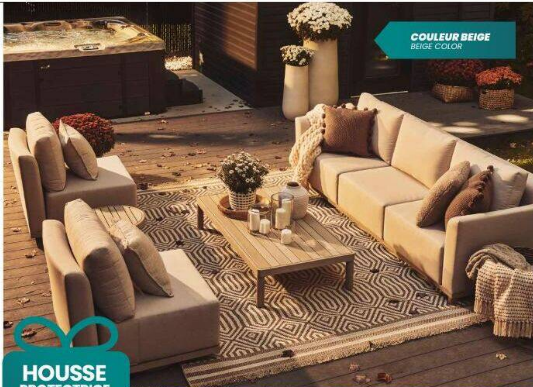
COULEUR BEIGE BEIGE COLOR

HOUSSE PROTECTRICE GRATUITE VALEUR DE 300$ FREE PROTECTIVE COVER $300 VALUE