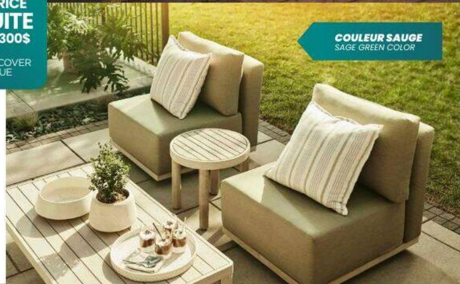
COULEUR SAUGE SAGE GREEN COLOR