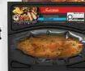
poitrine de poulet marinée BBQ Irrésistible 225 g Irrésistible BBQ marinated chicken breast reg. 6,49