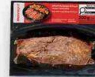
bifteck de hampe mexicain 200 g