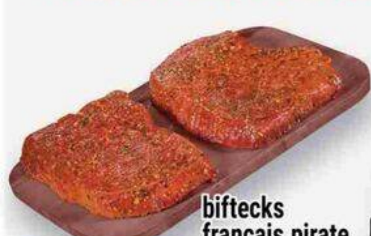
biftecks français pirate format économique pirate french style steaks, economic pack 28,64/kg reg. 13,69/lb - 30,18/kg