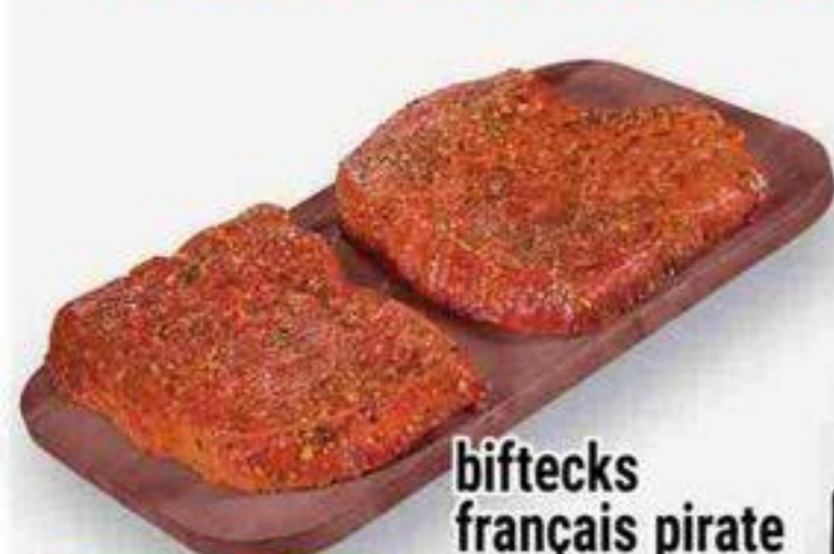
biftecks français pirate format économique pirate french style steaks, economic pack 28,64/kg reg. 13,69/lb - 30,18/kg