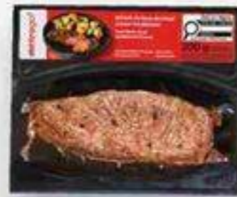
bifteck de flanc steak house 200 g