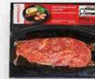
onglet boeuf thai 200 g