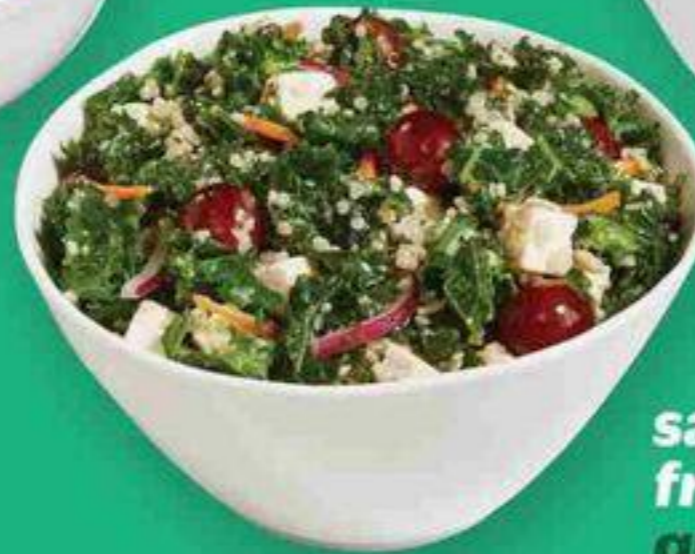
salade chou frisé, feta et quinoa