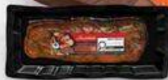
filet de porc irrésistible 550 g, choix varié Irrésistible pork tenderloin reg. 8,99