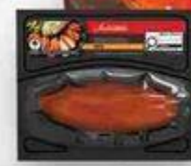
poitrine de poulet marinée BBQ irrésistible 225 g Irrésistible BBQ marinated chicken breast reg. 6,49