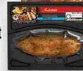
poitrine de poulet marinée souvlaki irrésistible 225 g Irrésistible souvlaki marinated chicken breast reg. 6,49