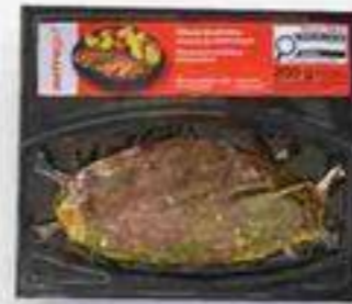
picanha chimichurri 200 g