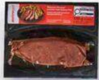
macreuse boeuf Kansas 170 g