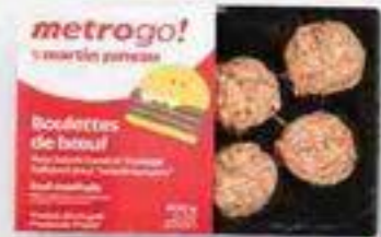
smash burger 6 X 100 g