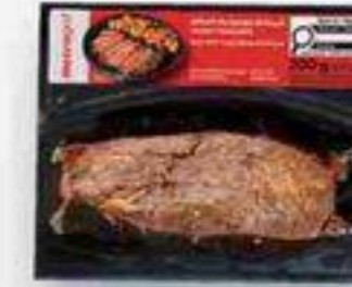
bifteck de hampe mexicain 200 g