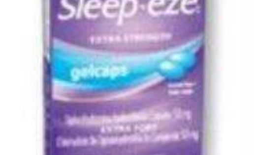
SLEEP-EZE ou NYTOL Produits sélectionnés Selected products