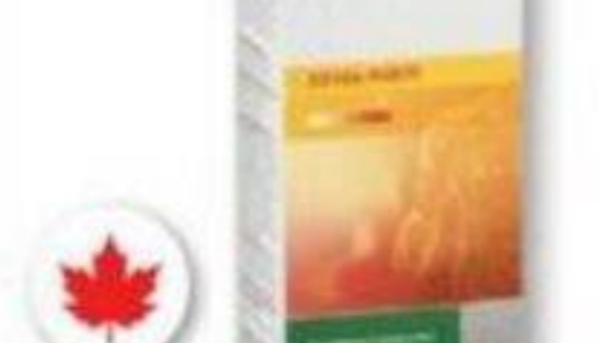
BIOMEDIC Crème analgésique, crème antidouleur ou gel analgésique/gel/Heating cream, pain relief cream or pain relief ice gel, formats sélectionnés/selected sizes