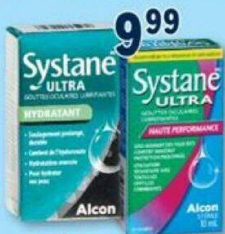
SYSTANE Gouttes oculaires lubrifiantes sélectionnées Selected lubricant eye drops