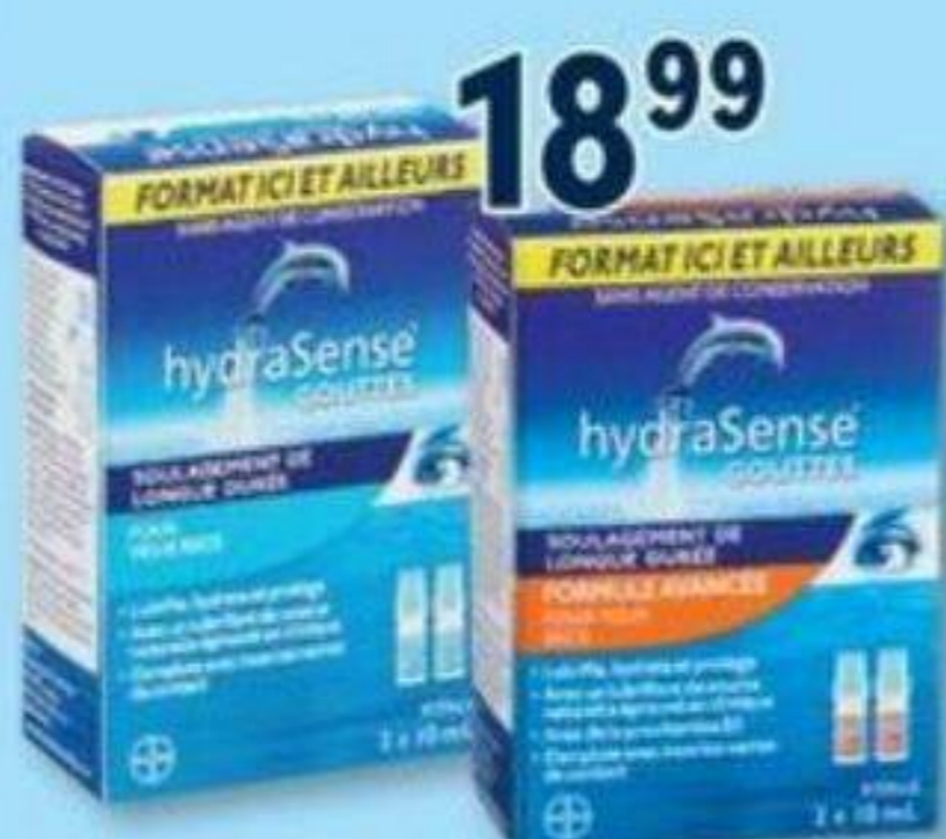
HYDRASENSE Gouttes pour les yeux Eye drops, 2 x 10 ml