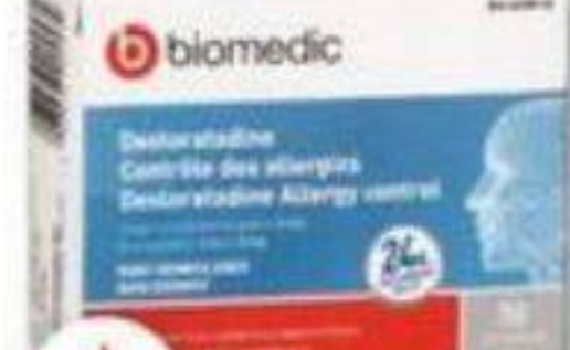
BIOMEDIC Desloratadine, Contrôle des allergies Allergy control, 5 mg, 30 comprimés/tablets