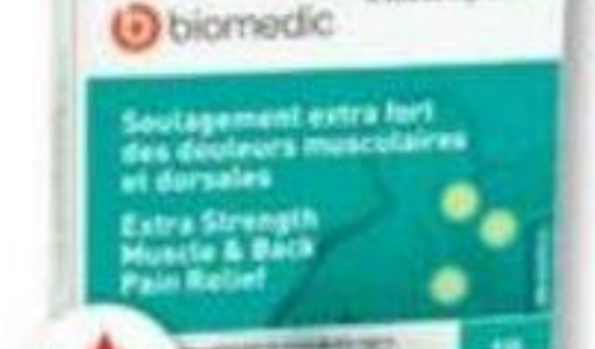
BIOMEDIC Soulagement des douleurs musculaires et dorsales/Muscle and back pain relief, 18 caplets