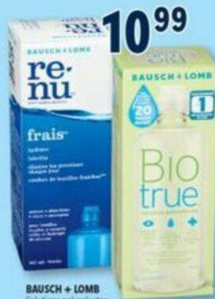
BAUSCH + LOMB Solutions polyvalentes sélectionnées/Selected multi-purpose solutions