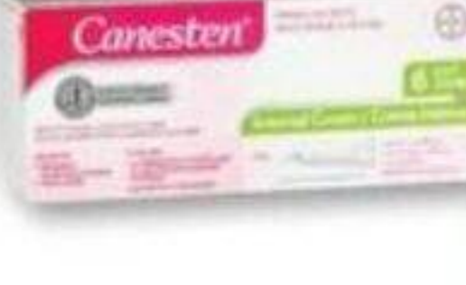
CANESTEN Traitements/traitement, Produits sélectionnés Selected products