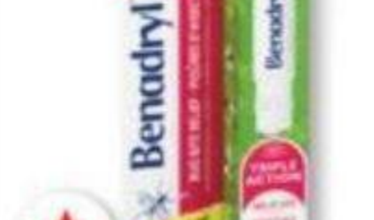
BENADRYL Produits sélectionnés Selected products