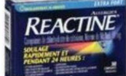
REACTINE Produits sélectionnés/Selected products