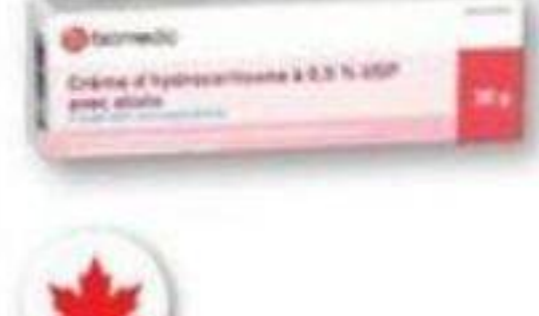
BIOMEDIC Crème d'hydrocortisone à 0,5 % USP avec aloe/Hydrocortisone cream 0.5 USP with aloe, 30 g