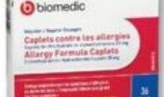
BIOMEDIC Allergies/Allergy, 75 mg, 36 caplets