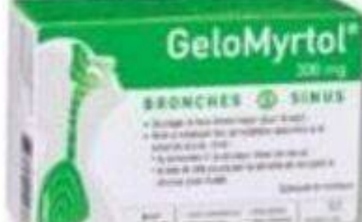
GELOMYRTOL Bronches et sinus/Bronchi and sinuses, 300 mg, 30 capsules