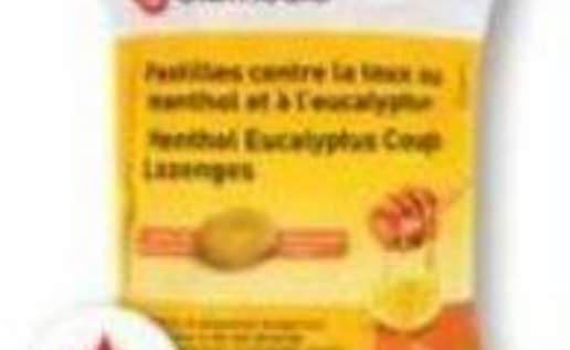
BIOMEDIC Pastilles contre la toux/Cough lozenges, 30 unités/unités