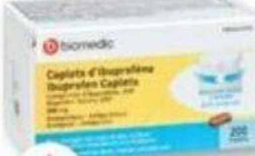
BIOMEDIC Ibuprofène/Ibuprofen, 200 mg, 200 caplets