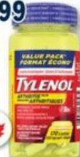
TYLENOL Douleurs arthritiques/Arthritis pain, 650 mg, 170 caplets