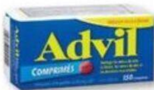
ADVIL Ibuprofène/Ibuprofen, 200 mg, 150 comprimés/tablets