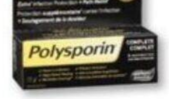
POLYSPORIN Produits sélectionnés Selected products