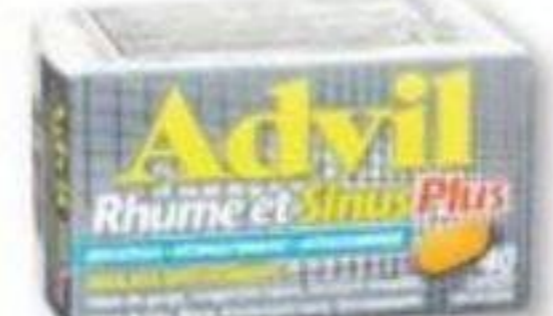
ADVIL Rhume et sinus/Cold and sinus ou Grippe/Flu, produits sélectionnés selected products, 36 ou 40 unités/unités