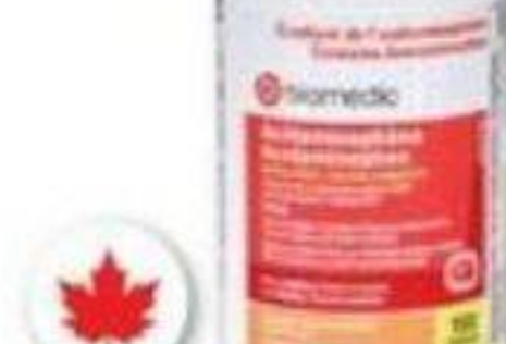
BIOMEDIC Acétaminophène/Acetaminophen, 500 mg, 150 comprimés/tablets, 150 caplets ou 80 gélcaps à action rapide/80 rapid action gelcaps