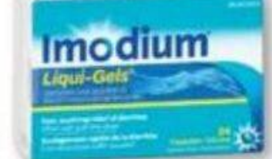
IMODIUM Produits sélectionnés Selected products