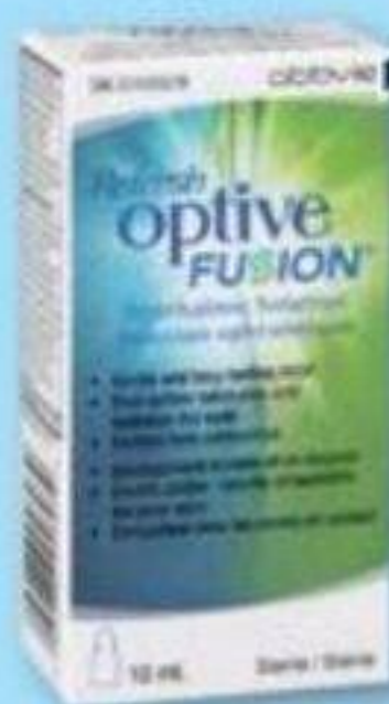
REFRESH Gouttes oculaires lubrifiantes sélectionnées Selected lubricant eye drops, 10 ml, 15 ml ou 30 x 0.4 ml