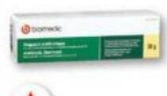
BIOMEDIC Onguent antibiotique Antibiotic ointment, 30 g