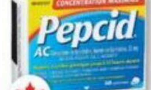
PEPCID AC ou PEPCID COMPLET Soulage les brûlures d'estomac Relieves heartburn, 50 unités/unités