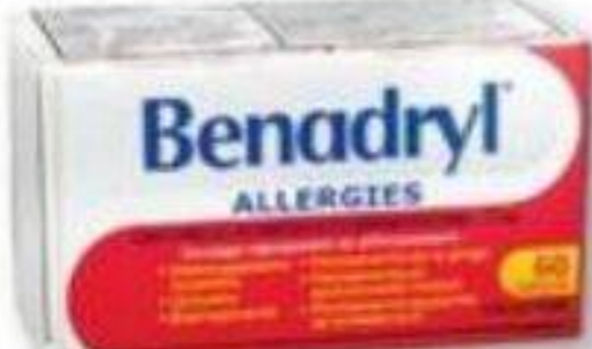
BENADRYL ou REACTINE Produits sélectionnés/Selected products