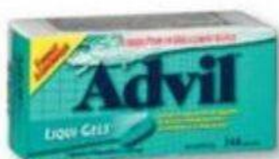
ADVIL Ibuprofène/Ibuprofen, 200 mg, 144 capsules ou 250 comprimés/tablets