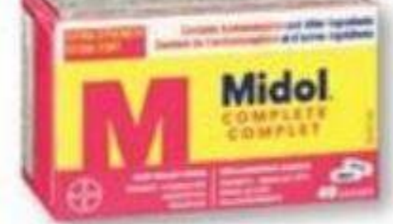
MIDOL Complexe ou SPM Complexe or PMS, 40 caplets