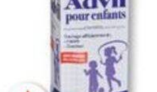
ADVIL Ibuprofène/Ibuprofen, Pour enfants/Children, 230 ml ou 40 Junior, 40 comprimés/tablets