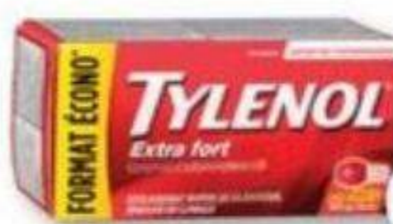
TYLENOL Acétaminophène/Acetaminophen, 500 mg, 200 comprimés/tablets, 200 caplets ou 120 gélules/gelcaps