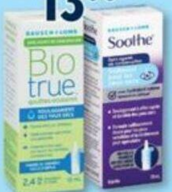
BAUSCH + LOMB Gouttes oculaires sélectionnées Selected eye drops, 10 ml ou 30 x 0.5 ml