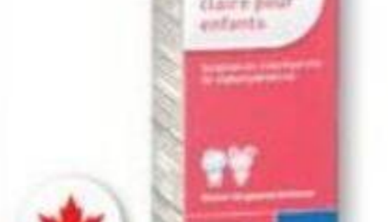
BIOMEDIC Formule d'allergie claire pour enfants ou Formule anti-allergique/Children's clear allergy formula or Allergy formula, 115 ml