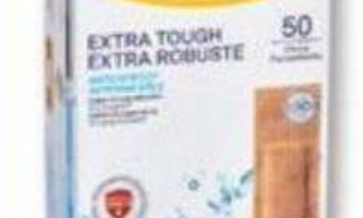
ELASTOPLAST Pansements extra robustes imperméables Extra tough waterproof bandages, 50 unités/unités