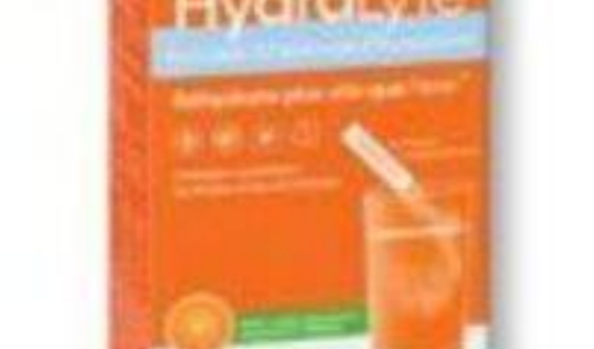
HYDRALYTE Poudre d'électrolyte/Electrolyte powder, 12 x 6 g ou 10 x 6,2 g