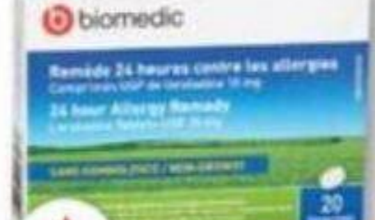
BIOMEDIC Loratadine, Allergies/Allergy, 10 mg, 20 comprimés/tablets