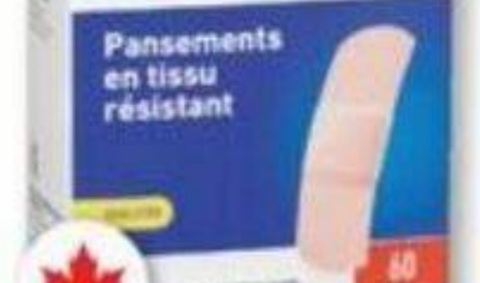
BIOMEDIC Pansements en tissu résistant Strong fabric bandages, 60 unités/unités