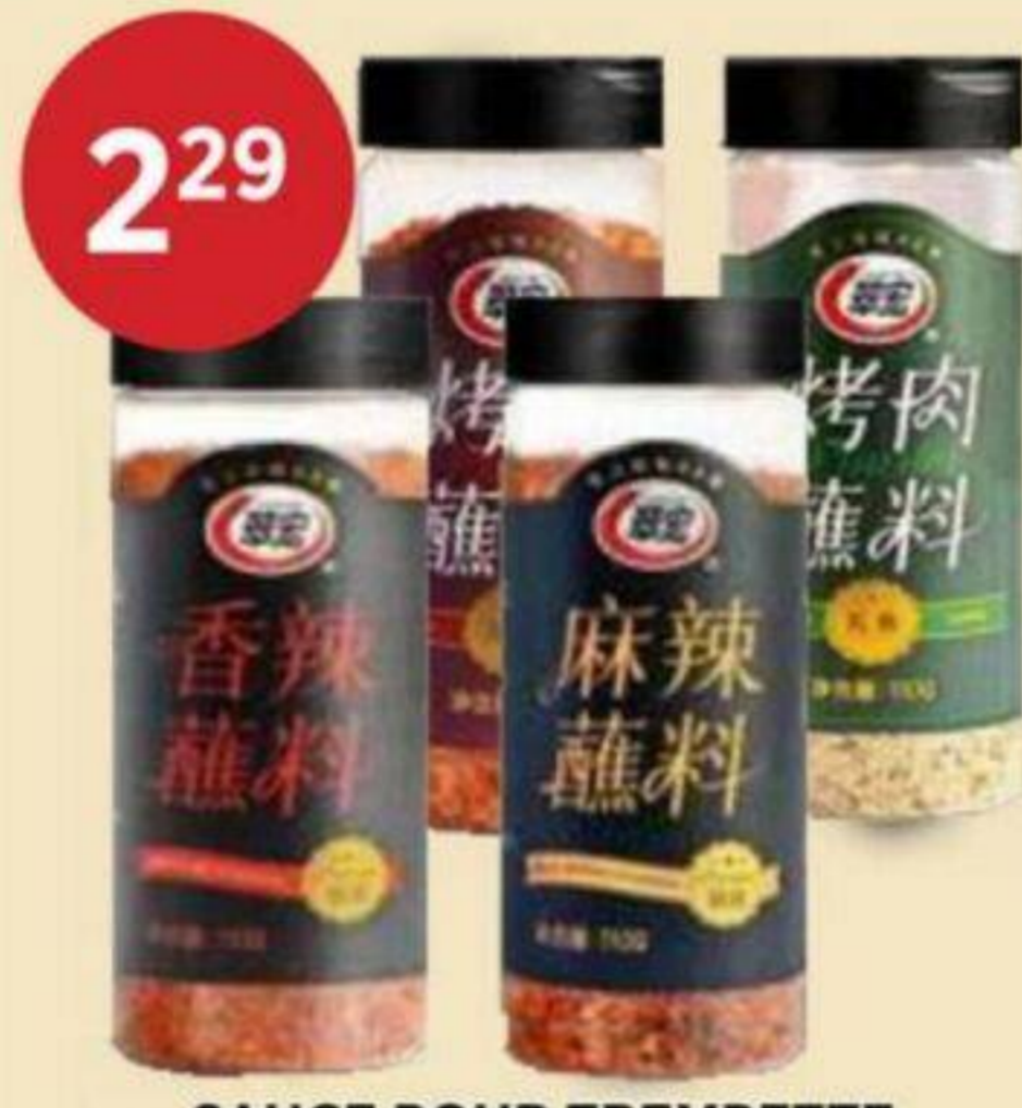
2 29 SAUCE POUR TREMPETTE (VARIÉTÉS MULTIPLES) CUI HONG 110 G DIPPING SAUCE (MULTIPLE VARIETIES) 蘸醬 (多種選擇) RÉG. 2,99