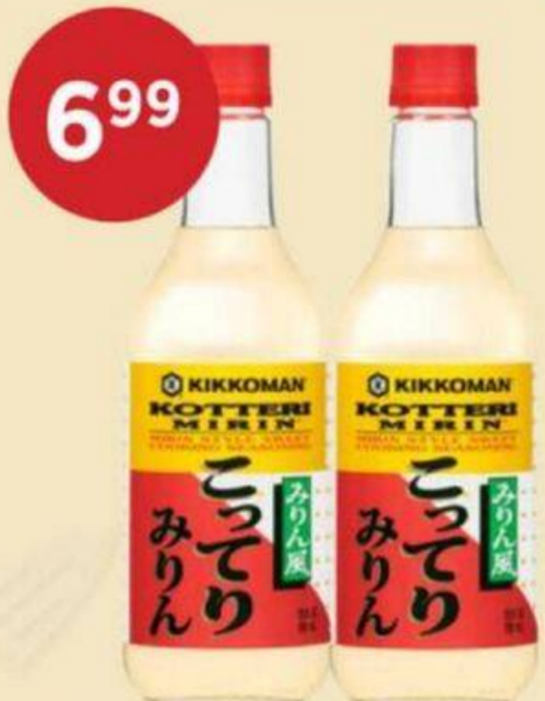
6 99 SAUCE KOTTERI AU MIRIN KIKKOMAN 591 ML KOTTERI MIRIN SAUCE 濃厚味淋醬 (KOTTERI)風味 RÉG. 8,49