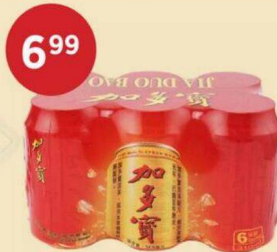
6 99 BOISSONS AU THÉ JIADUOBAO 6 X 310 ML TEA DRINKS 加多寶 RÉG. 8,99