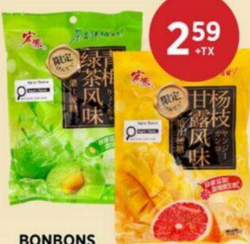
2 59 +TX BONBONS (VARIÉTÉS MULTIPLES) HONGYUAN 300 G CANDIES (MULTIPLE VARIETIES) 糖果 (多種口味) RÉG. 3,59 + TX