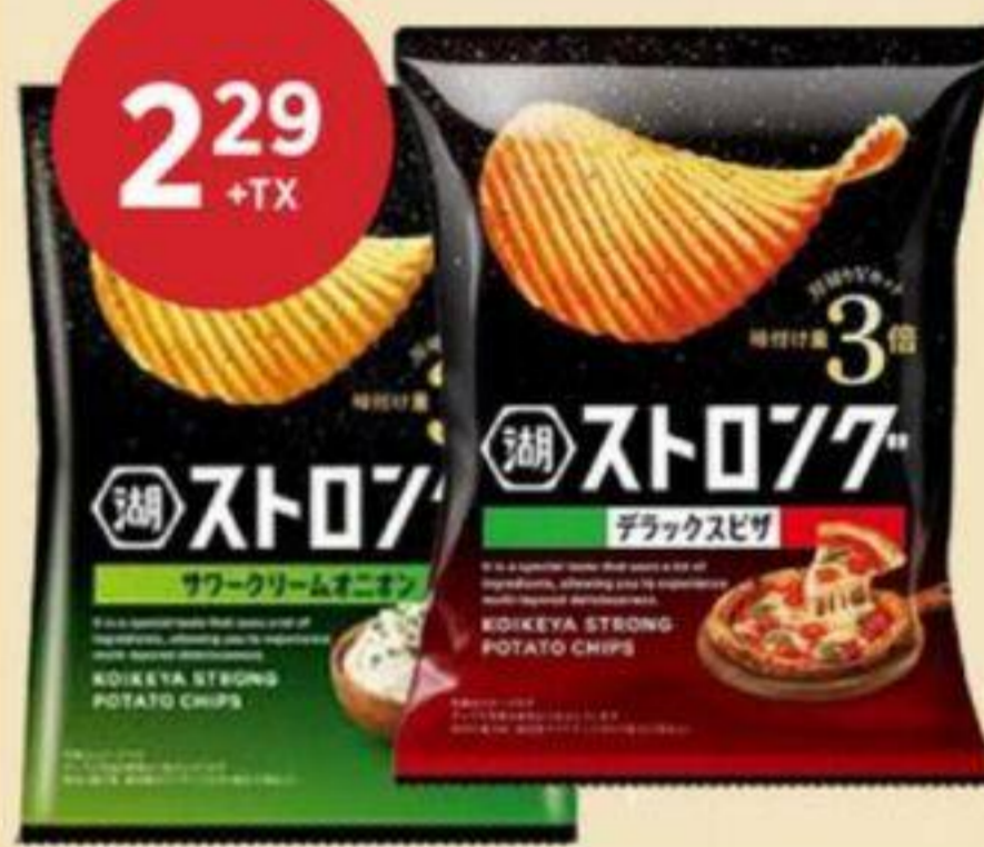
2 29 +TX CROUSTILLES (VARIÉTÉS MULTIPLES) KOIKEYA 53 G CRISPS (MULTIPLE VARIETIES) 薯片 (多種口味) RÉG. 3,49 + TX