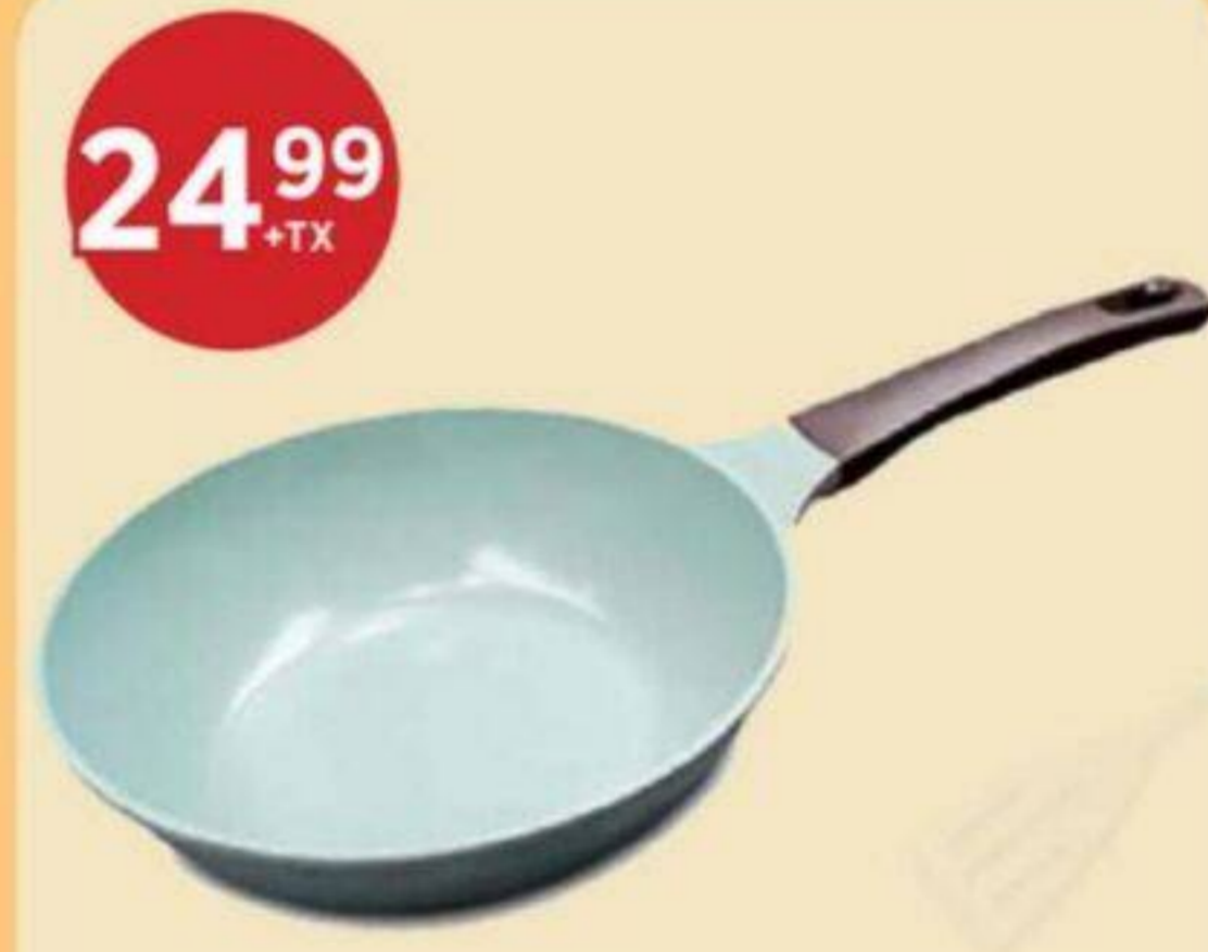
24 99 +TX POÊLE EN CÉRAMIQUE JADE AL 30 CM CERAMIC PAN 陶瓷平底鍋 30 cm RÉG. 29,99/CH + TX