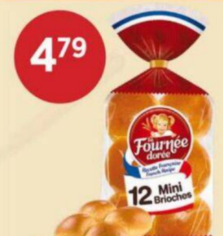
4 79 MINI BRIOCHES NATURE LA FOURNÉE DORÉE 480 G MINI BRIOCHES 迷你麵包 RÉG. 5,29