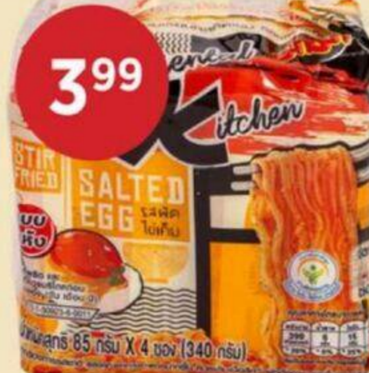
3 99 NOUILLES INSTANTANÉES SAUTÉES SAVEUR ŒUF SALÉ MAMA 340 G INSTANT STIR-FRIED NOODLES SALTED EGG FLAVOR 即食炒麵(鹹蛋風味) RÉG. 4,99