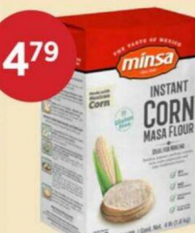
4 79 FARINE DE MAÏS INSTANTANÉE MINSA 1,8 KG INSTANT CORN FLOUR 即食玉米餅專用粉 RÉG. 5,49