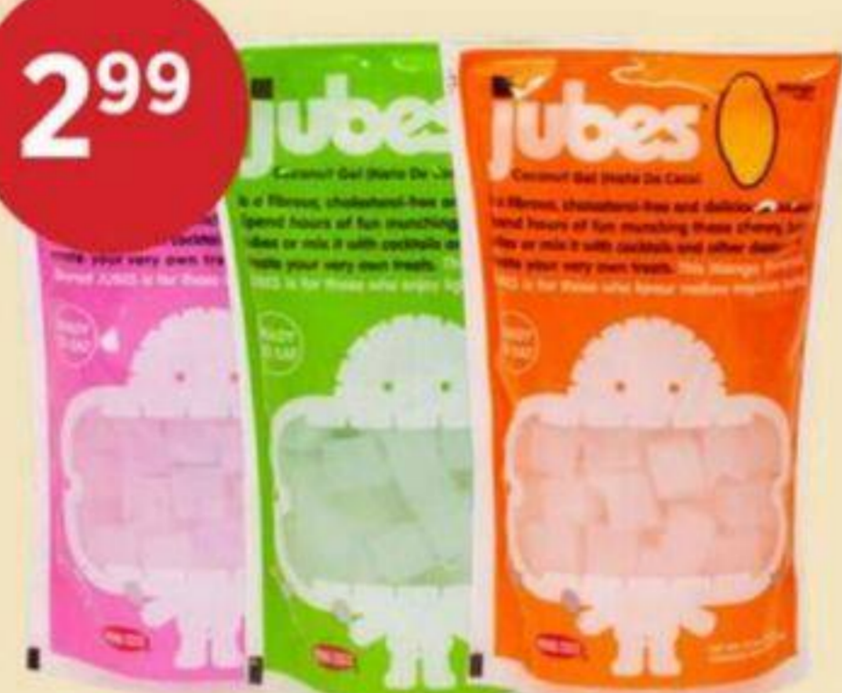
2 99 NATA DE COCO (VARIÉTÉS MULTIPLES) SAMURAI 180 G COCONUT JELLY (MULTIPLE VARIETIES) 椰果 (多種口味) RÉG. 3,99