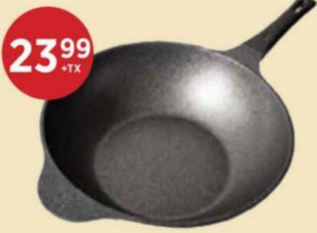
23 99 +TX WOK CORÉEN PANTASTIC 28 CM PANTASTIC 28 CM KOREAN NONSTICK WOK 韓式不沾炒鍋 28cm RÉG. 28,99/CH + TX

Du Jeudi 21 mai au Mercredi 27 mai 2026 From Thursday May 21 to Wednesday May 27 2026 從2026年5月21號週四到5月27號週三結束