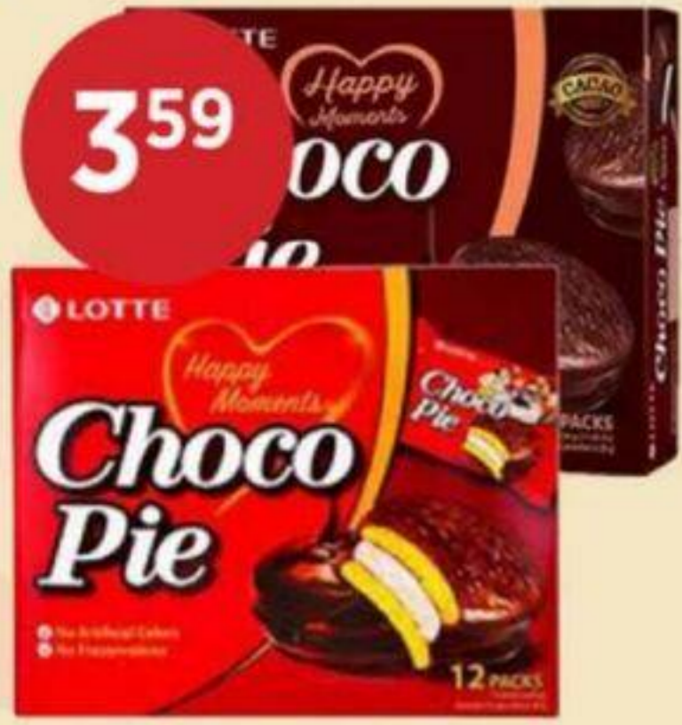
3 59 GÂTEAU AU CHOCOLAT (VARIÉTÉS MULTIPLES) LOTTE 336 G CHOCOLATE CAKE (MULTIPLE VARIETIES) 巧克力蛋糕 (多種口味) RÉG. 4,99