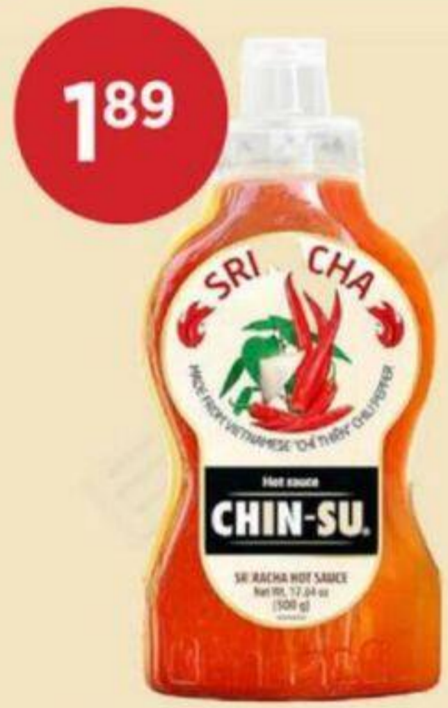
1 89 SAUCE DE PIMENT CHINSU 235 ML CHILI SAUCE 辣椒醬 RÉG. 2,69