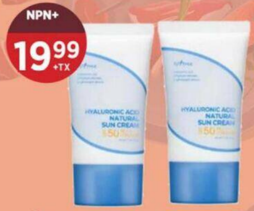
19 99 +TX CRÈME SOLAIRE - NATUREL À L'ACIDE HYALURONIQUE ISNTREE 50 ML HYALURONIC ACID NATURAL SUNSCREEN 玻尿酸天然防曬霜 RÉG. 26,99 +TX