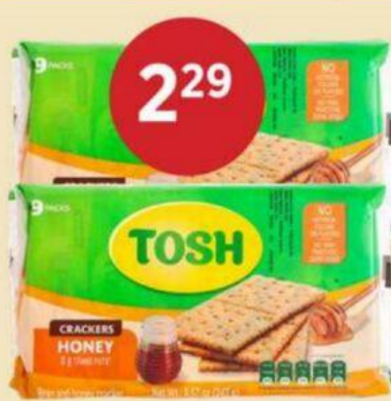
2 29 CRAQUELIN TOSH AU MIEL TOSH 243 G TOSH HONEY CRACKERS Tosh 蜂蜜脆餅 RÉG. 2,99