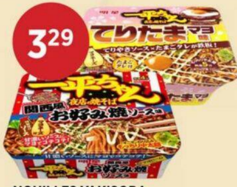
3 29 NOUILLES YAKISOBA INSTANTANÉES (VARIÉTÉS MULTIPLES) MYOJO 112 G - 122 G INSTANT YAKISOBA NOODLES (MULTIPLE VARIETIES) 即食日式炒麵 (多種口味) RÉG. 3,99