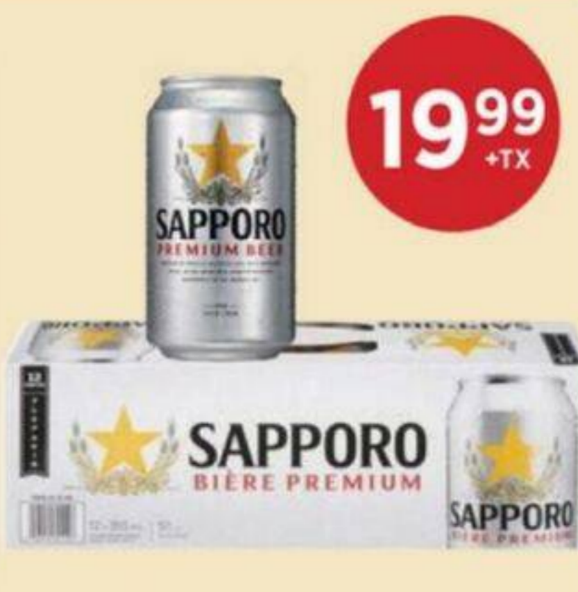
19 99 +TX BIÈRE PREMIUM SAPPORO 12 X 355 ML PREMIUM BEER 精釀啤酒 RÉG. 25,99/CH +TX