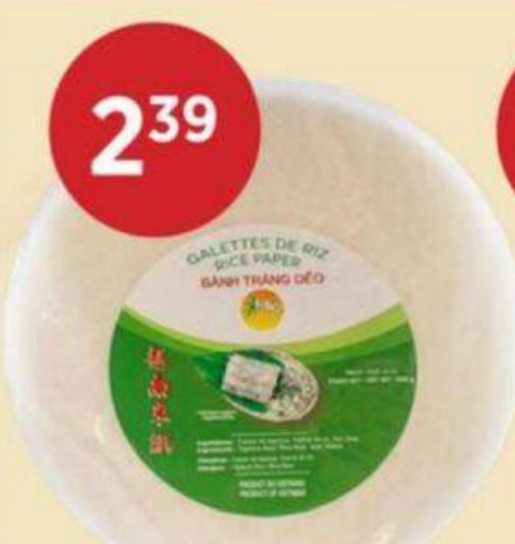
2 39 GALETTES DE RIZ MR 340 G - 31 CM RICE PAPER WRAPPERS 米紙 (春捲皮) RÉG. 2,99