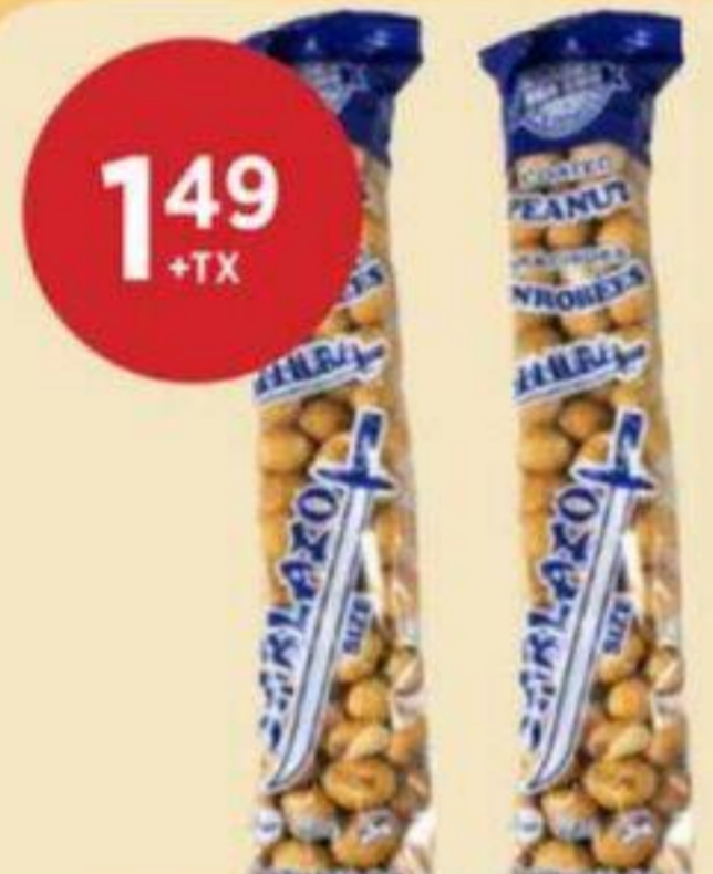
1 49 +TX ARACHIDES JAPONAISES SABLAZO SAMURAI 180 G SABLAZO JAPANESE PEANUTS Sablazo 日式花生 RÉG. 1,99 + TX