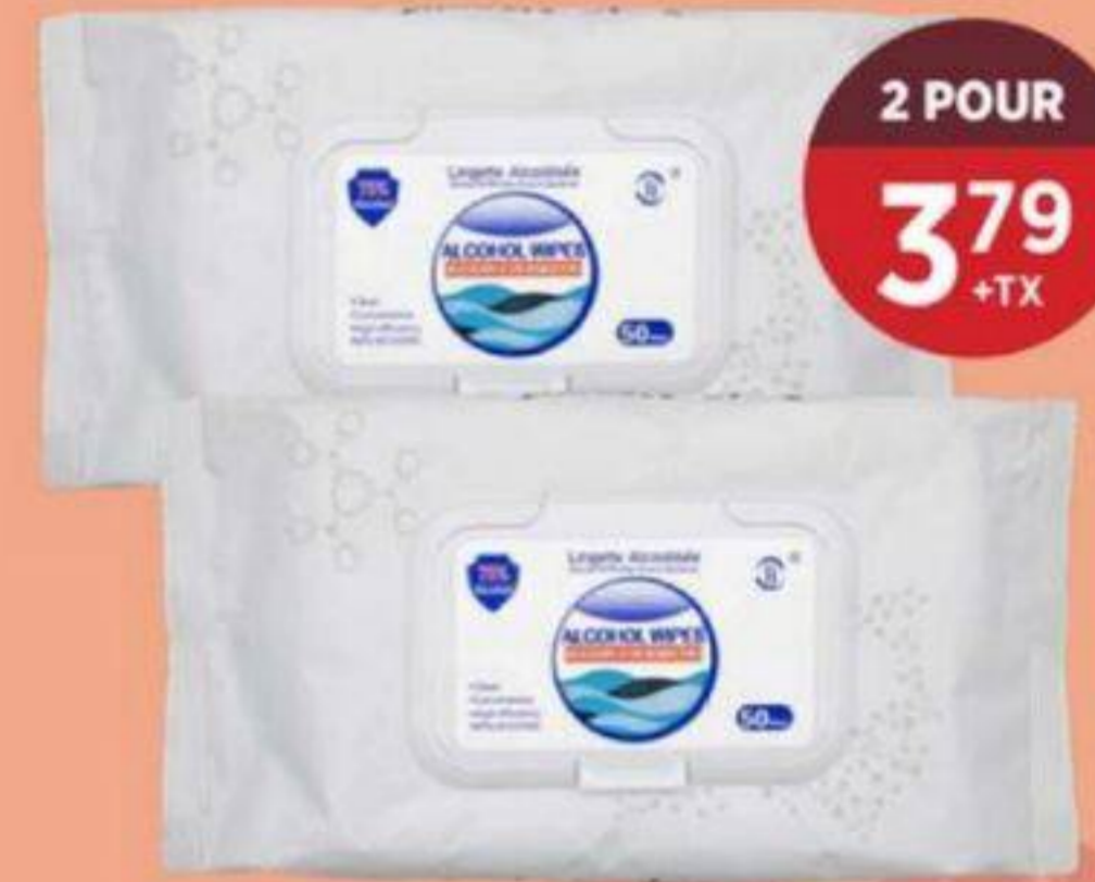
2 POUR 3 79 +TX LINGETTE ALCOOL 75 % JJX 50 PCS 2,29/CH +TX 75% ALCOHOL WIPE 酒精濕巾 (便攜裝) RÉG. 2,99/CH +TX