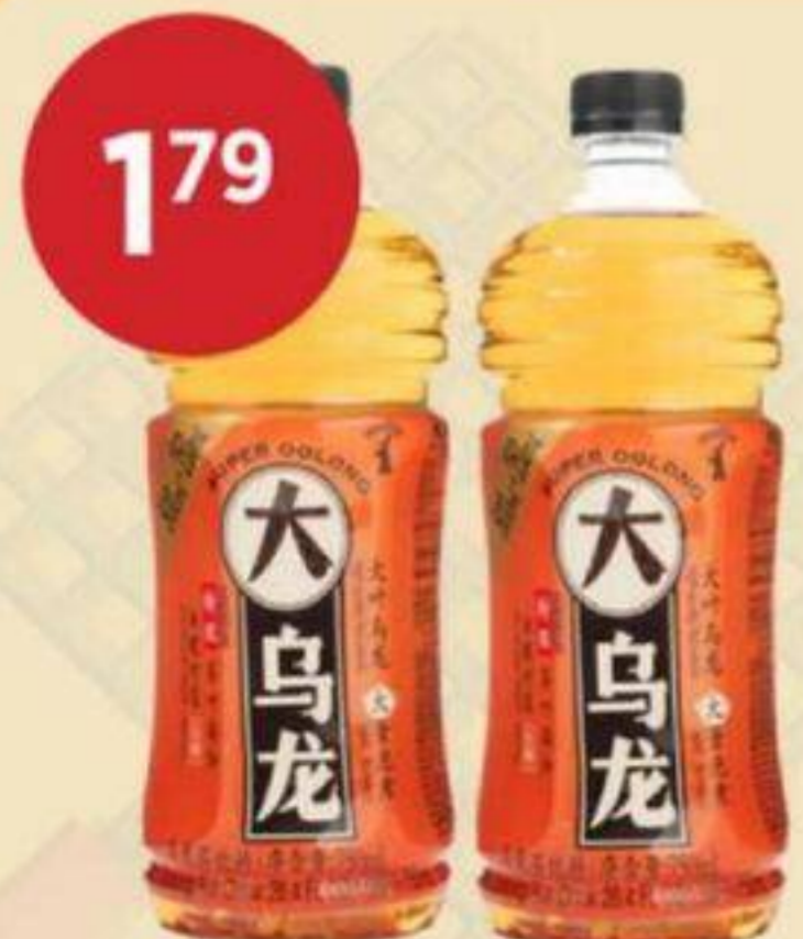
1 79 SUPER THÉ OOLONG METAVITA 750 ML SUPER OOLONG TEA 烏龍茶 RÉG. 2,29