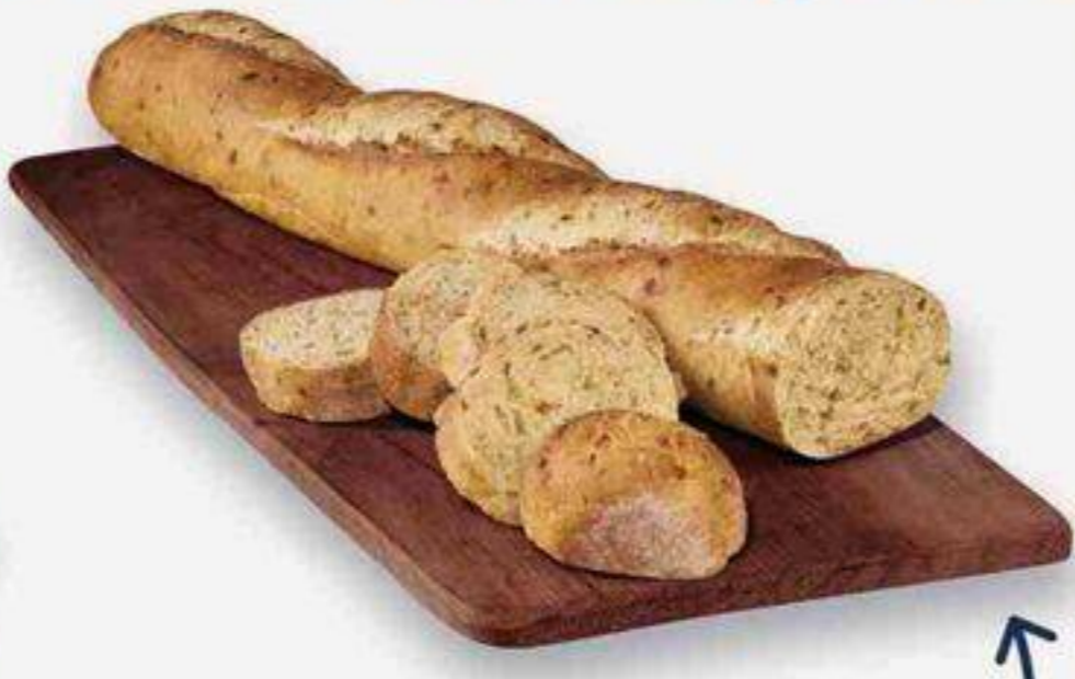
tomates séchées assaisonnées