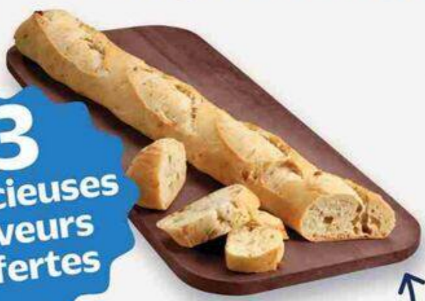
figues et miel