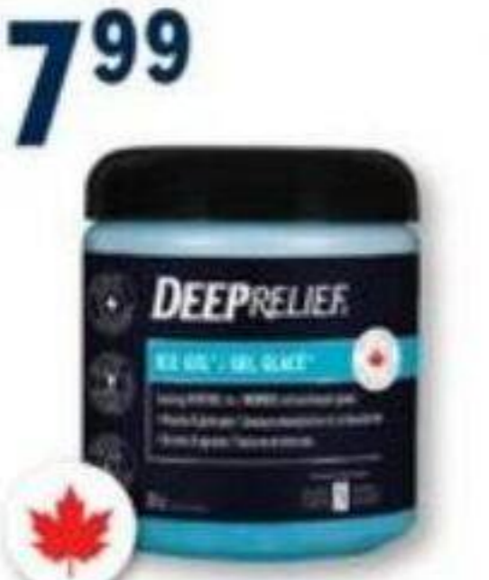
DEEP RELIEF Produits sélectionnés Selected products