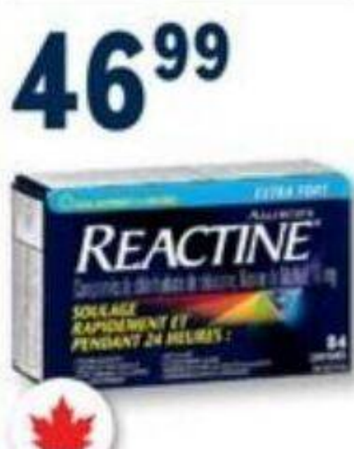
REACTINE Allergies/Allergy, 10 mg, 84 comprimés/tablets