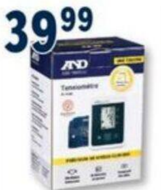
A&D MEDICAL Line Touch/One Touch, Tensiomètre Blood pressure monitor, modèle/model UA-660CN