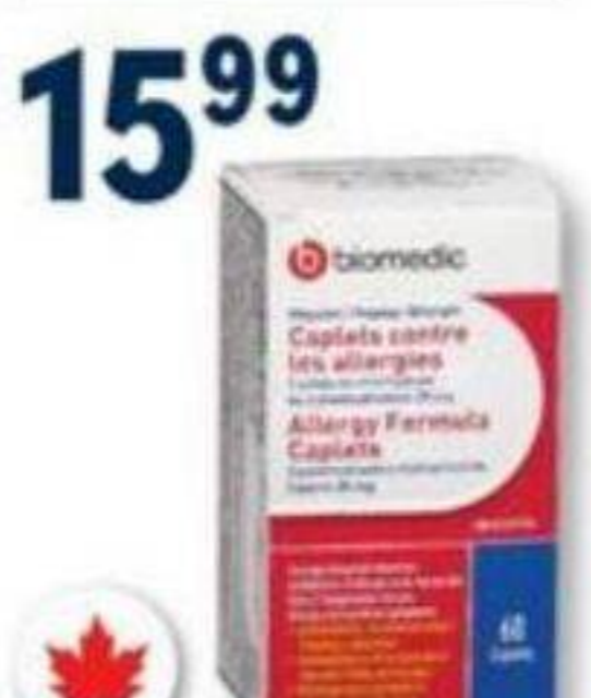
BIOMEDIC Allergies/Allergy, 25 mg, 60 caplets