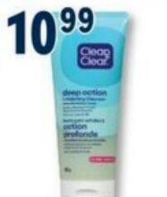
CLEAN & CLEAR Acné et soins de la peau/Acne and skin care, produits sélectionnés/selected products