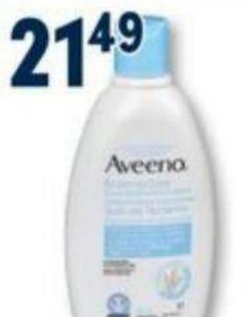
AVEENO Soin de l'épiderme/Epiderm care, Crème hydratante/Moisturizing cream, 330 ml