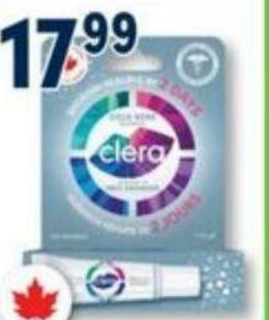
CLERA Traitement des feux sauvages Gold soot treatment, 5 ml