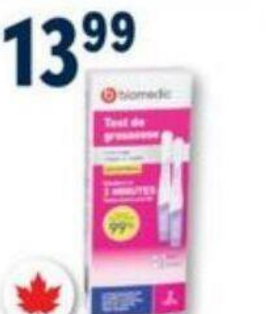
BIOMEDIC Test de grossesse/Pregnancy test, résultat précoce/early result, 2 tests