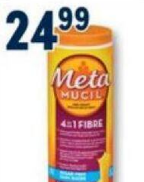
METAMUCIL Thérapie par les fibres/Fiber therapy, produits sélectionnés/selected products