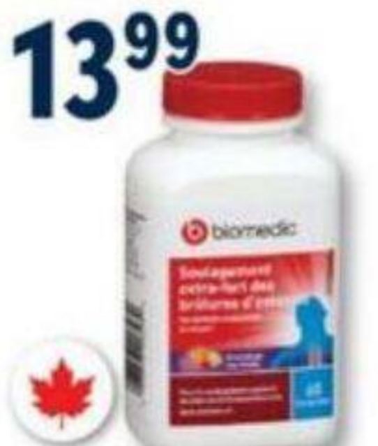
BIOMEDIC Soulagement des brûlures d'estomac Heartburn relief, 60 ou 100 comprimés/tablets