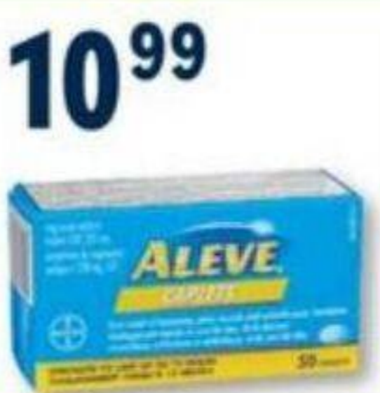
ALEVE Naproxène/Naproxen, 220 mg, 50 caplets ou 20 Nulti/Nighttime, 20 caplets