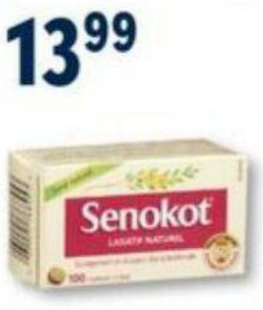
SENOKOT ou SENOKOT-S Laxatif/Laxative, formats sélectionnés/selected sizes