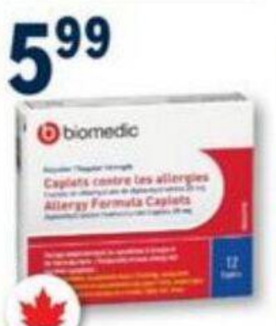
BIOMEDIC Allergies/Allergy, 25 mg, 12 caplets