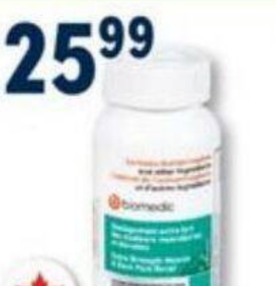
BIOMEDIC Soulagement des douleurs musculaires et dorsales/Muscle and back pain relief, 75 caplets ou 30 Platine, 60 caplets