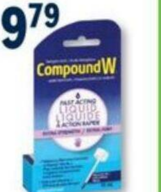
COMPOUND W Pour enlever les vernis/Mat removal, liquide/liquid, 10 ml ou gel, 7 g