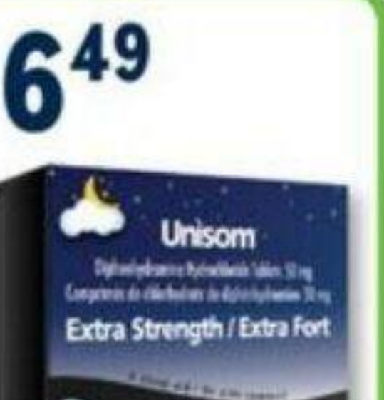
UNISON Aide au sommeil/Sleep aid, 20 unités/units