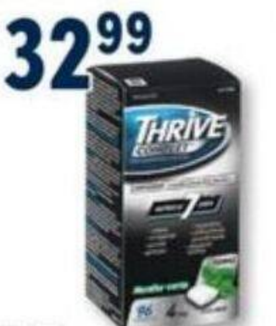
THRIVE Complets/Complete, Remplacement de la nicotine Nicotine replacement, 4 mg, 96 morceaux/pièces