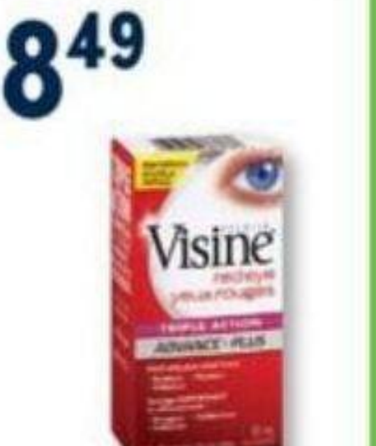
VISINE Gouttes oculaires sélectionnées Selected eye drops, 15 ml