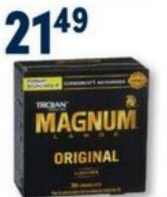
TROJAN Condoms sélectionnés Selected condoms