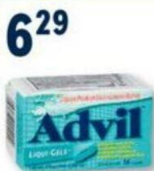
ADVIL Ibuprofène/Ibuprofen, 200 mg, 16 capsules