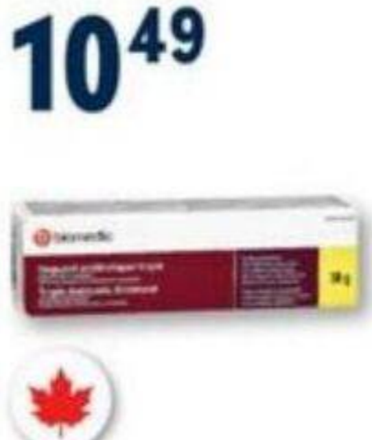
BIOMEDIC Onguent antibiotique triple ou complet Triple or complete antibiotic ointment, 30 g