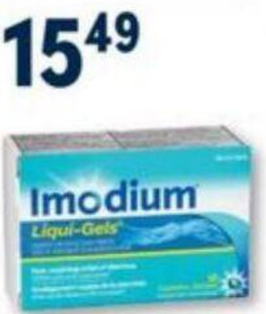
IMODIUM Soulagement de la diarrhée/Relief of diarrhea, formats sélectionnés/selected sizes