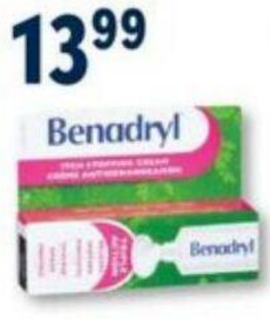
BENADRYL Crème anti-démangeaison Itch stopping cream, 28 g