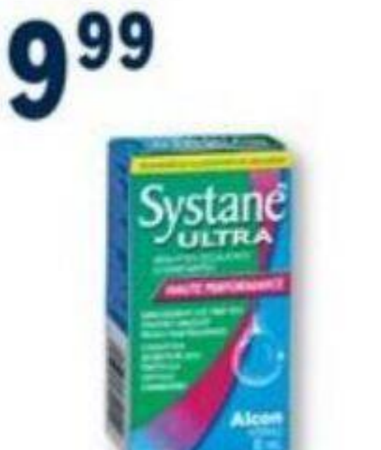
SYSTANE Gouttes oculaires lubrifiantes sélectionnées Selected lubricant eye drops