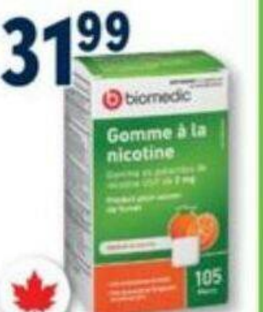
BIOMEDIC Gomme à la nicotine/Nicotine gum, 2 mg, 105 morceaux/pièces