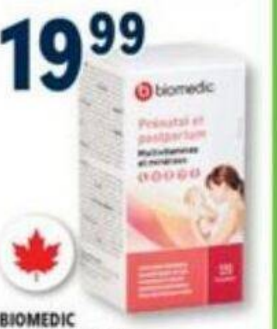
BIOMEDIC Prénatal et postpartum Prenatal and postpartum, Multivitamines et minéraux Multivitamins and minerals, 120 comprimés/tablets