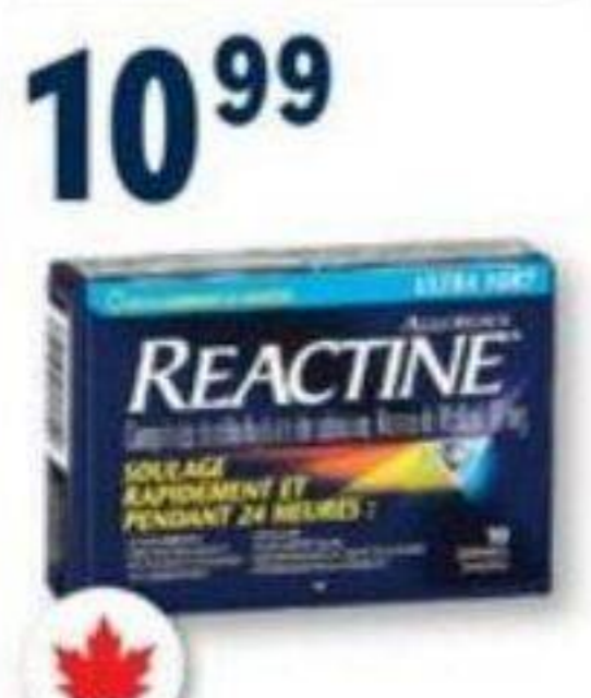
REACTINE ou BENADRYL Produits sélectionnés Selected products