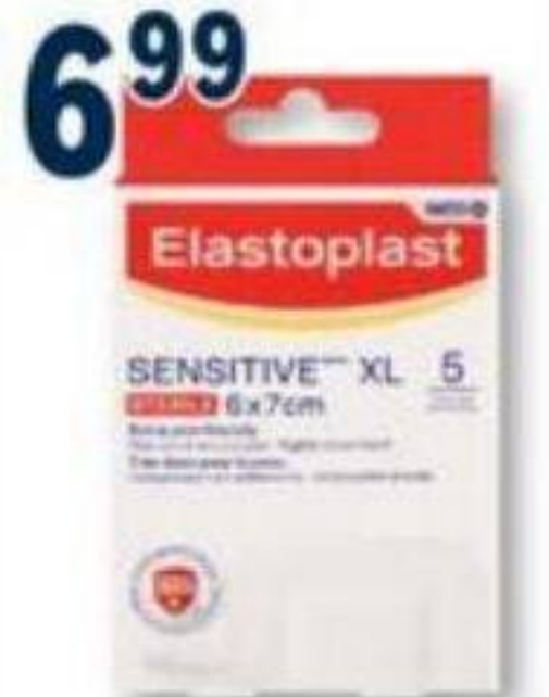
ELASTOPLAST Pansements sélectionnés Selected bandages