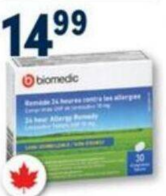
BIOMEDIC Comprimés USP de loratadine Loratadine tablets USP, 10 mg, 30 comprimés/tablets