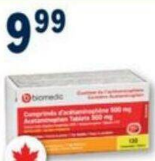
BIOMEDIC Acétaminophène/Acetaminophen, 500 mg, 130 comprimés ou caplets/tablets ou caplets ou 325 mg, 120 comprimés ou caplets tablets or caplets