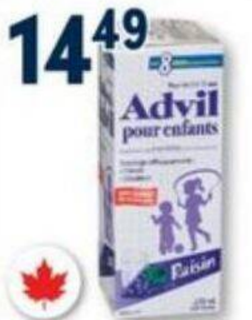
ADVIL Ibuprofène/Ibuprofen, Pour enfants/Children's, 230 ml ou 40 comprimés/tablets