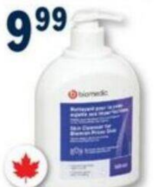
BIOMEDIC Nettoyant pour la peau sujette aux imperfections/Skin cleanser for blemish prone skin, 500 ml