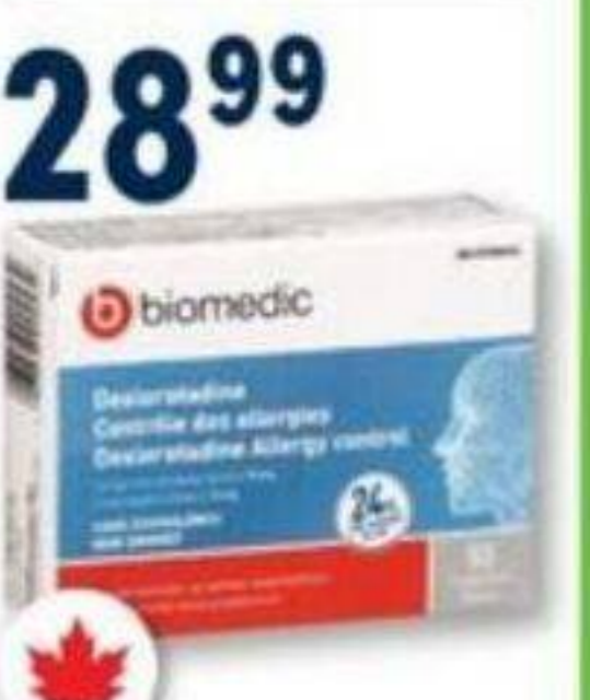
BIOMEDIC Desloratadine, Contrôle des allergies Allergy control, 5 mg, 50 comprimés/tablets