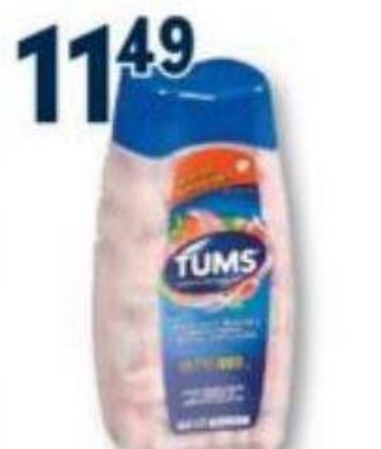
TUMS Antiacide/Antacid, produits sélectionnés selected products