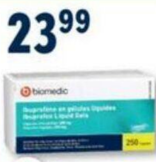
BIOMEDIC Ibuprofène/Ibuprofen, 200 mg, 250 gélules/capsules