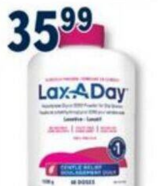
LAX-A-DAY Laxatif/Laxative, 1020 g