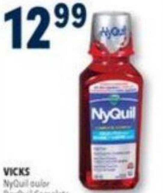
VICKS NyQuil ou 8 sachets de poudre/8 packets powder ou 15 ml Early Defence, Vaporisateur nasal/Nasal spray, 15 ml