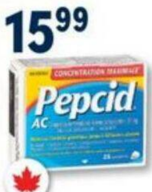
PEPCID AC ou PEPCID COMPLET Soulage les brûlures d'estomac Relieves heartburn, 25 ou 30 unités/units