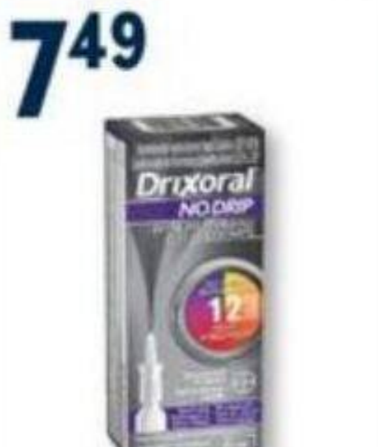
DRIXORAL Produits sélectionnés Selected products