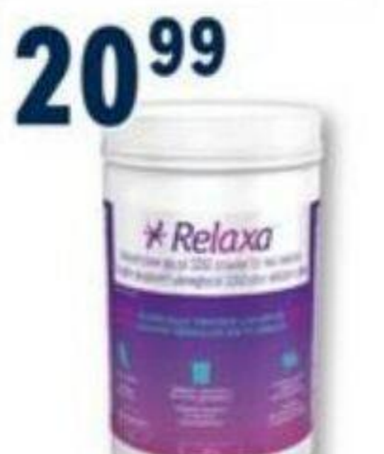
RELAXA Laxatif/Laxative, 510 g ou 30 sachets x 17 g