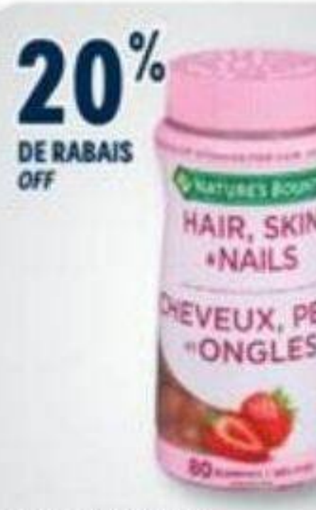
20% DE RABAIS OFF NATURE'S BOUNTY Produits sélectionnés Selected products