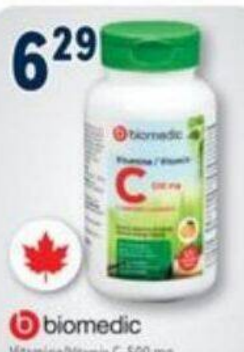
6 29 biomedic Vitamine/Vitamin C, 500 mg, 120 comprimés/tablets ou/ou Vitamine/Vitamin D 3 , 1000 UI/OU, 180 gélules/capsules