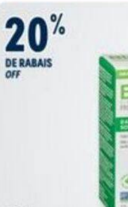
20% DE RABAIS OFF BIO-K+ Probiotiques sélectionnés Selected probiotics