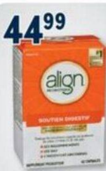
44 99 ALIGN Supplément probiotique Probiotic supplement, 42 capsules