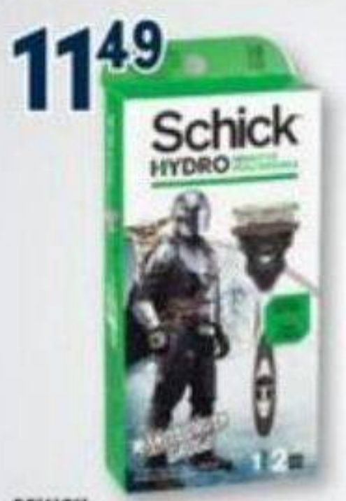
11 49 SCHICK Rasoirs sélectionnés Selected razors