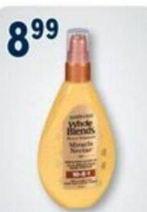
8 99 WHOLE BLENDS Soins capillaires sélectionnés Selected hair care products