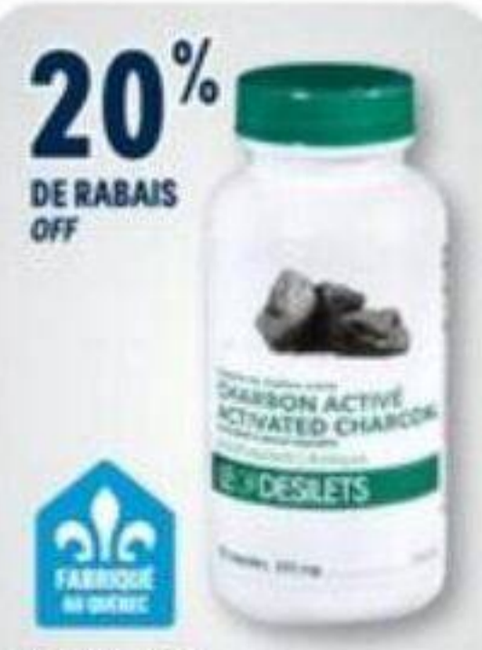
20% DE RABAIS OFF LEO DESILETS Produits naturels sélectionnés Selected natural products