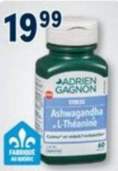
19 99 ADRIEN GAGNON Produits sélectionnés Selected products