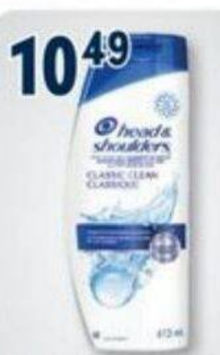
10 49 HEAD & SHOULDERS ou/ou PANTENE Pro-V Miracles, Shampoings sélectionnés Selected shampoos