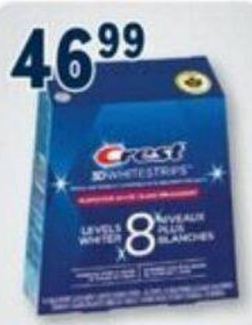
46 99 CREST 3D Whitestrips, Ensemble de blanchiment des dents Dental whitening kit, 14 traitements/tratements