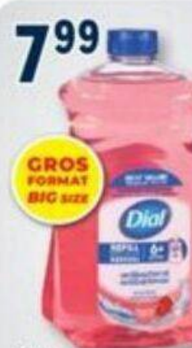
7 99 DIAL Savons à mains sélectionnés Selected hand soaps