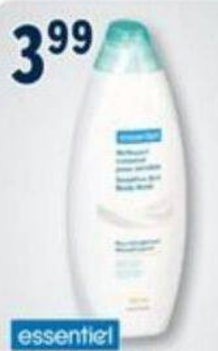
3 99 essentiel Nettoyant corporel/Body wash, 354 ml ou/ou Gel douche pour homme Men's body wash, 400 ml