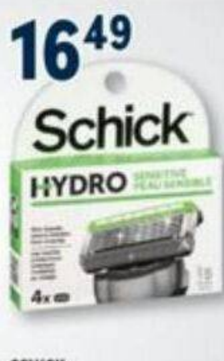
16 49 SCHICK Cartouches sélectionnées Selected cartridges