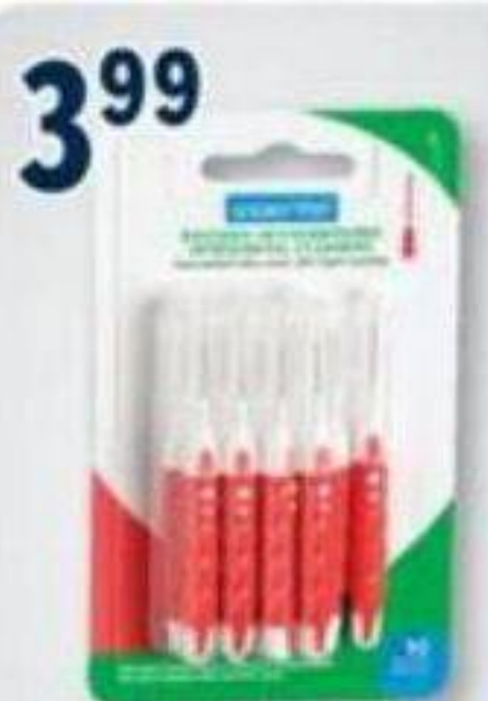
3 99 essentiel Brosses interdentaires sélectionnées Interdental cleaners, emballage de/pack of 10