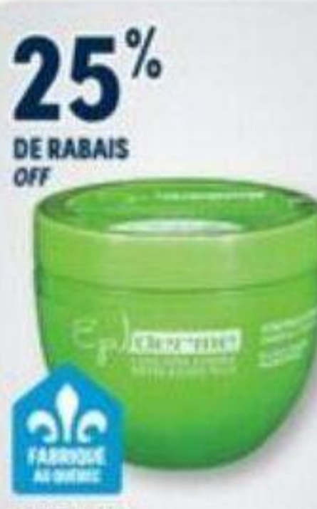
25% DE RABAIS OFF EPILDERME Produits dépilatoires sélectionnés Selected hair removal products