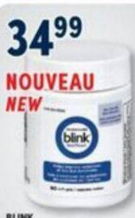
34 99 NOUVEAU NEW BLINK NutriTeas, Supplément de santé oculaire Eye health supplement, 60 capsules molles/soft gels