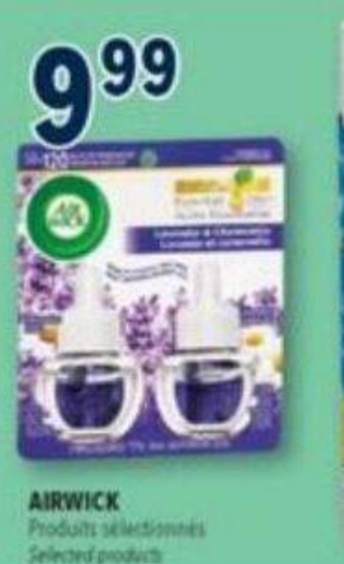
9 99 AIRWICK Produits sélectionnés Selected products