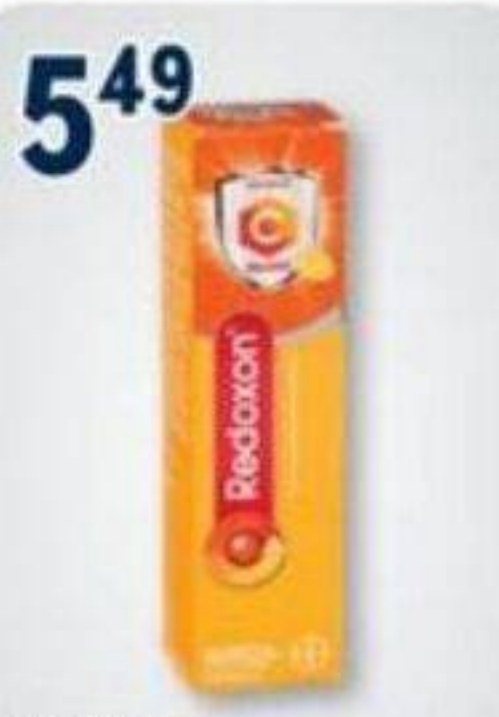
5 49 REDOXON Vitamines sélectionnées Selected vitamins