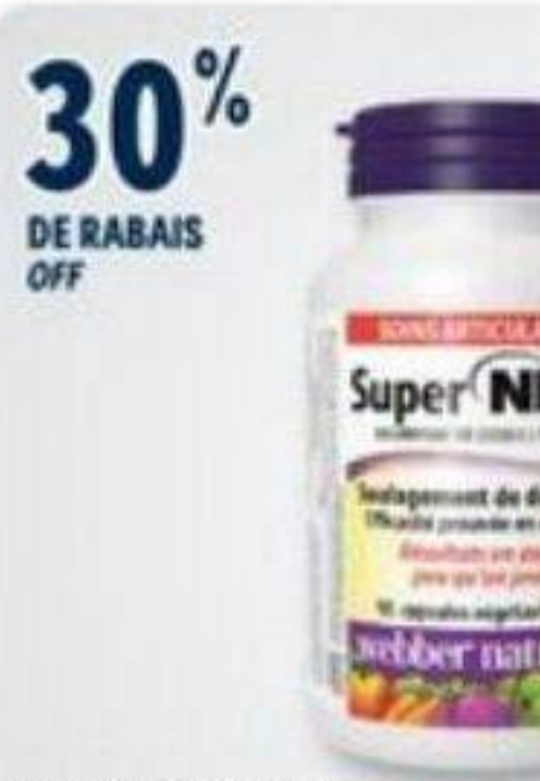
30% DE RABAIS OFF WEBBER NATURALS Produits sélectionnés Selected products