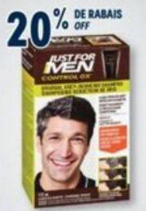
20% DE RABAIS OFF JUST FOR MEN Produits sélectionnés/Selected products