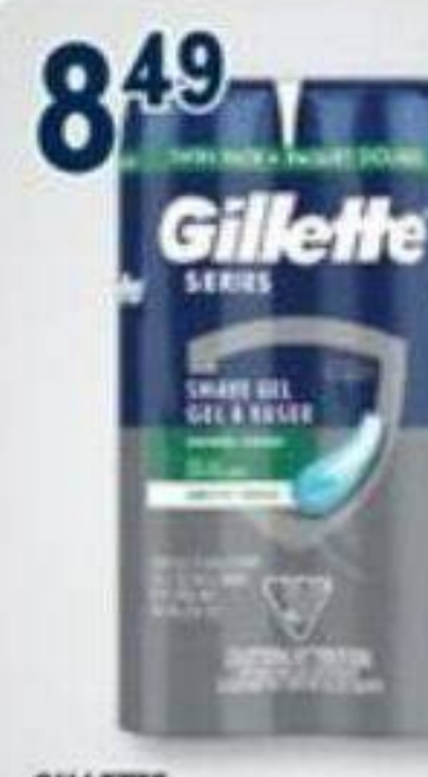
8 49 GILLETTE Series, Gel à raser Shave gel, 2 x 198 g