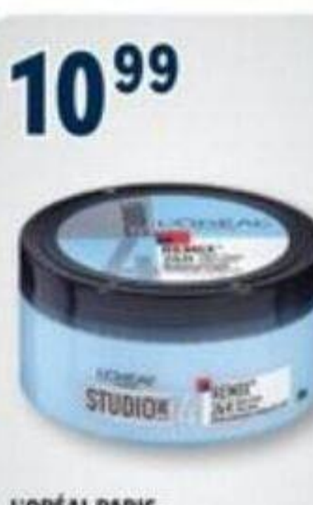
10 99 L'ORÉAL PARIS Studio Line, Produits capillaires sélectionnés Selected hair products