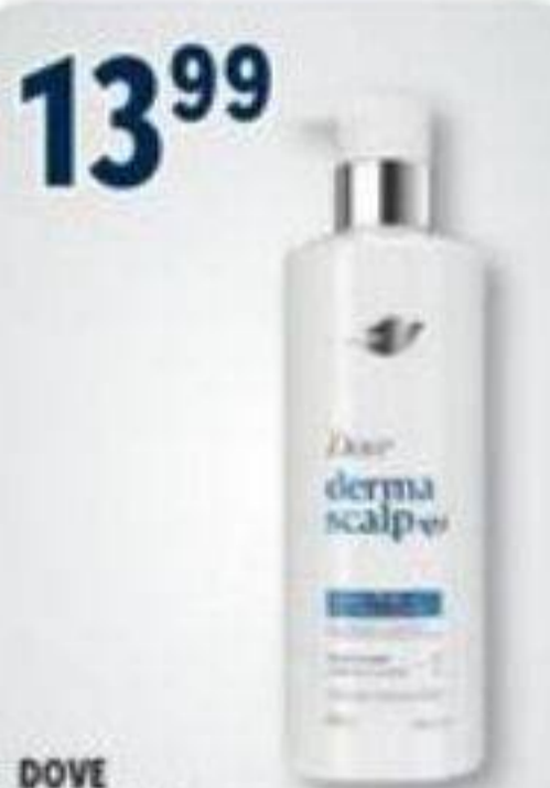
13 99 DOVE Derma Scalp, Shampoings ou revitalisants sélectionnés Selected shampoos or conditioners