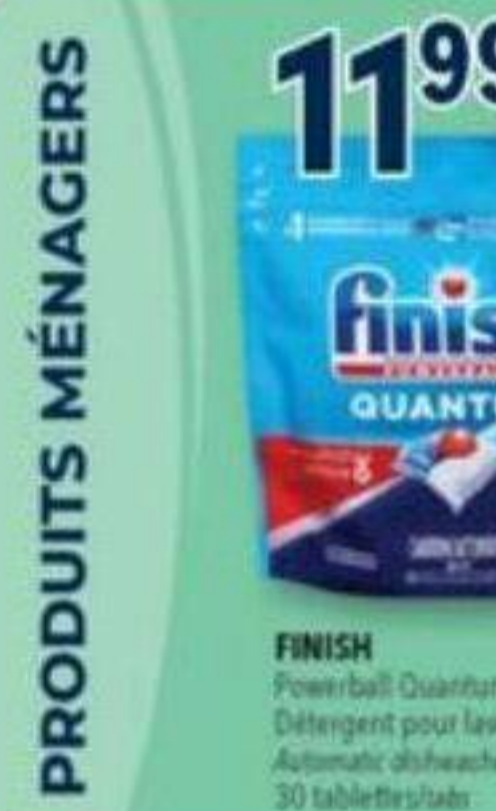
11 99 FINISH Powerball Quantum, Détergent pour lave-vaisselle Automatic dishwasher detergent, 30 tablettes/tablets