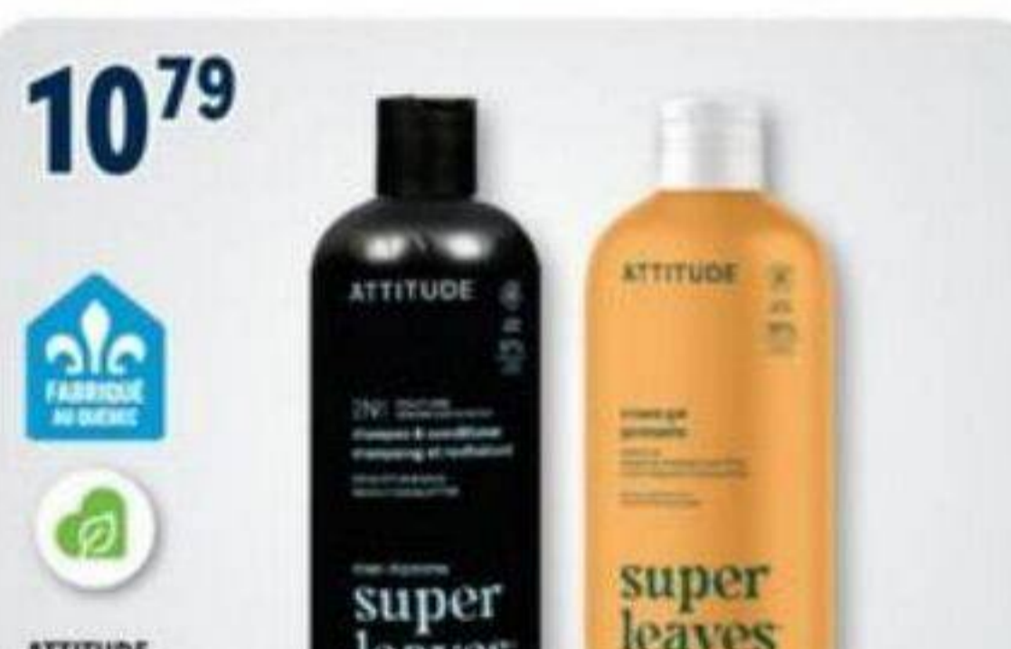
10 79 ATTITUDE Super Leaves, Produits sélectionnés Selected products