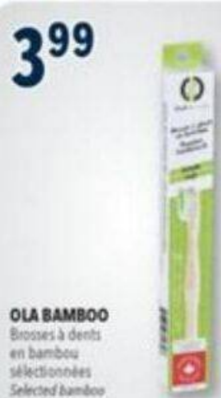
3 99 OLA BAMBOO Brosses à dents en bambou sélectionnées Selected bamboo toothbrushes