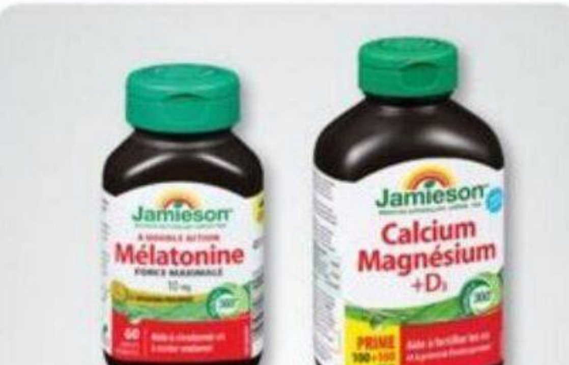
JAMIESON Produits sélectionnés/Selected products