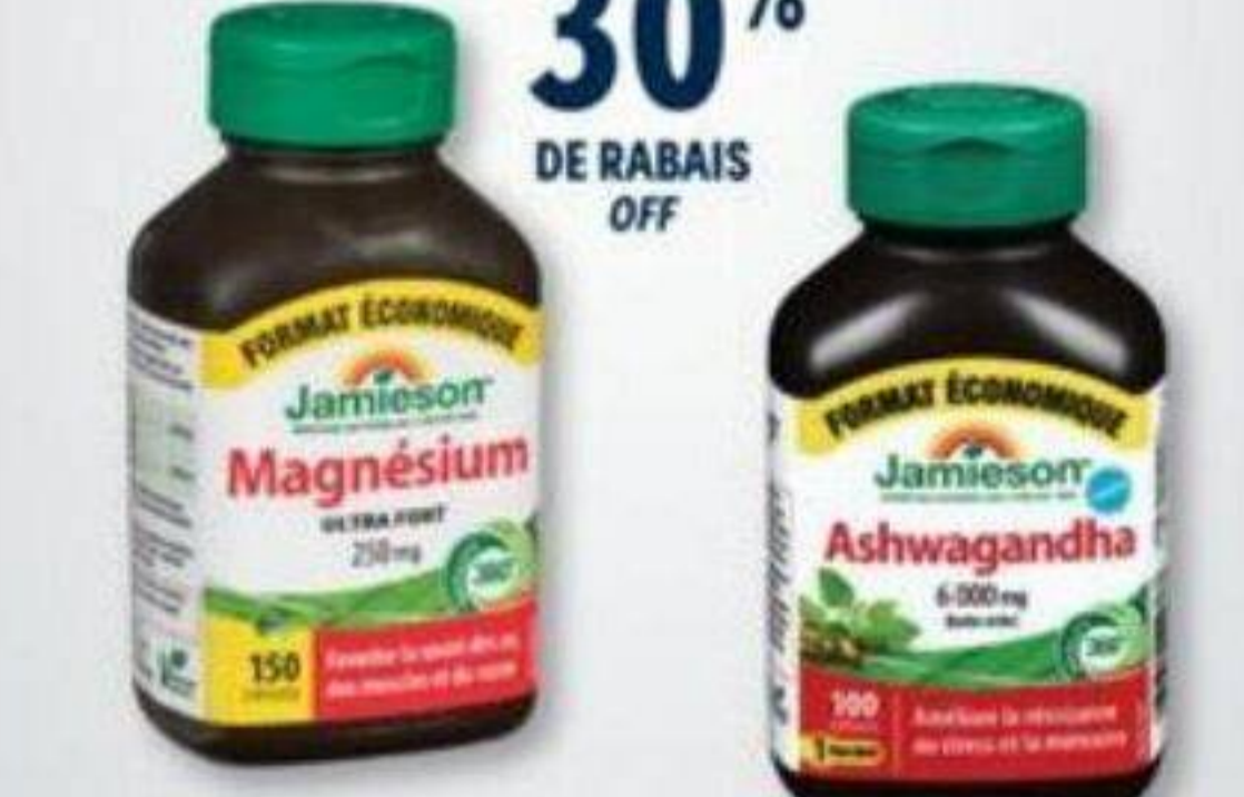
30% DE RABAIS OFF JAMIESON Produits sélectionnés/Selected products