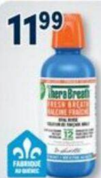
11 99 THERABREATH Solution de rinçage orale Oral rinse, 473 ml