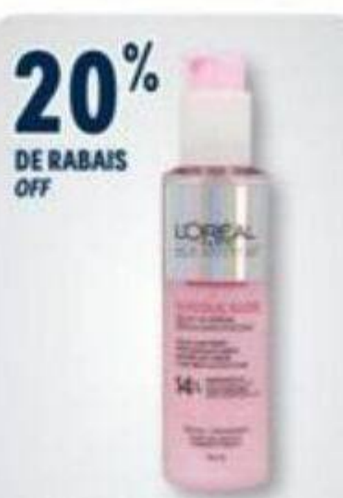
20% DE RABAIS OFF L'ORÉAL PARIS Produits capillaires sélectionnés Selected hair products