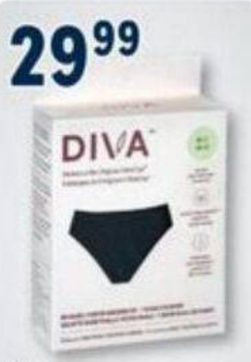
29 99 DIVA Culotte menstruelle réutilisable Reusable period underwear, 1 unité/unité