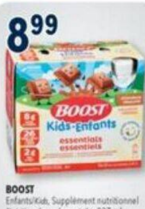
8 99 BOOST Enfants/Kids, Supplément nutritionnel Nutritional supplement, 6 x 237 ml Rég.: 15,99 SUCCURSALES PARTICIPANTES PARTICIPATING STORES