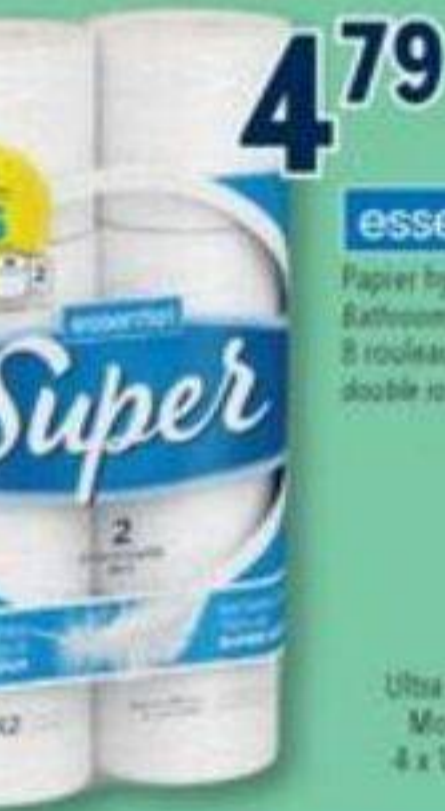
4 79 essentiel Papier hygiénique Bathroom tissue, 8 rouleaux doubles double rolls