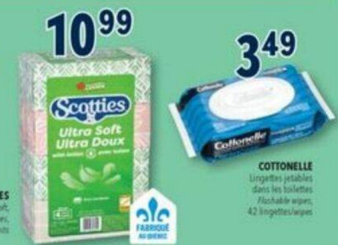
10 99 SCOTTIES Ultra Doux/Ultra Soft, Mouchoirs/Tissues, 4 x 104 unités/unités