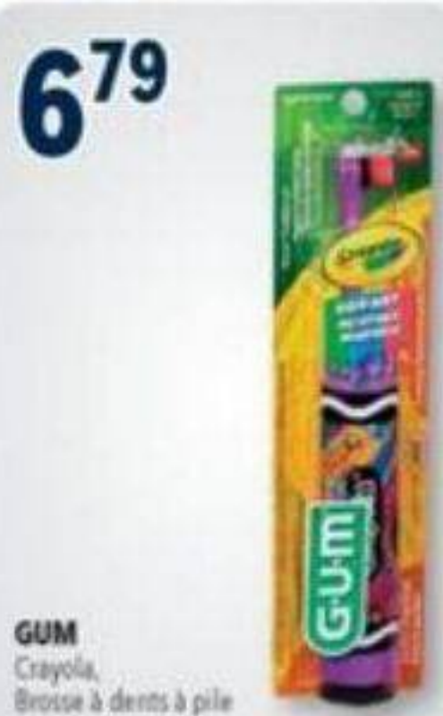
6 79 GUM Crayola, Brosse à dents à pile Power toothbrush