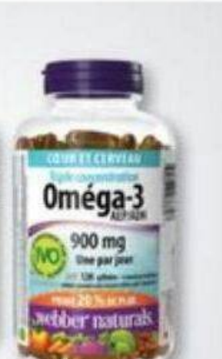
30% DE RABAIS OFF WEBBER NATURALS Produits sélectionnés Selected products