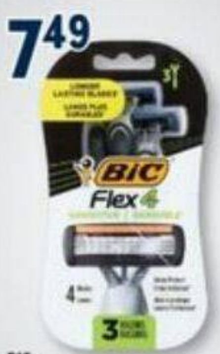
7 49 BIC Rasoirs jetables sélectionnés Selected disposable razors