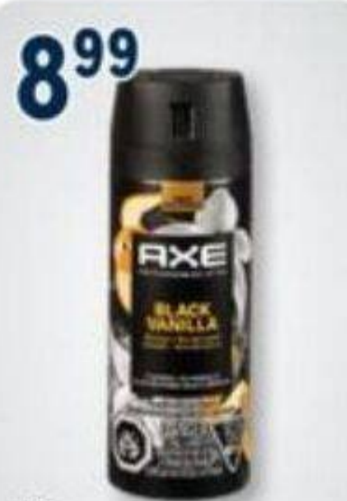
8 99 AXE Atomiseur corporel haut de gamme Premium body spray, 113 g