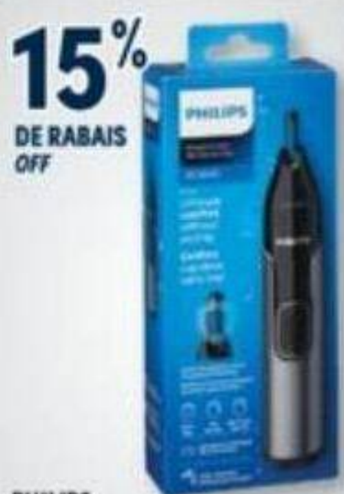
15% DE RABAIS OFF PHILIPS Produits électriques sélectionnés Selected electrical products