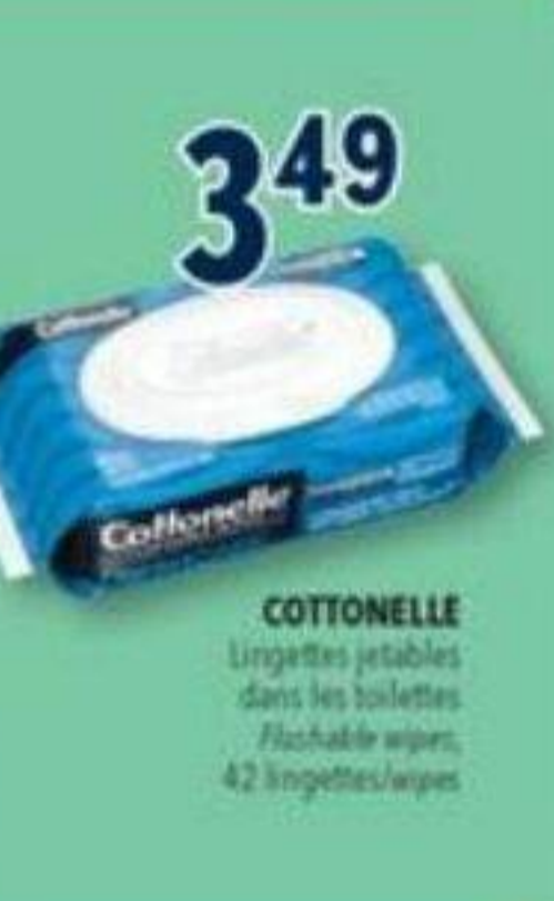
3 49 COTTONELLE Lingettes jetables dans les toilettes Flushable wipes, 42 lingettes/wipes