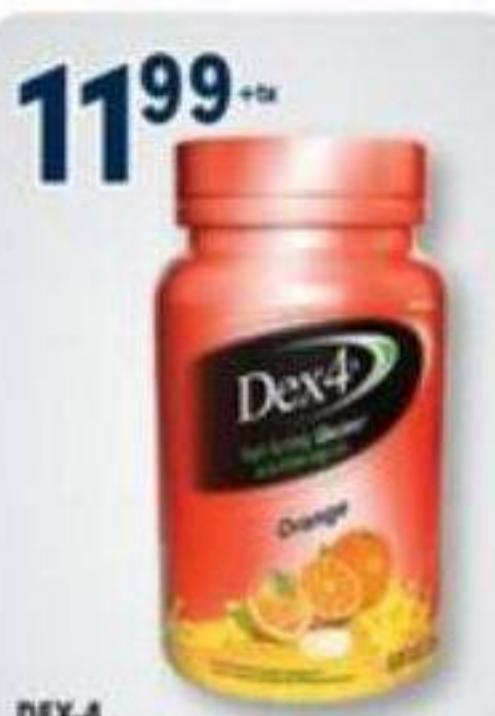
11 99 +x DEX-4 Glucose à action rapide/Acting glucose, 50 comprimés/tablets Rég.: 13,49 +x