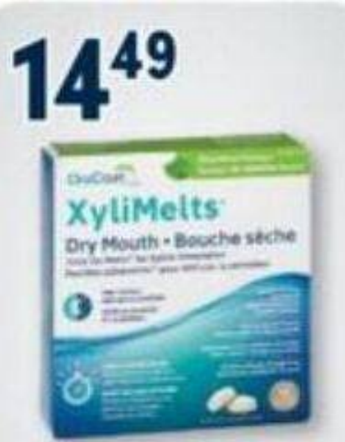
14 49 XYLIMELTS Pastilles adhésives pour stimuler la salivation/Stock or melts for saliva stimulation, 40 unités/unités