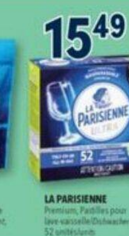
15 49 LA PARISIENNE Premium, Pastilles pour lave-vaisselle/Dishwasher tabs, 52 unités/unités