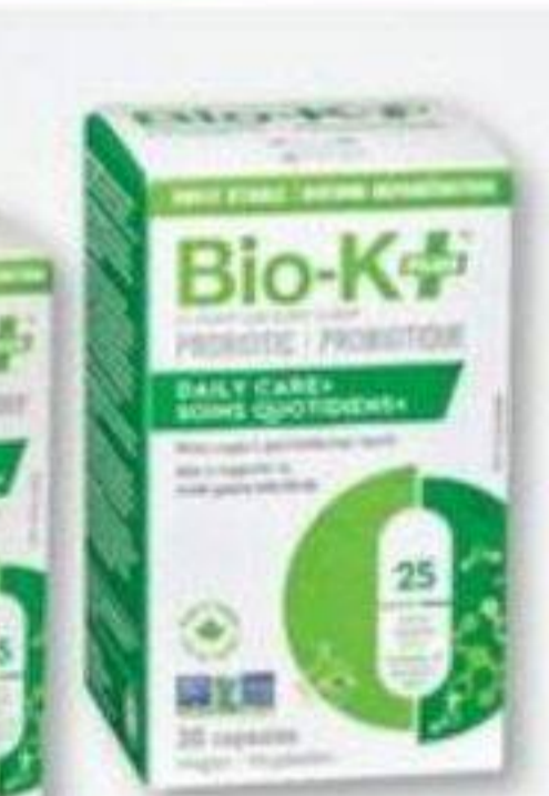
BIO-K+ Probiotiques sélectionnés Selected probiotics