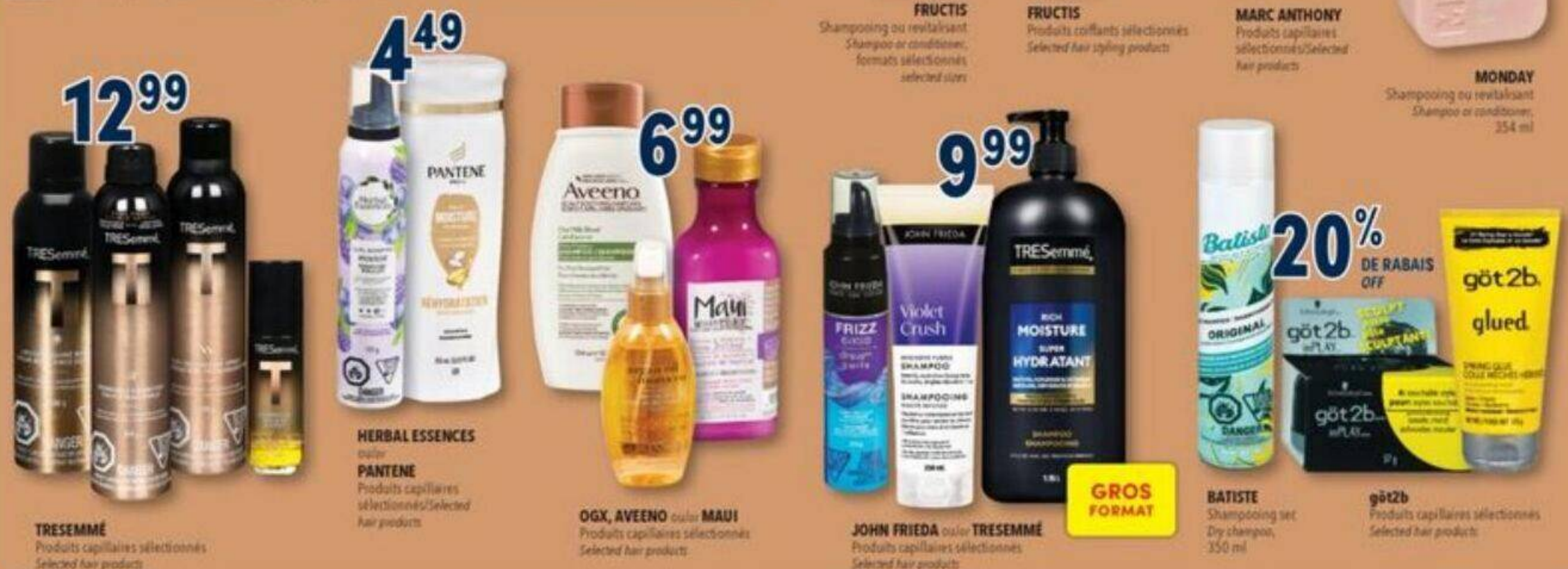
12.99 TRESemmé Produits capillaires sélectionnés Selected hair products 4.49 HERBAL ESSENCES PANTENE Produits capillaires sélectionnés/Selected hair products 6.99 OGX, AVEENO ou/ou MAUI Produits capillaires sélectionnés Selected hair products 9.99 JOHN FRIEDA ou/ou TRESemmé Produits capillaires sélectionnés Selected hair products GROS FORMAT 20% DE RABAIS OFF BATISTE Shampooing set Dry shampoo, 350 ml got2b Produits capillaires sélectionnés Selected hair products