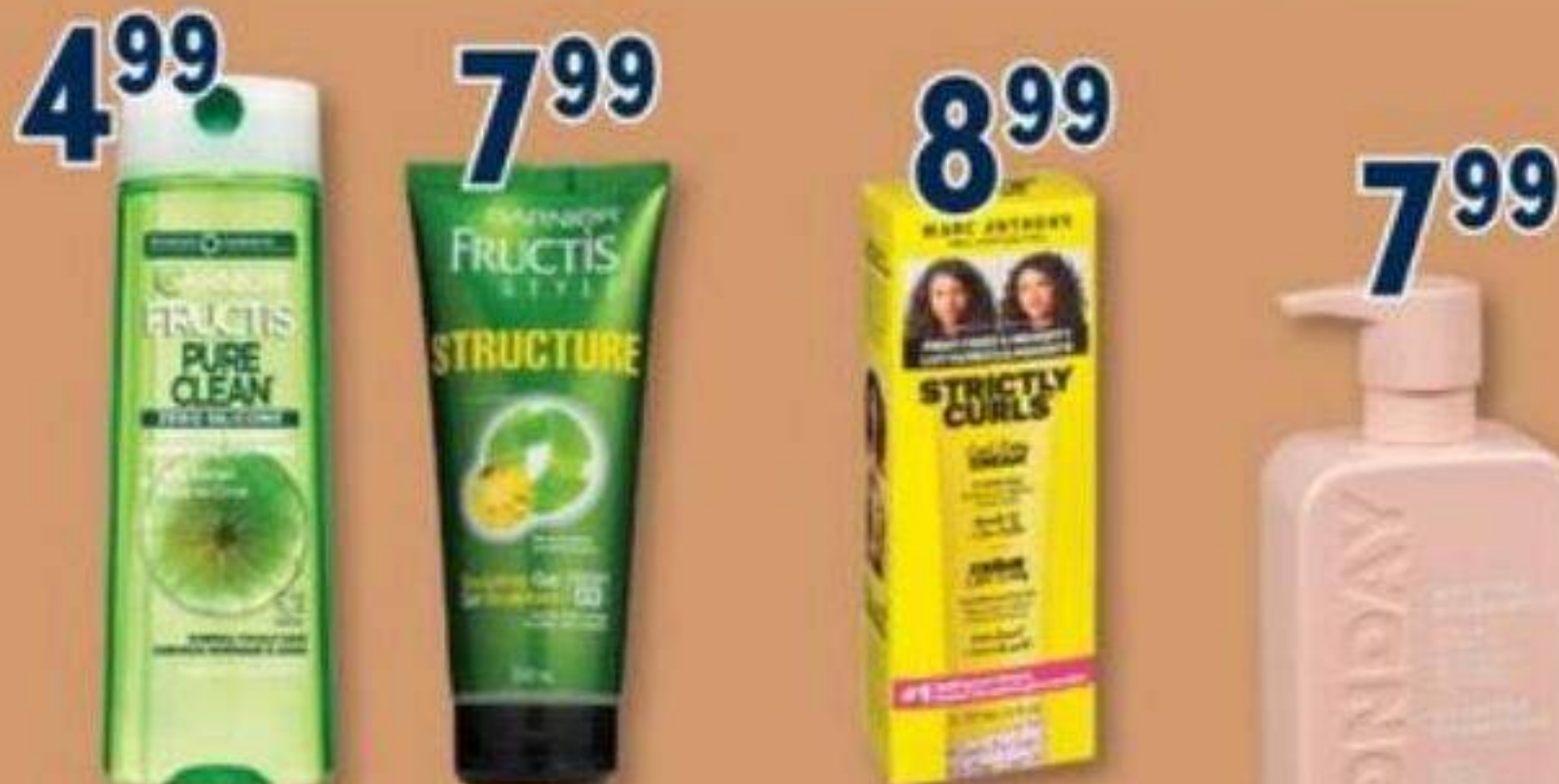
4.99 FRUCTIS Shampooing ou revitalisant Shampoo or conditioner, formats sélectionnés selected sizes 7.99 FRUCTIS Produits coiffants sélectionnés Selected hair styling products 8.99 MARC ANTHONY Produits capillaires sélectionnés/Selected hair products 7.99 MONDAY Shampooing ou revitalisant Shampoo or conditioner, 354 ml