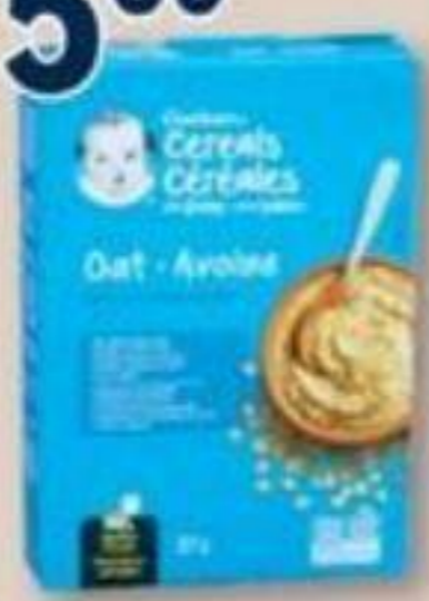
GERBER Céréales pour bébé Baby cereal, 227 g Rég.: 6,99