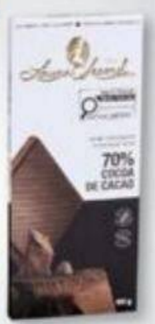
LAURA SECORD Barre de chocolat/Chocolate bar, 100 g Rég.: 4,49 +tx