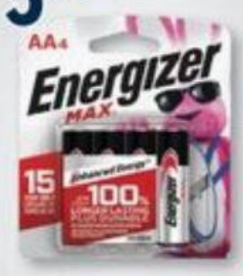
ENERGIZER Max, Piles alcalines sélectionnées Selected alkaline batteries Eco-frais inclus/Eco-fee included