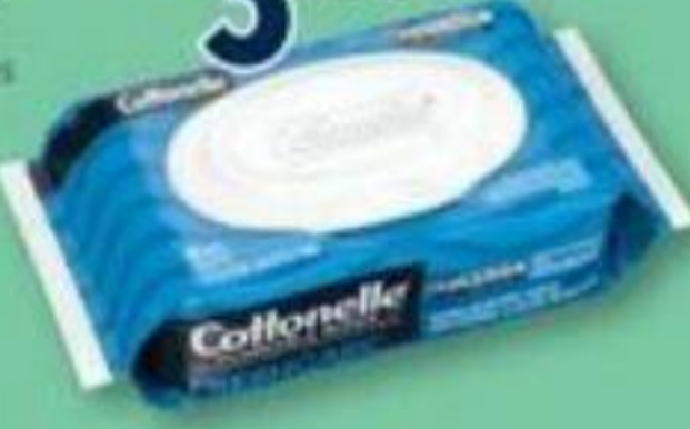
COTTONELLE Lingettes jetables dans les toilettes Flushable wipes, 42 lingettes/wipes