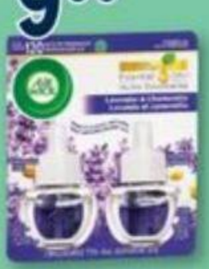
AIRWICK Produits sélectionnés Selected products