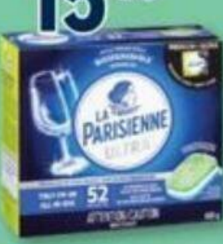
LA PARISIENNE Premium, Pastilles pour lave-vaisselle/Dishwasher tabs, 52 unités/unités