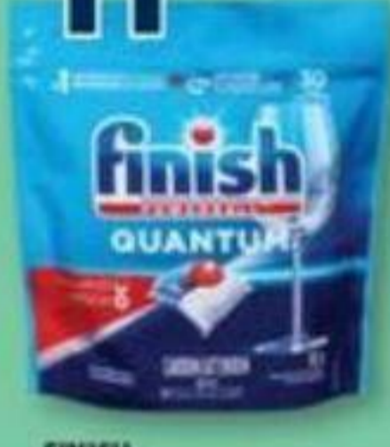
FINISH Powerball Quantum, Détergent pour lave-vaisselle Automatic dishwasher detergent, 30 tablettes/tablets