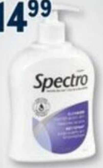
SPECTRO Produits sélectionnés pour les soins de la peau/Selected skin care products