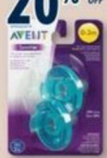
AVENT Produits sélectionnés pour bébé/Selected baby products