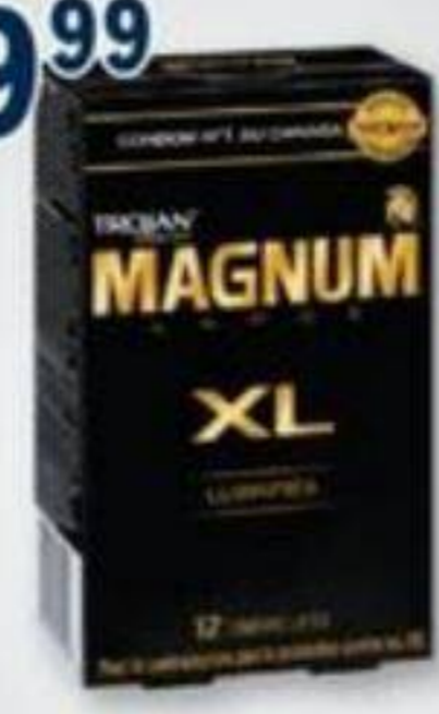
TROJAN Condoms sélectionnés Selected condoms