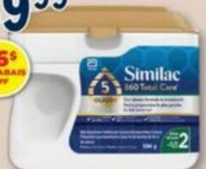
SIMILAC 360 Total Care, Préparation en poudre pour nourisson. Powdered infant formula, 584 g Rég.: 55,99