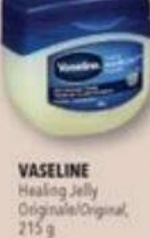
VASELINE Healing Jelly Originale/Original, 215 g