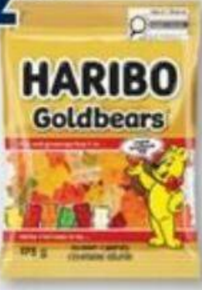
HARIBO Bonbons gélifiés/Gummy candies, 175 g Rég.: 3,49 +tx