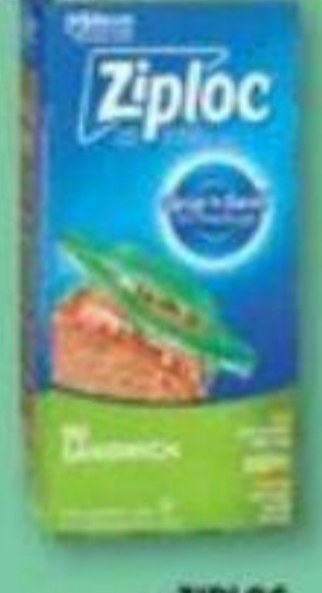
ZIPLOC Sacs à sandwich Sandwich bags, 90 unités/unités