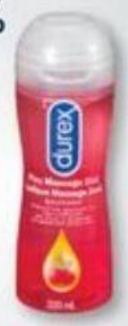
DUREX ou/ou K-Y Lubrifiants ou condoms sélectionnés Selected lubricants or condoms