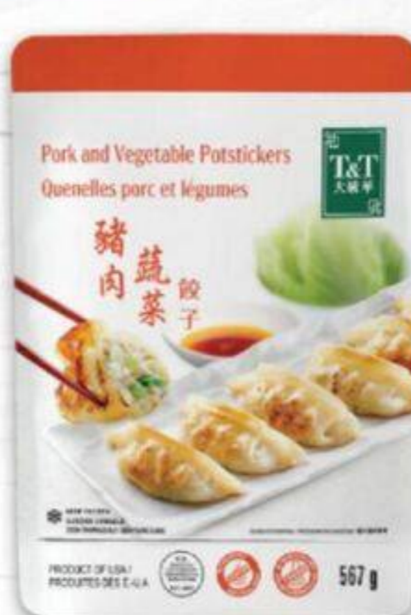
QUENELLES T&T SURGELÉES, CERTAINES VARIÉTÉS, 567 G POTSTICKERS 21495823_EA