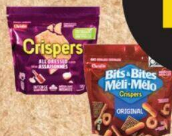
Craquelins Crispers ou Méli-Mélo Christie Certaines variétés, 145 g Christie Crispers Crackers or Bits & Bites Selected varieties, 145 g