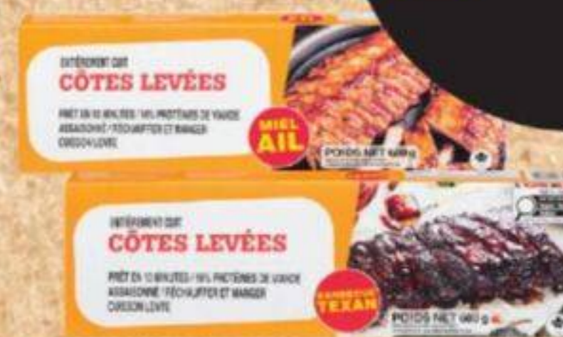
Côtes de dos de porc, entièrement cuites Certaines variétés, 680 g Pork Back Ribs, Fully Cooked Selected varieties, 680 g

PLUS BAS PRIX PLUS GROS RABAIS LOWEST PRICES BEST DEALS