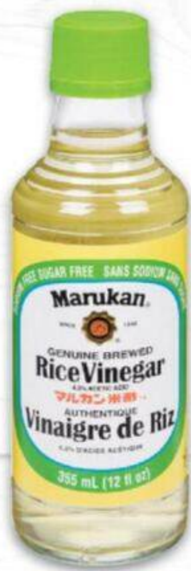
VINAIGRE DE RIZ MARUKAN CERTAINES VARIÉTÉS 355 ML RICE VINEGAR 20321753001_EA