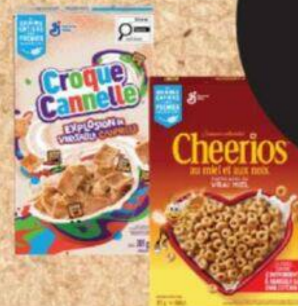
Céréales Cheerios ou Croque Cannelle Certaines variétés, 260 - 292 g Cheerios or Cinnamon Toast Crunch Selected varieties, 260 - 292 g