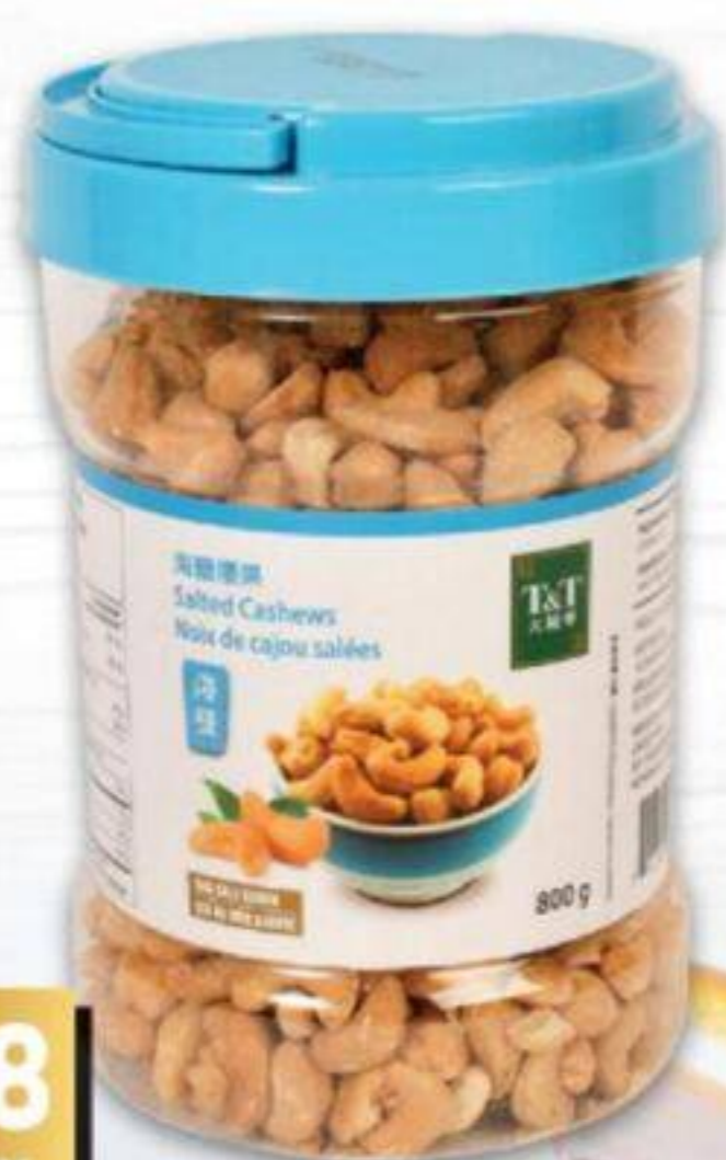
NOIX DE CAJOU T&T CERTAINES VARIÉTÉS 800 G CASHEWS 20807760_EA