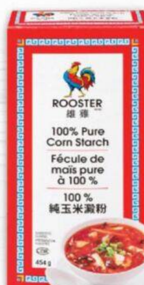
FÉCULE DE MAÏS ROOSTER® 454 G CORN STARCH 21047841_EA