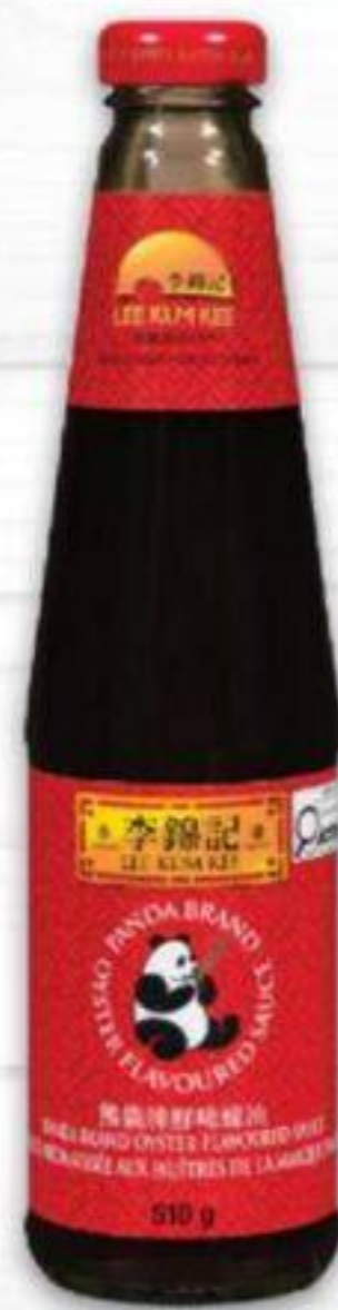
SAUCE AUX HÛÎTRES LEE KUM KEE 510 G OYSTER SAUCE 20139600_EA