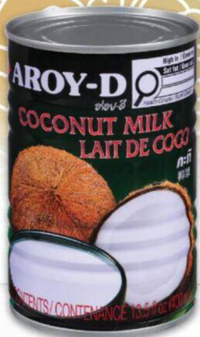
LAIT DE COCO AROY-D CERTAINES VARIÉTÉS 400 ML COCONUT MILK 20063864_EA