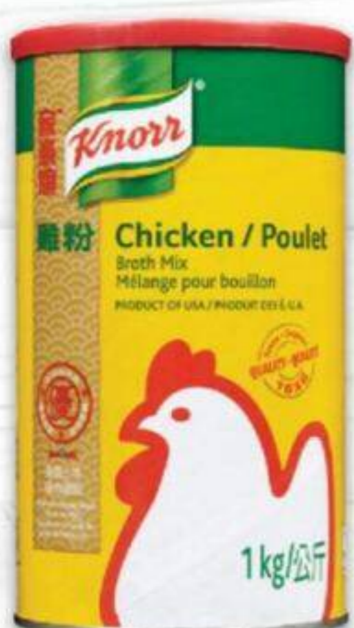
MÉLANGE POUR BOUILLON DE POULET KNORR CERTAINES VARIÉTÉS, 1 KG CHICKEN BOUILLON BROTH MIX 20154074_EA