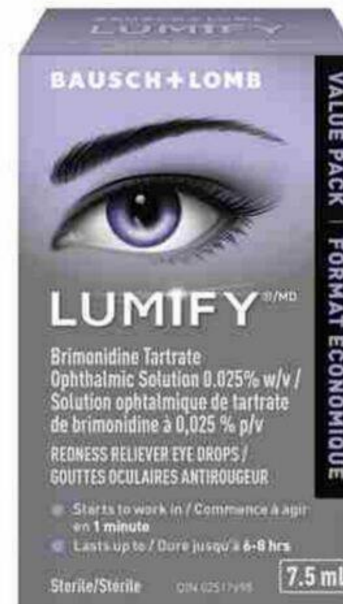
Format économique 7,5 ml

Apprenez-en davantage sur LumifyEyeDrops.ca