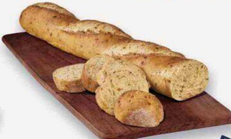
tomates séchées assaisonnées