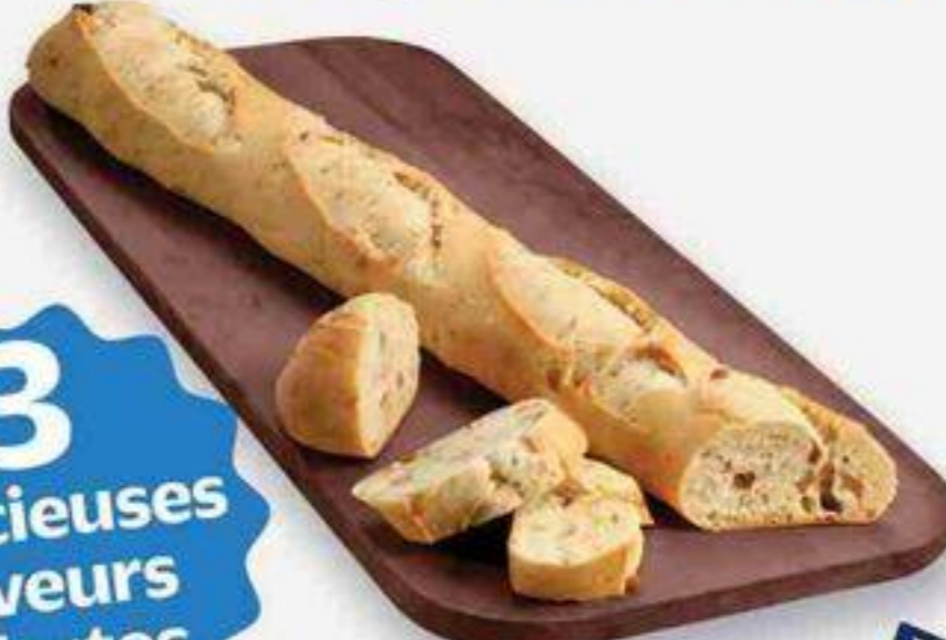
figues et miel